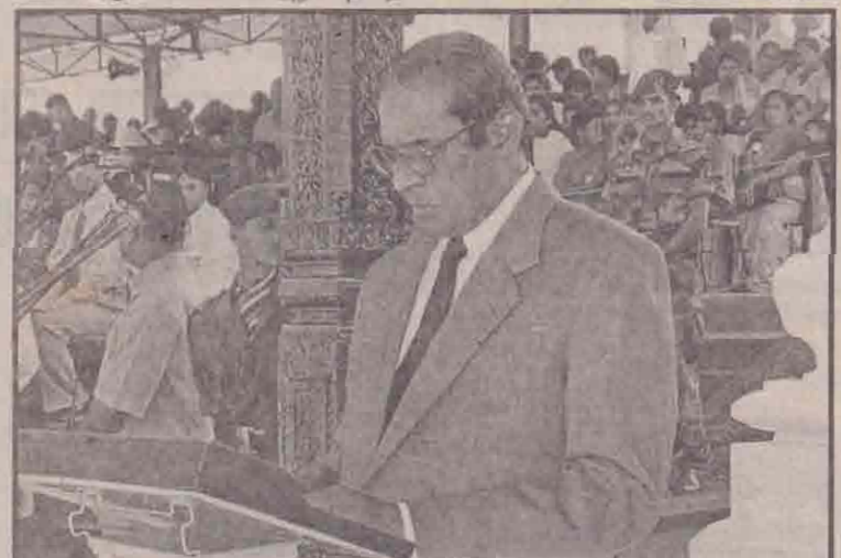
கடந்த டிசம்பர் 29ஆம் திகதி தியத்தலாவ இராணுவப் பயிற்சிக்கல்லூரியில் பயிற்சியை முடித்து வெளியேறிய ஒரு தொகுத் படையினரின் அணிவகுப்பு நிகழ்வில் பாதுகாப்பு அமைச்சர் திலக் மாரப்பன உரையாற்றிய காட்சி.

யாழ்ப்பாணம், ஜன.29 ஏழாலை, குப்பிளான் பகுதிகளில் செயற்படும் கசிப்புக்கு எதிரான செயற்குழுவின் உறுப்பினர்கள் மீது இனத்தெரியாதவர்களால் கடந்த சனிக்கிரமம் நள்ளிரவு அபிட் விசப்பட்டது இதில் செயற்குழு உறுப்பினர் ஒருவர் காயம் அடைந்தார். குப்பிளான் தெற்கு ஏராளகலாசனசமூக நிலையத்தின் ஏற்பாட்டின் கீழ் செயற்பட்டுவரும் இந்தக் குழுவின. உறுப்பினர்கள் கசிப்பு ஒழிப்பு கண்காணிப்பை முடித்துவிட்டு சனசமூக நிலையத்தில் உறங்கிக் கொண்டிருந்தவர்கள் மீதே அபிட் விசப்பட்டது. (ஐ)