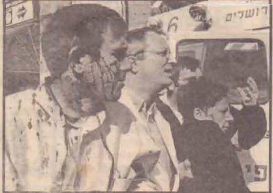
தாக்குதலில் காயப்பட்ட ஒருவரை அம்புலனில் ஏற்றுவுதற்காக அழைத்துச் செல்லும் காட்சி.

பலஸ்தீன அதிகாரசபை இந்தத் தற்கொலைத் தாக்குதலைக் கண்டித்துள்ளது. மேற்குக் கரையில் மீண்டும் அமைதியை நிலைநாட்டுவதற்கு அமெரிக்காவின் விசேட தூதர் அந்தோனி எஸினி உடனடியாக மத்திய கிழக்குக்குத் திரும்பி வருவேண்டும் என்றும் அது கேட்டுள்ளது. இஸ்ரேலியத் தலைநகரான ரெல் அலிவில் தற்கொலைத் தாக்குதல் இடம்பெற்ற இரு நாட்கள் கழித்து இந்தத் தற்கொலைத் தாக்குதல் இடம்பெற்றது என்பது குறிப்பிடத்தக்கது. (ம)