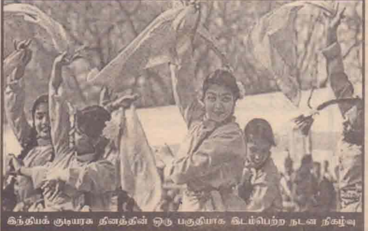
இந்தியக் குடியரசு தினத்தில் ஒரு பகுதியாக இடம்பெற்ற நடவடிக்கை

இந்தச் சாதனையை கின்னஸ் புத்தகத்தில் இடம்பெறச் செய்வதற்கு கல்லூரி நிர்வாகம் முயற்சிகளை மேற்கொண்டுள்ளது. (ம)