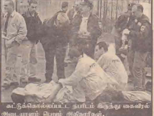
சுட்டுக்கொல்லப்பட்ட நபரிடம் சிறந்து கைவிரல் அடையாளம் பெறும் அதிகாரிகள்.

இஸ்ரேலில் தாக்குதல் நடத்தவே இவர் வந்ததாக இஸ்ரேலியப் பொலீஸார் கூறுகின்றனர். ஆனால் இந்த நபரிடம் எந்த ஆயுதமும் இருக்கவில்லை என்று நேரில் பார்த்தவர்கள் தெரிவித்துள்ளனர். இந்தச் சம்பவம் 16 மாதங்களாகத் தொடரும் இஸ்ரேல்-பலஸ்தீன இரத்தக்களரியை மேலும் தீவிரமாக்கும் என்று ரொய்ட்டர் செய்தியாளர் தெரிவித்தார். (ம)