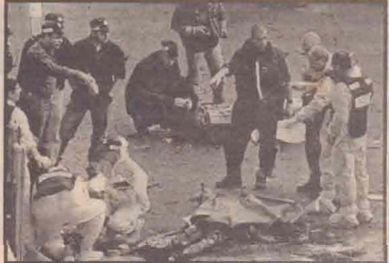
தற்கொலைக் குண்டுத் தாக்குதல் இடம்பெற்ற பகுதியில் சோதனை நடத்தும் அதிகாரிகள்.

ஜெருசலேம், ஜன. 29 இஸ்ரேலிய நகரான ஜெருசலேமில் பெண் தற்கொலையாளி ஒருவர் நடத்திய குண்டுத் தாக்குதலில் பலஸ்தீனர் ஒருவர் கொல்லப்பட்டார்; 40இற்கும் அதிக