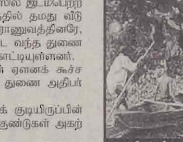
தீவிபத்து இடம்பெற்ற ஒருவார காலமாகியும் அங்குள்ள கால்வாயில் உள்வெண்களை மீட்கும் பணி தொடர்கிறது. உயிர்த்திய முடியவர்கள் கால்வாயில் விழுந்து முழுகி உயிரிழந்ததை குறிப்பிட்டுக்கொள்வதில்