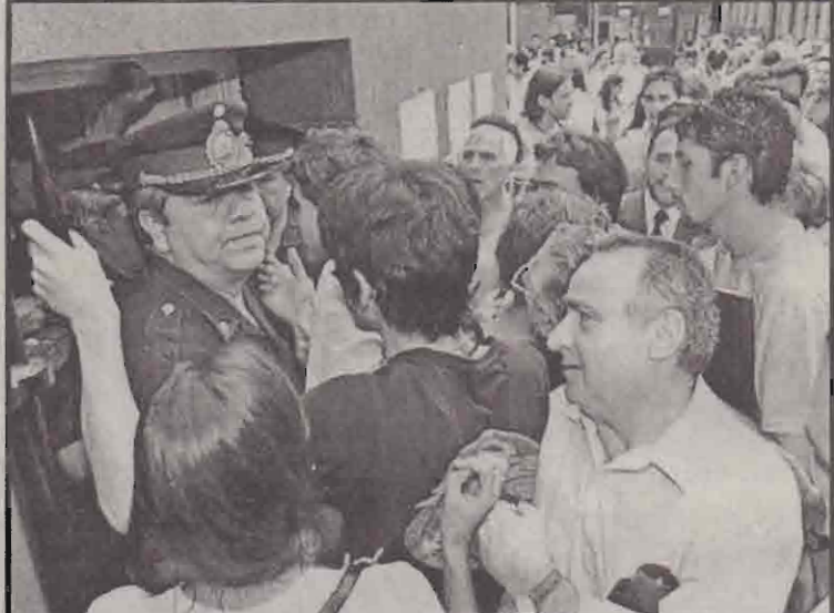
பலகோடி டொலர்கள் மதிப்புள்ள வெள்ளாட்டுக் கடன்களைத் திருப்பிச் செலுத்த முடியாது மோசமான பொருளாதார சீர்குலைவில் சிக்கியுள்ள ஆர்ஜென்டினாவில் அந்நாட்டு நாயகமான ரிபேரோவின் மதிப்பு வரையில் அகலபாதமளவுக்கு குறைந்துவிடும் என்று அஞ்சப்படுகிறது. இதனால் தமது சேரியுக்களை அமெரிக்க டொலர்களாக மாற்றுவதில் ஆர்ஜென்டினா கள் ஆர்வம் காட்டி வருகின்றனர். போனாஸ் சியர்வில் உள்ள தேசிய வங்கியில் டொலர்களை வாங்கிக் கொள்ள ஆவேசத்துடன் முண்டியடிக்கும் ஆர்ஜென்டினார்களை படத்தில் காணலாம்.

கனிப்பு நடத்தவேண்டுமென்றும் - மடகஸ்கர் உயர்நீதிமன்றம் உத்தரவிட்டுள்ளது. இந்த நிலையில் கடந்த சில நாட்களாக தலைநகர் அன்றாரிவோவில் ஆயிரக்கணக்கான மக்கள் ஒன்று திரண்டு ஆர்ப்பாட்டம் செய்துவருகின்றனர். எதிர்க்கட்சி வேட்பாளர் ரவலோமோனாவை ஜனாதிபதியாகப் பிரகடனப்படுத்தும்படி அவர்கள் வலியுறுத்தி வருகின்றனர். தற்போதைய அதிபர் மியே ராசிகார கடந்த 20 ஆண்டுகளாக பதவியில் இருந்து வருகிறார் என்பது குறிப்பிடத்தக்கது. (ஏ-1)