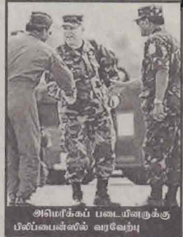
அமெரிக்கப் படையினருக்கு பிலிப்பைன்ஸில் வரவேற்று

பயிற்சியை நேற்றுமுன்தினம் ஆரம்பித்தனர் ஆனால் பயிற்சியின் முதல்