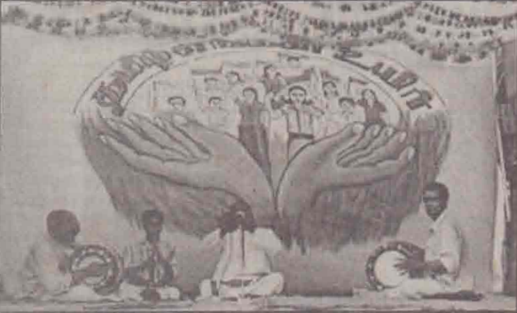
மன்னார் முக்தரிப்புப் பகுதியில் 'தமிழ் எங்கள் உயிர்' எழுச்சி நிகழ்வின் கிழிதோள் விழா கடந்த வியாழன்ன்று நடைபெற்றது. விழாவின் தொடக்கத்தில் கிடம்பெற்ற மங்கள கிளை நிகழ்வின் காட்சி.