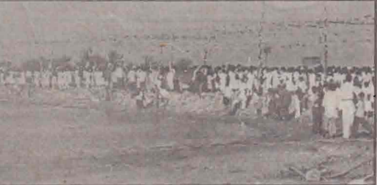
விழாவின் கலந்துகொள்வதற்காக படையினரின் கட்டுப்பாட்டில் உள்ள மன்னாரின் பல பகுதிகளிலும் இருந்து ஆயிரக்கணக்கானோர் மைதானத்துக்கு வந்த காட்சி.