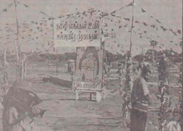
விழா நடைபெற்ற அல்லாஹ் கோட்டை மைதானத்துக்கு அருகே கடல் நேரில் பகுதியில் காணப்பட்ட பதாகைகள்.