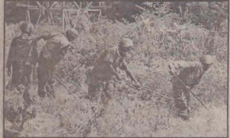
கண்டி நெடுஞ்சாலையைத் திறப்பதற்கான ஏற்பாட்டுப் பணிகள் ஓய்ந்ததைப் பகுதியில் நடைபெற்று வருகின்றன. புலிகளும், அரகப் படைகளும் தத்தமது பகுதிகளில் புதைக்கப்பட்டிருக்கும் கண்களை அகற்றும் பணியை ஆரம்பித்துள்ளனர். ஓய்ந்ததைப் பகுதியில் படைச் சீப்பாய்கள் கண்ணீர்வடிவகளை அகற்றும் பணியில் ஈடுபட்டிருப்பதைப் படத்தில் காணலாம்.