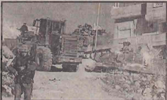
மேற்குக்கரையின் நப்லஸ் நகரில் புல்டோஸர் டாங்கிகளுடன் இஸ்ரேலியப் படையினர்.

இதற்கிடையில், மேற்குக்கரை நகரான நப்லஸில் இஸ்ரேலிய இராணுவம் சுற்றிவளைப்புத் தேடுதல் நடத்தியது. அங்கு பலஸ்தீனத் தீவிரவாதிகள் மூவர் கைது செய்யப்பட்டனர். இரு டாங்கிகள் மற்றும் ஒரு 'புல்டோஸர்' ஆகியவற்றுடன் அப்பகுதியைச் சுற்றிவளைத்த இஸ்ரேலியப் படையினர் சிறுகுன்றின் மீது, அப்பிரதேசம் முழுவதையும் கண்காணிக்கும் வகையில் அமைந்திருந்த கட்டத்தை நம்வசப்படுத்தினர். அந்தக் கட்டத்தில் வசித்த 3 பலஸ்தீனக் குடும்பத்தவர்களும் கட்டாயத்தின் பேரில் வெளியேற்றப்பட்டதாக நேரில் கண்டவர்கள் தெரிவித்தனர்.