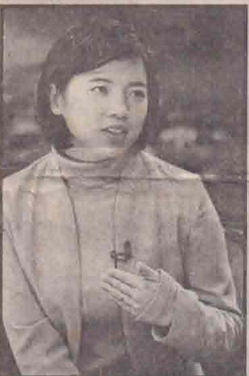
செல்வி கு மே பெங்

கைது செய்யப்பட்டு வழக்கை எதிர்ப்புக் கொண்டுள்ளனர்.