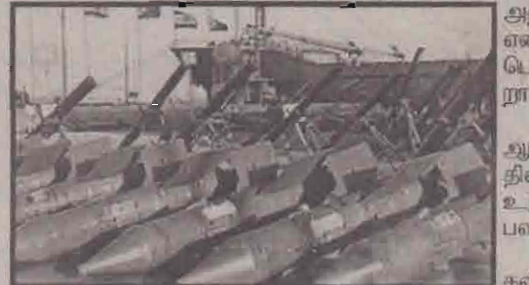
'கரீன் - ஏ' கப்பலில் இருந்து கைப்பற்றப்பட்ட ஆயுதங்கள் சிலவற்றைக் காணலாம்.