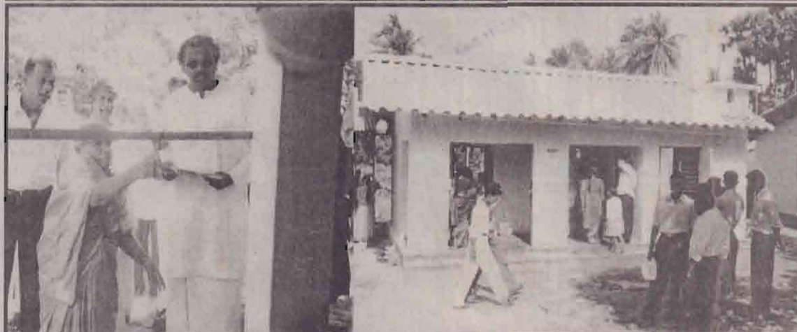
லண்டன் சிவபோகம் அறக்கட்டளை நிறுவன உதவியுடன் கத்தரோடையில் அமைக்கப்பட்ட அன்னை யருக்கான கில்லங்களைத் திறந்து வைத்து உரிமையுடைய கையாளுகும் வைபவம் கடந்த 10 ஆம் திகதி நடைபெற்றது.