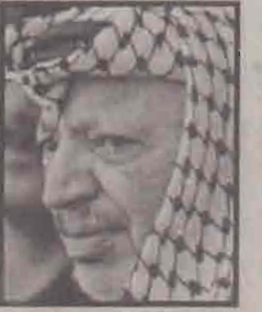
அதிகார சபைத் தலைவர் என்ப ரீதியிலேயே அவர் பொறுப்பேற்றுள்ளார்" என்றார் பவல்.

ஜெருசலேம், பெப். 15 கடந்த ஜனவரி மாதம் கருங்கடலில் வைத்து இஸ்ரேலியக் கடற்படையால் தடுத்து நிறுத்தப்பட்ட 'கரீன் - ஏ' என்ற கப்பலில் கடத்தப்பட்ட ஆயுதங்கள் பலஸ்தீன அதிகார சபைக்கே எடுத்து வரப்பட்டன என்று பலஸ்தீன தலைவர் யஸீர் அரபாத் ஏற்றுக்கொண்டுள்ளார். அமெரிக்க வெளிவிவகாரத் துறைச் செயலாளர் கொலின் பவலுக்கு எழுதிய கடிதம் ஒன்றில் அவர் இதனைத் தெரிவித்துள்ளார். நாடாளுமன்றத்தில் உரையாற்றிய கொலின் பவல் இதனைத் தெரிவித்தார். "மூன்று நாட்களுக்கு முன்னர் அரபாத் எனக்கு கடிதம் எழுதியிருந்தார். அதில் 'கரீன் - ஏ' கப்பலில் ஆயுதங்கள் கடத்தப்பட்டதற்குத் தான் பொறுப்பேற்றிருந்தார். ஆனால் தனிப்பட்ட ரீதியில் அல்ல, பலஸ்தீன அதிகார சபைத் தலைவர் என்ப ரீதியிலேயே அவர் பொறுப்பேற்றுள்ளார்" என்றார் பவல். எதிர்காலத்தில் தாம் ஆயுதங்களை வாங்கியோவ தில்லை என்று அரபாத் உறுதியளித்துள்ளதாகவும் பவல் சொன்னார். அரபாத்தின் விளக்கங்கள் குறித்து அமெரிக்கா திருப்தி கெண்டுள்ளது. ஆனால் அவற்றை அவர் செயல்படுத்திக் காட்டவேண்டும் என்று அமெரிக்க அரசு திணைக்களம் தெரிவித்தது. 'கரீன் - ஏ' கப்பலில் பலஸ்தீனர்களுக்கு ஆயுதங்கள் கடத்தப்பட்டன என்று கடந்த பல தடவைகள் இஸ்ரேல் குற்றம் சுமத்தி வந்த போதும் பலஸ்தீன அதிகார சபை அதனை இதுவரை மறுத்து வந்தமை குறிப்பிடத்தக்கது. (ம)