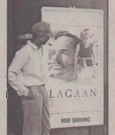
லகான் பட விளம்பரத்தைப் பார்வையிடும் இளைஞன்.

உட்பட்டிருந்தபோது நடக்கின்றது. பிரிட்டிஷ் காலனித்துவ ஆட்சியாளர்களினால் விதிக்கப்பட்டிருந்த நிலவரியை நீக்குவதற்காக கிரிக்கெட்