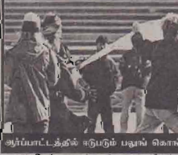
ஆர்ப்பாட்டத்தில் ஈடுபடும் பவுங் கொங் உறுப்பினர்கள்

ரவு தெரிவித்து தியான்மென் சதுக்கத்தில் நேற்று எதிர்ப்பு ஆர்ப்பாட்டம் இடம்பெற்றது. இந்த வாரத்தில் நடக்கும் இத்தகைய இரண்டாவது ஆர்ப்பாட்டம் இதுவாகும். கடந்த