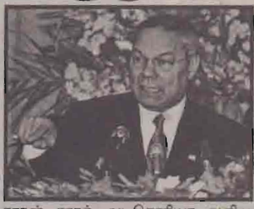
ஈரான், ஈராக், வடகொரியா ஆகிய வற்றை ஜனாதிபதி புஷ் வர்ணித்துள்ளார். இந்த மூன்று நாடுகளில் முதலில் ஈராகை ஒடுக்குவதற்கு அமெரிக்கா திட்டமிட்டுள்ளது.

வாஷிங்டன், பெப். 15 ஈராக் அதிபர் சதாம் ஹுசைனை விரைவில் ஆட்சியில் இருந்து அகற்றுவோம். அதனைச் செய்வதற்கான எத்தனையோ திட்டங்கள் கைவசம் உள்ளன. அதற்கான வாய்ப்புகளும் இருக்கின்றன. இவ்வாறு தெரிவித்துள்ளார் அமெரிக்க வெளிவிவகாரத்துறைச் செயலர் கொலின் பவல். அமெரிக்க செனட்டின் பட் ஜெட் குழுக்கூட்டத்தில் பேசுகையிலேயே அவர் இதனைத் தெரிவித்தார். அங்கு அவர் மேலும் கூறியதாவது:- தீவிரவாதம் மற்றும் தீயசக்திகளுக்கான அடிப்படை நாடுகள் என்று