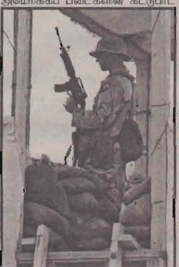
கந்தகார் விமான நிலையத்தில் காவல் கடமையில் இருக்கும் அமெரிக்கச் சிப்பாய்.

யினர் தங்கியுள்ளனர். அமெரிக்காவால் சிறைபிடிக்கப்பட்ட பல அல் கெய்தா மற்றும் தலிபான் கைதிகளும் இந்தத் தளத்திலேயே தடுத்து வைக்கப்பட்டிருக்கின்றார்கள். எனவே இந்தத் தாக்குதல் மிக முக்கியமானதாகக் கருதப்படுகின்றது. கந்தகார் விமானநிலையம் அமெரிக்கப் படையினர் கட்டுப்பாட்டில் உள்ளது.