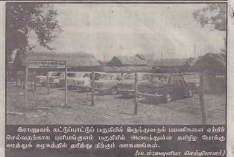
இராணுவக் கட்டுப்பாட்டுப் பகுதியில் இருந்துவரும் பயணிகளை ஏந்திச் செல்வதற்காக புலியங்குளம் பகுதியில் அமைந்துள்ள தமிழ்ப் போக்கு வரத்துக் கழகத்தில் தரித்து நிற்கும் வாகனங்கள்.