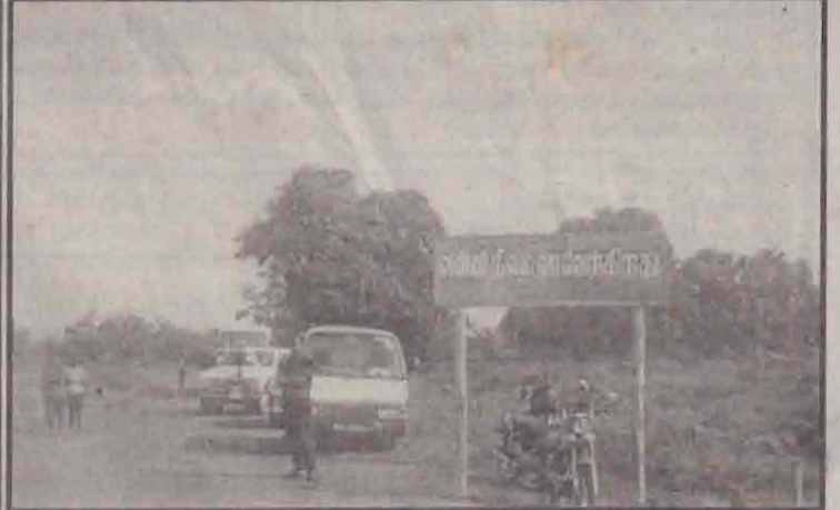
தங்கள் கட்டுப்பாட்டுப் பகுதிக்குள் பயணிகளின் வரவை எதிர்பார்க்கும் காத்திருப்போரானவர்கள்.