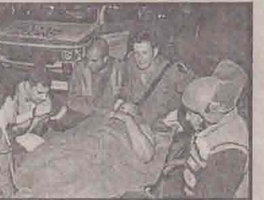
காயமடைந்த இஸ்ரேலியச் சிப்பாய் ஒருவர் மருத்துவமனைக்கு எடுத்துசெல்லப்படுகிறார்.

இஸ்ரேலியப் படையினர் இஸ்லாமிய ஜிகாத் குழு உறுப்பினர் ஒருவரின் வீட்டை வெடி வைத்து தகர்த்துள்ளனர்.