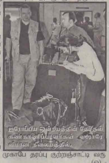
ஐரோப்பிய ஒன்றியத்தின் சீக்கிர கண்காணிப்பாளர்கள் ஐரோப்பிய நாடுகளில் சந்திப்பு.

அதனால் தமது கண்காணிப்பாளர்கள் சிம்பாப்வேயை விட்டு வெளியேறவருவதாகவும் - முன்னதாக ஐரோப்பிய ஒன்றியம் தெரிவித்திருந்தது. வெள்ளையர்களுக்கு எதிரான கரும் போக்கை கடைப்பிடித்துவரும் அதிபர் முகாபேயை பதவியை விட்டு அகற்ற பிரிட்டன் குழ்ச்சி செய்து வருவதாக முகாபே தரப்பு குற்றஞ்சாட்டி வருவது குறிப்பிடத்தக்கது. (ஒ)