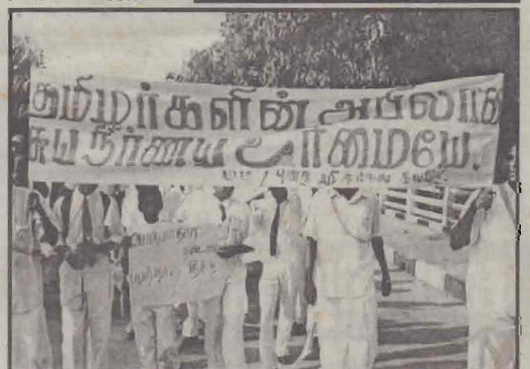
எழுச்சி உள்வலத்தின் போது...