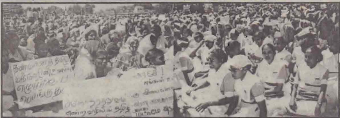
பொங்கு தமிழ் எழுச்சி நிகழ்வுக் கூட்டத்தில் கலந்துகொண்டோரில் ஒரு பகுதியினர்