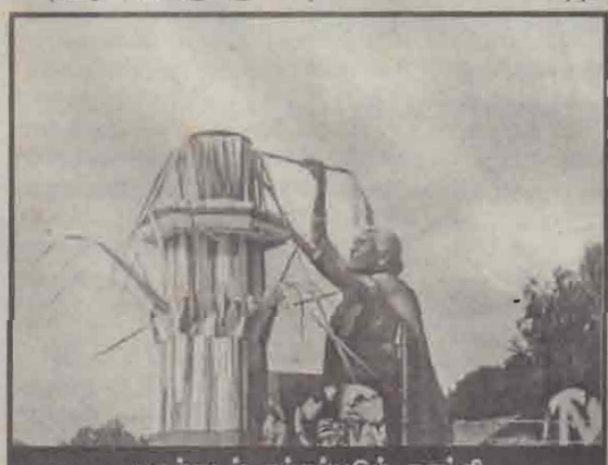
சுக்கடர் ஏற்றுப்படும் காட்சி