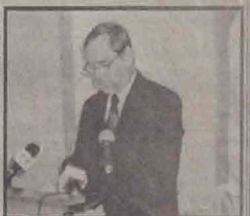
யுத்தநிறுத்தம் அமுலுக்கு வருவது பற்றிய அறிவிப்பை நோர்வே வெளிவிவகார அமைச்சர் ஜான் பிற்றஸன் நேற்று ஓஸ்லோவில் செய்தியிடப்போது எடுக்கப்பட்ட புகைப்படம்.

ஓஸ்லோ, பெப்ரவரி 23 ஸ்ரீலங்கா அரசுக்கும் தமிழீழ விடுதலைப் புலிகளுக்கும் இடையே நிரந்தர யுத்தநிறுத்தத்தை உள்ளடக்கிய புரிந்துணர்வு உடன்படிக்கையை (Memorandum of understanding) இருதரப்புகளும் ஏற்றுக்கொண்டு, அதில் கைச்சாத்திப்படிருப்பதாக நோர்வே அரசு அறிவித்திருக்கிறது. இதன்படி, நிரந்தர யுத்தநிறுத்தம் இன்று நள்ளிரவு முதல் (24 ஆம் திகதி அதிகாலை முதல்) அமுலுக்கு வரவிருப்பதாக நோர்வே வெளிவிவகார அமைச்சர் ஜான் பிற்றஸன் நேற்று ஓஸ்லோவில் விடுத்த உத்தியோகபூர்வ அறிக்கையில் தெரிவிக்கப்பட்டிருக்கிறது. வரலாற்று முக்கியத்துவம்வாய்ந்த இந்த அறிவிப்பு வெளிவருவதற்கான நடவடிக்கைகள் நேற்று வவுனியாவில் வைபவரீதியாக நடந்தன. அரசுத்தரப்பில் பிரதமர் ரணில் விக்கிரமசிங்க கைச்சாத்திட்ட உடன்படிக்கையின் பிரதி நேற்று நோர்வேத் தூதர் ஜோன் வெஸ்பேர்க்கிடம் கையளிக்கப்பட்டது. பிரதமர் விக்கிரமசிங்கவே அதனைத் தூதரிடம் கையளித்தார். தமிழீழ விடுதலைப் புலிகள் இயக்கத் தலைவர் வேலுப்பிள்ளை பிரபாகரன் ஒப்பமிட்ட உடன்படிக்கையின் பிரதி நேற்றுமுன்தினமே தூதர் வெஸ்பேர்க்கிடம் கையளிக்கப்பட்டது தெரிந்ததே. இருதரப்புகளும் ஒப்பமிட்ட உடன்படிக்கையின் பிரதிகள் தமது கைக்குக் கிடைத்ததை அடுத்து தூதர் வெஸ்பேர்க், அது குறித்து நேற்று பிற்பகல் நோர்வே அரசுக்கு தெரியப்படுத்தினார். அதனைத் தொடர்ந்து புரிந்துணர்வு உடன்படிக்கை அமுலுக்கு வருவது தொடர்பான பிரகடனம் ஓஸ்லோவில் இருந்து உத்தியோகபூர்வமாக வெளியிடப்பட்டது. இலங்கை நேரப்படி நேற்றுப் (12 ஆம் பக்கம் பார்க்க)