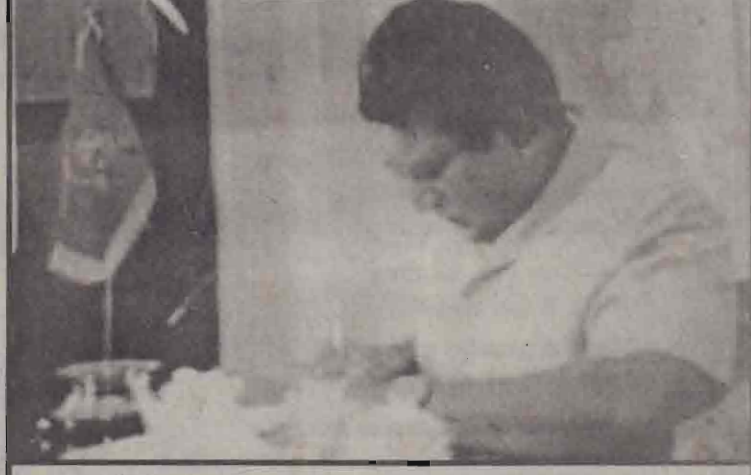
நோர்வே தயாரித்த புரிந்துணர்வு உடன்படிக்கையில் தமிழீழ விடுதலைப் புலிகள் கையளிக்கத்தன் தலைவர் வேலுப்பிள்ளை பிரபாகரன் ஒப்பமிட்டும் காட்சியை நேற்று கிந்தியத் தொலைக்காட்சியான தூரதர்ஷன் உட்பட பல வெளிநாட்டு ஒளிபரப்புச் சேவைகளில் காண்பிக்கப்பட்டது.