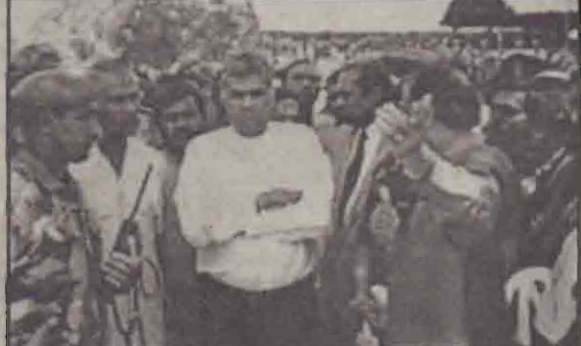
ஓய்வகையில் அமைச்சர்கள் மார்ப்பன, ஜயலக்ஷ்மி ஆகியோருடன் பிரதமர்.