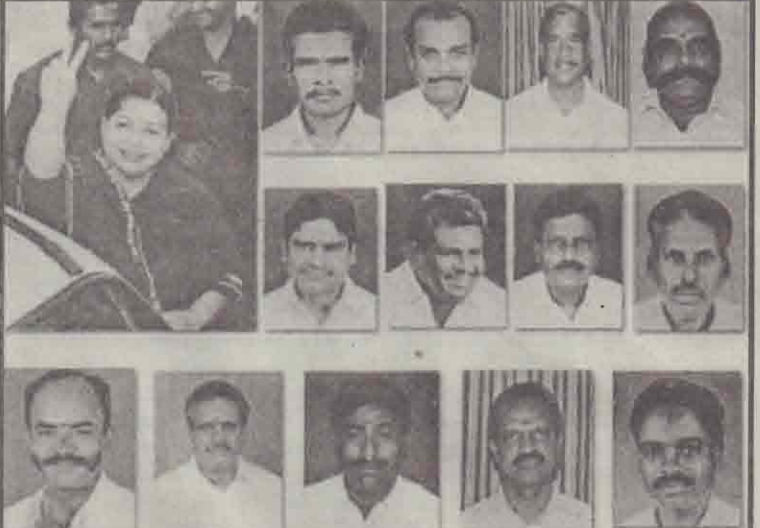
முதல்மைச்சர் ஜெயலலிதாவும், அவருடன் பதவியேற்ற சில அமைச்சர்களும்

இந்தச் சமயத்தில் உள்ளத்து உணர்வுகளை வெளிப்படுத்த வளர்த்துக்கொள்ள இல்லை என்றும் - சொல்லொணாத துன்பங்களைத் தாங்குவதற்கு தனக்கு வலிமை. ஏற்பட தமிழ் மக்களின் ஆதரவே காரணமென்றும் - குறிப்பிட்டார். பதவியேற்பு விழாவில் தி.மு.க. தலைவர் மு.கருணாநிதியின் மகனும், சென்னை மாநகர மேயருமான மு.க.ஸ்டாலின் மற்றும் தி.மு.க. பொதுச்செயலாளரும் சட்டமன்ற எதிர்க்கட்சித் தலைவருமான பேராசிரியர் க.அன்பழகன் ஆகியோர் கலந்துகொண்டமை குறிப்பிடத்தக்கதாகும். (ஏ-6)