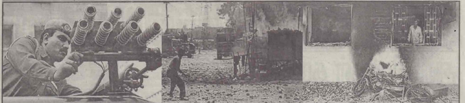
கிந்தியாவின் குஜராத் மாநிலத்தில் கிந்து மதப் பயணிகள் சென்றுகொண்டிருந்த ரயில் தீ வைத்துக்கொளுத்தப்பட்டதையடுத்து கிந்து - முஸ்லிம் மதக் கலவரம் முன்னுள்ளது. அதனையடுத்து அம்மாநில அரசு கலவரத்தைத் தோற்றுவிப்பவர்களைக் கண்ட இடத்தில் கடும் உத்தரவைப் பிறப்பித்துள்ளது. அரசின் கட்டளைக்கிணங்க கலவரக்காரர்களை கட்டுப்படுத்த கிராணுவ வீரர் ஒருவர் கண்ணீர்ப்புகை குப்பாக்கியைத் தயார்ப்படுத்துவதை முதலாவது படத்திலும், கலவரக் கும்பலில் ஒருவரையும் அவர்களின் கோர்ப்பிடிக்குள் அகப்பட்டுச் சேதமடைந்த வாகனங்களை கிரண்டாவது படத்திலும், வீடு ஒன்று தீயில்எரிந்து சீதைந்துள்ளதை வீட்டு உரிமையாளர் சோகத்துடன் பார்க்கக்கொண்டிருப்பதை முன்றாவது படத்திலும் காணலாம்.