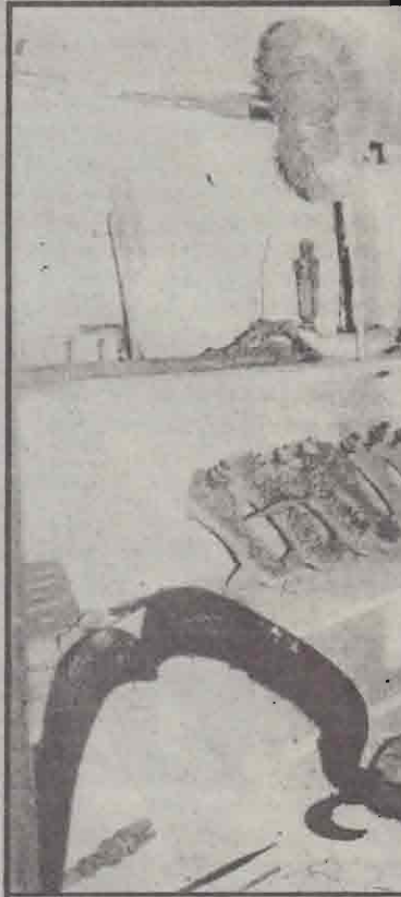
14 ஆம், 15 ஆம் நூற்றாண்டில் மக்கள் பயன்படுத்திய விசிறிகள், கத்திகள், மிதி அடிகள், தந்தப் பொருள்கள் சிலவற்றைப் படத்தில் காணலாம்.

பேர் சென்று பார்வையிட்டுள்ளனர் என்று வினவும் போது கிடைக்கும் பதில் மிகக் கவலையையே அளிக்கிறது.