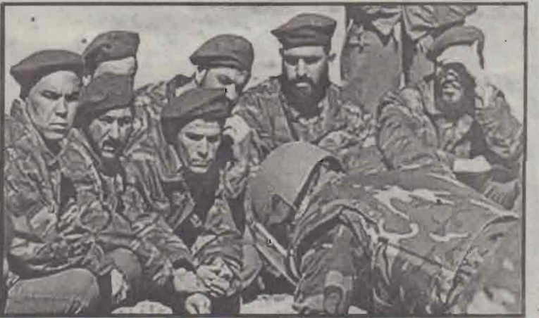
கண்ணீர்வெடி அகற்றும் பயிற்சியை அவதானிக்கும் ஆப்கானின் தானின் புதிய கிராணுவத்தினர்.