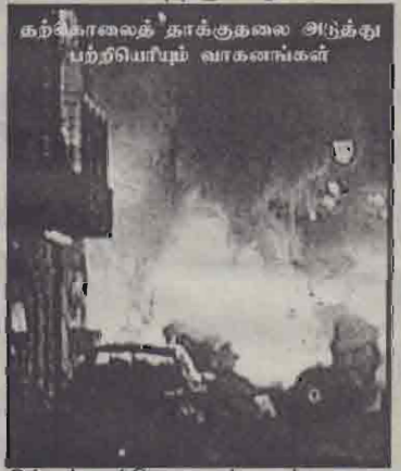
கற்கொலைத் தாக்குதலை அடுத்து பற்றியொழும் வாகனங்கள்

கனில் இஸ்ரேலியப் படையினர் நடத்திய தாக்குதலில் 19 பலஸ்தீனர்கள் கொல்லப்பட்டதற்குப் பழிவாங்கவே