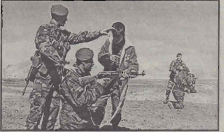
துப்பாக்கிக் கலாசாரத்தில் வளர்ந்த ஆப்கானியருக்கு துப்பாக்கி சுருவதில் பயிற்சி அளிக்கும் அமெரிக்க வீரர்கள்.