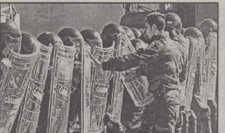
கலகம் அடக்குவதற்கான செயல்முறையை விளக்கும் வீரர்.