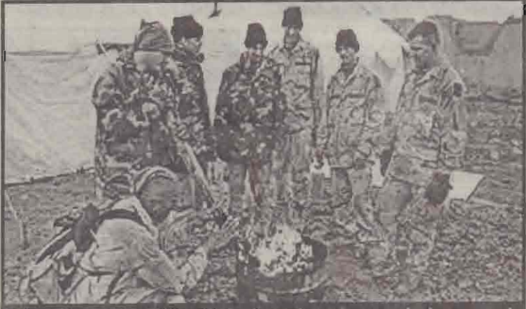
ஆப்கானில் பனிக்குளில் தீ முட்டிக் குளிகளும் அமெரிக்கப் படையினர்

வாஷிங்டன், மார்ச் 11 ஆப்கானிஸ்தானில் தலிபான் மற்றும் அல்கைதா போராளிகள் தங்கியிருப்பதாகக் கூறப்படும் மலைக் குகைகள் மீது தமது இறுதிக்கட்டத் தாக்குதலை மேற்கொள்ளத் தயாராகக் கொண்டிருப்பதாக அமெரிக்க இராணுவத்தினர் தெரிவித்தனர். ஆயினும் எதிர்பார்ப்பதைவிட இந்த இராணுவ நடவடிக்கை அதிக நாள் பெயரிடப்பட்ட படை நடவடிக்கையை 9 நாட்களுக்கு முன்னர் ஆரம்பித்த அமெரிக்கா தலைமையிலான கூட்டுப்படைகள் அப்பிரதேசத்தில் பதங்கியிருந்த போராளிகளின் பதில் தாக்குதலால் தற்போது பின் வாங்கியிருப்பதாகக் கூறப்படுகிறது. இதேசமயம், அப்பகுதியில் மோசமான காலநிலை மற்றும் பனிப்பொழிவு காரணமாக கூட்டுப் படை