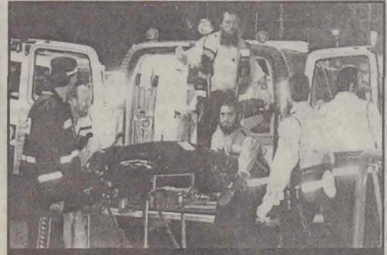
பலஸ்தீனத் தற்கொலைத் தாக்குதலில் சிக்கியோர் மருத்துவமனைக்குக் கொண்டுவரப்படுகிறார்கள்.

பலஸ்தீன அகதி முகாம்களில் பலஸ்தீனத் தீவிரவாதிகளைத் தேடுவதாகக் கூறிக்கொண்டு அப்பாவி பலஸ்தீனர்களைக் கொன்று குவிக்கும் இஸ்ரேலுக்குப் பதிலடியாகவே இந்தத் தாக்குதலைத் தாம் நடத்தியதாக பலஸ்தீனத் தலைவர் யஸீர் அபாத்தின் 'பதாஹ்' குழுவுடன் இணைந்து செயற்படும் அல் அகுஷா படைப்பணி என்ற அமைப்பு அறிவித்த