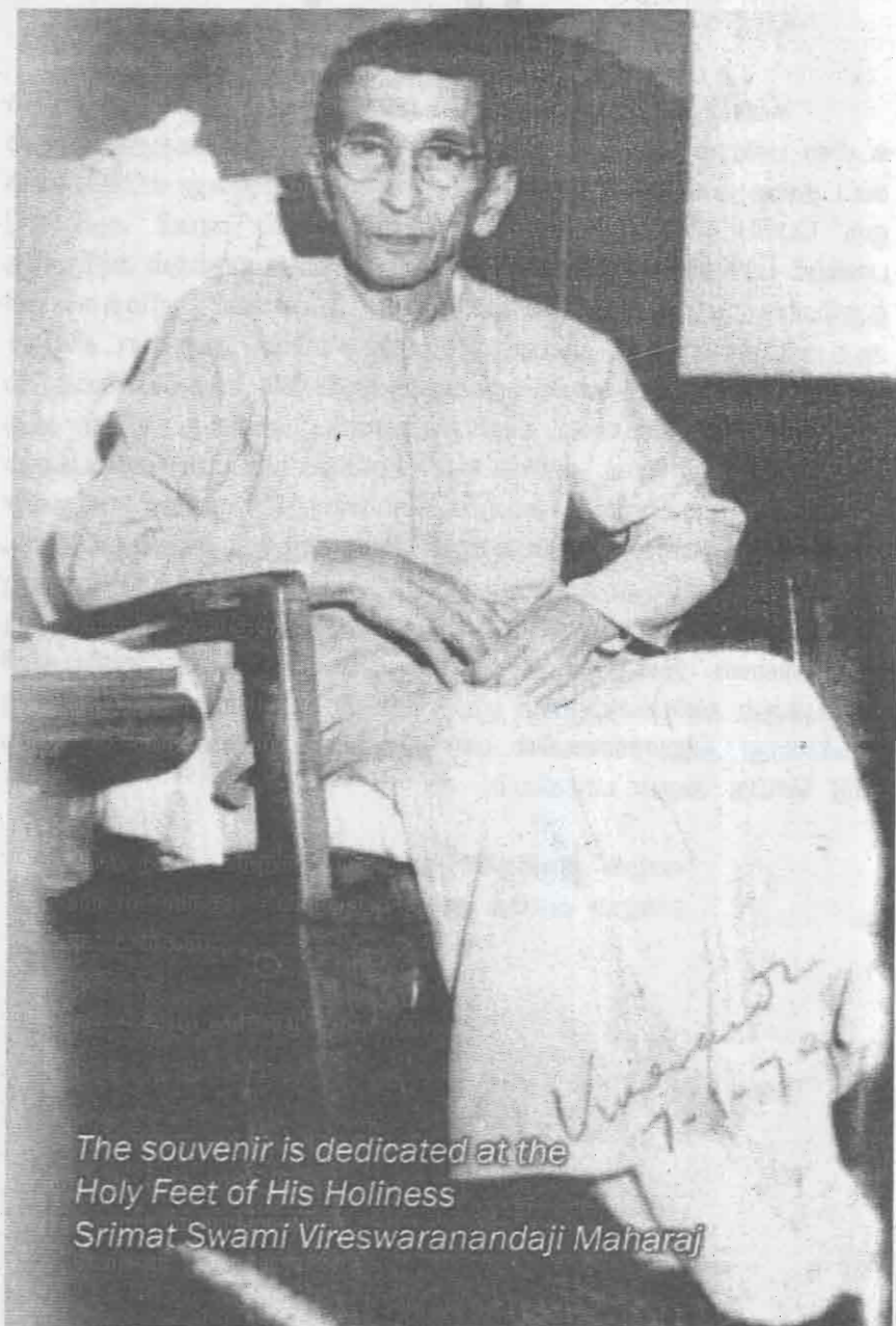
The souvenir is dedicated at the Holy Feet of His Holiness Srimat Swami Vireswaranandaji Maharaj