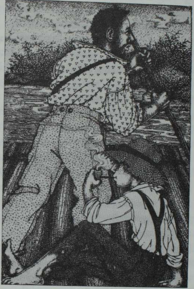
ஹக் & ஜிம்

அமெரிக்கப் புனை கதையியலில் மாபெரும் படைப்புகளுள் ஒன்றான ஹக்ல்பெரி ஃபின்னின் துணிகரச் செயல்கள் மார்க் ட்வைனின் தலை சிறந்த நாவ லாகும். நூலின் இளம் கதா நாயகன் ஹக் ஃபின். உதவாக் கரையான குடி காரத் தந்தை டக்ளஸ்ஸின் விதவையிடமிருந் து தன்னைக் கூட்டிச் சென்ற திலிருந்து தன் துணிகரச் செயல்களை ஹக் விவரிக்கின்றான். தந்தையிடமிருந்து தப்பிச் சென்று ஜிம் என்பவனோடு சேர்ந்து கொள்கின்றான். ஜிம், செல்வி வாட்ஸன் என்ற எஜமானியிடமிருந்து ஓடி வந்த அடிமை. இரு வரும் கட்டு மர மொன்றில் மிசிசிப்பி நதியில் மிதந்து செல்கின்றனர்.