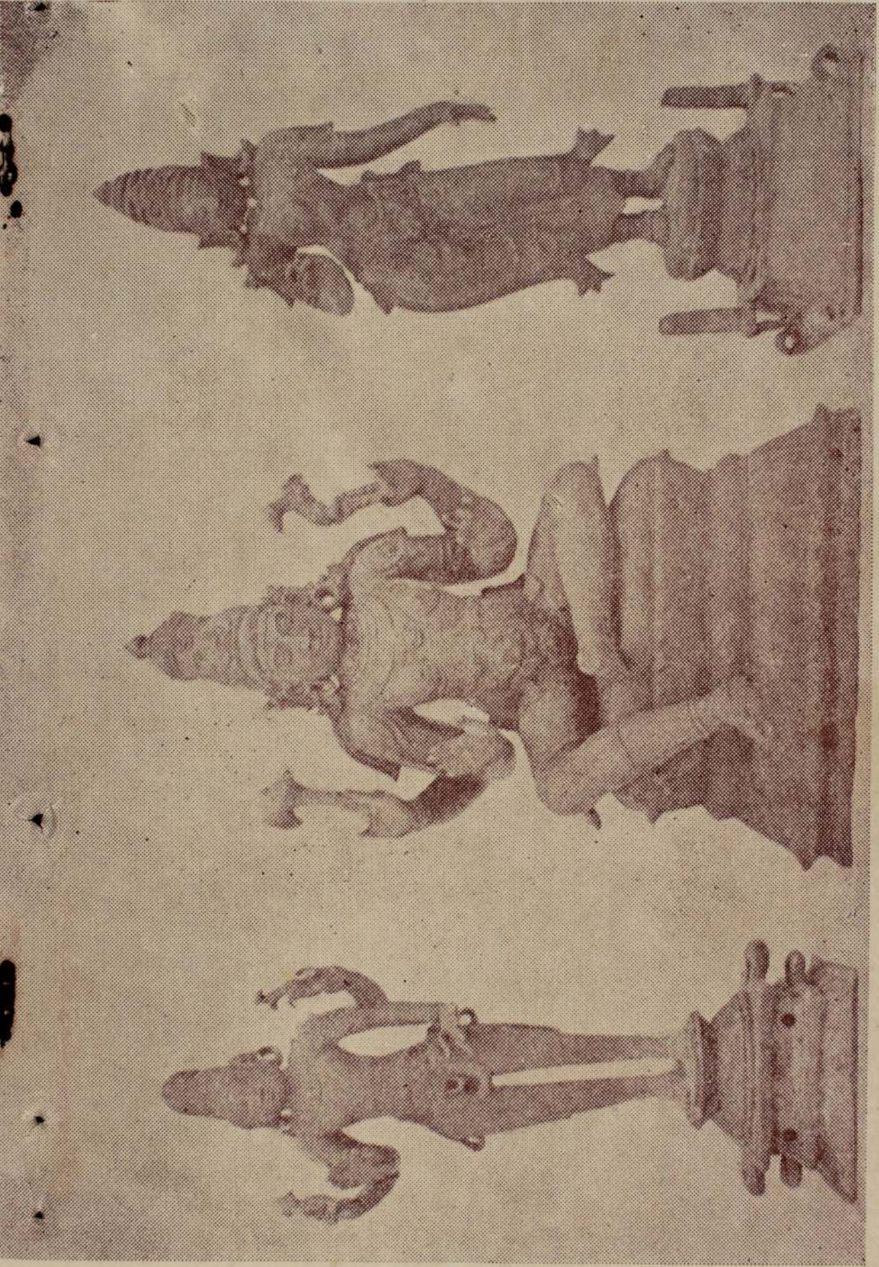
திரிகோணமலையில் சமீபத்தில் கண்டுபிடிக்கப்பட்ட மூன்று விக்கிரகங்களைப் படத்திற்காண்க. (1) சிவன் (சந்திரசேகர மூர்த்தம்) சிவன் (2) (காசன மூர்த்தம்) (3) பார்வதி.