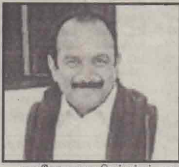
வைகோ கைது செய்யப்பட்டதை எதிர்த்து தமிழகமெங்கும் ம.தி.மு.க விலா போராட்டங்களை மேற்கொண்டு வருகின்றனர். முன்னெச்சரிக்கை நடவடிக்கையாக 3 ஆயிரத்துக்கும் அதிகமான ம.தி.மு.கவின் கைது செய்யப்பட்டமை குறிப்பிடத்தக்கது.

வைகோவின் சட்டத்தரணி கருத்துத் தெரிவிக்கையில் வைகோவை கைது செய்யும் உரிமை தமிழக அரசிற்கு இல்லை. அவர் மீது பிடியாணை பிறப்பிக்கும் உரிமை சிறப்பு நீதிமன்றத்துக்கு மட்டுமே உண்டு. ஆகவே வைகோ கைது செய்யப்பட்டமை சட்டவிரோதமானது" எனத் தெரிவித்துள்ளார். இதற்கிடையில் -