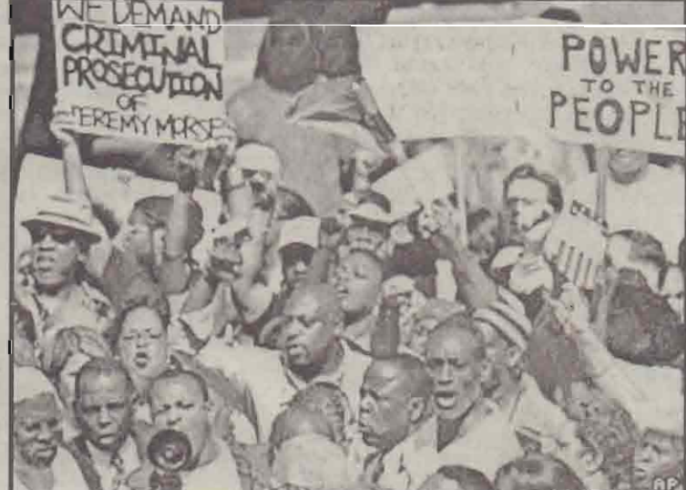
அமெரிக்காவின் கர்ப்பினர் சிறுவன் ஒருவனை கைவிலக்கு பூட்டி கண் முடித்தவனாக தாக்கியதாகக் கூறப்படும் சம்பவத்துடன் தொடர்புடைய வெள்ளையன் பொலீஸ் அதிகாரியைக் கைது செய்து அவர் மீது வழக்குத் தொடர வேண்டும் என்ற கோரிக்கையை முன்வைத்து லொஸ் ஏஞ்சல்ஸ் நகரின் நேற்றுமுன்தினம் கர்ப்பின மக்கள் நடத்திய ஆர்ப்பாட்டத்தின் போது எடுக்கப்பட்ட படம்.

கைது செய்தவர்களின் பெயர் விவரங்களை வெளியிடாமல் இருந்த தற்காகவும், அவர்கள் நடத்தப்பட்ட விதம் குறித்து தகவல் தெரிவிக்காமல் இருந்ததற்காகவும் அரசின் மீது வழக்குத் தொடர்போவதாக அமெரிக்க மனித உரிமைகள் அமைப்பு ஒன்று தெரிவித்துள்ளது.