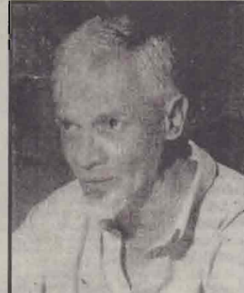
அனுசரணையாகவும் இருக்கக்கூடும். இருப்பினும் வெளிநாட்டு அனுசரணை எத்தகைய அழுத்துக்கள் நிறைந்ததாயினும் நாம் அதை நிராகரிக்க முடியாத நிலையிலேயே உள்ளோம். இதற்குக் காரணம் எந்தவொரு வெளிநாட்டு அனுசரணையும் இன்றிப் பிரச்சினைக்குத் தீர்வுகாண முடியாத நிலைக்கு நாங்கள் தள்ளப்பட்டுள்ளோம். கேள்வி: இவ்வாறான நிலைமையில் எமது நாட்டுத் தேசியப் பிரச்சினைக்கு தீர்வுகாண அனுசரிக்க வேண்டிய முறையைத் தெளிவுபடுத்த முடியுமா? பதில்: அரசுக்கு எதிராக கிளர்ச்சிகளை மேற்கொள்ள சமூகத்தில் ஒரு தரப்பினர் முயலும் நிலை உருவாகியுள்ளது. இதற்குக் காரணம் மாக, தேசியமொழி அல்லது சவாசாரம், ஆகியவற்றில் ஏதாவது ஒரு காரணத்திற்காக அல்லது ஒன்றிணைந்த காரணங்களின் அழுத்தங்களாக இருக்கலாம். இருப்பினும் இவ்வாறு கிளர்ச்சி உருவாக்கக்கூடிய நிலைமையானது அரசு பிரச்சினையை எதிர்பார்த்து வந்தேயே தெளிவாக்குகிறது. இது சமூகத்தால் ஏற்றுக்கொள்ள முடியாத கிளர்ச்சி என்பது உறுதி எனவேதான் அவ்வாறான கிளர்ச்சியின் தலைமையும் வன்முறையாகக் கொண்டதாகும். இவ்வாறான அரசு விமோதக் கிளர்ச்சிகளை ஒடுக்க நடவடிக்கை மேற்கொள்ளும் அரசு நடைமுறைப்படுத்தப்படும் வன்முறைகளையே அனுசரிக்கிறது. தமது அதிகாரத்துக்கு அச்சுறுத்தலாக - தங்களை எதிர்ப்பவர்களை ஒடுக்க கொடிய, மிஸேச்சத்தமையான நடவடிக்கைகளில் ஈடுபடுவதே இதற்குக் காரணமாகும். கிளர்ச்சியைப் பிரயோகிக்கும் போது மேற்கொண்டாலும் அல்லது விஜேவிர மேற்கொண்டாலும் அதன் சமயம் வன்முறையைக் கொண்டதாகவே இருக்கும் இருப்பினும் அரசின் செயற்பாடுகளுக்குக் குறுக்கே இவ்வாறான கிளர்ச்சிகள் உருவாகும் போது அவை ஒடுக்கப்படவேண்டும். இவ்வகையில் அரசு அனுசரிக்கும் கொள்கையைக் கிளர்ச்சியில் ஈடுபடுவோர் ஏற்றுக்கொள்ளும் நிலைமையை உருவாக்க வேண்டும். தமிழ் மக்களின் கிளர்ச்சியை ஒடுக்க மேற்கொள்ளப்பட்ட முயற்சிகள் வரையும் இதுவரை வெற்றியளிக்காததைப் போலவே கிளர்ச்சியில் ஈடுபட்டவர்களுக்கும் வெற்றி கிட்டவில்லை. எனவேதான் தற்போது தேவைப்படுவது அரசு அவர்களை அழைத்து இந்தப் பிரச்சினைக்குத் தீர்வுகாண முயற்சிப்பதாகும். வனவசம் மேற்கொள்ளும் அவர்களையும் நிர்வாகத்தில் பங்களிப்பதற்கு அரசுக்கும் சமூகத்திற்கும் நல்லதாகும். அவர்கள் (விடுதலைப் புலிகள்) நிர்வாகத்தில் பங்களிக்காத ஆண்பின்னர் யுத்தத்தை மேற்கொள்ள வேண்டும் என அவர்கள் மனதில் உள்ள உணர்வுகளிலும், அவர்களை அழிக்க வேண்டும் என அரசுள்ள அறிவுத்திலும் மாற்றங்கள் உருவாகும். ஆயுதக் கலாசாரம் கேள்வி: சமாதான முயற்சிகள் குறித்து அவநம்பிக்கையுடையவர்களும் இருக்கிறார்களே? பதில்: தூரதிஷ்டவசமாக ஒரு சிலர் பிரயோகம் நிர்வாகத்தில் பங்களிப்பதற்கு விருப்பமில்லை. அவர் காட்டில் வாழவேண்டும் என்பதே அவர்களது விருப்பமாகும். பிரயோகம் காட்டில் இருந்து வெளியே வந்து பணிமனை ஒன்றைத் திறந்தவுடன் அங்கே பாருங்கள்! விடுதலைப் புலிகள் பணிமனை திறக்கிறார்கள் என நாங்கள் கூறுகின்றோம். பணிமனை ஒன்றைத் திறப்பது? அல்லது முகாம் ஒன்றைத் திறப்பது நல்ல விடயம். கேள்வி: விடுதலைப் புலிகள் அமைப்பில் உயர்மட்டத்தில் உள்ளவர்கள் சமாதானத்திற்குத் தயாராயில்லை எனக் கூறப்படுகிறதே? பதில்: அரசுக்கு எதிராகச் செயற்பட்ட எந்தவொரு அமைப்பும் ஜனநாயக நிரோடத்தில் சேர்வது எனத் தீர்மானித்த உடனேயே தனது குண இயல்புகளைத் திறனாகக் கைவிடாது. ஜே.வி.பி.யும் அவ்வாறே நடந்துள்ளது. அரசுவிமோதக் கிளர்ச்சியாளர்கள் திடீரென தங்கள் கருதியை மாற்றிக்கொள்வதில்லை. அதற்கு ஓரளவு காலம் எடுக்கும். துப்பாக்கிக்குப் பதிலாக கொடிக்களைத் தாக்கும் நிலை உருவாகும்போது சுருதி மாற்றத்திற்கான அறிவு தெரியவரும். மீண்டும்துப்பாக்கிகளை ஏந்தும் நிலைமை உருவாகாமல் தடுப்பதற்கான முயற்சிகளிலேயே நாம் ஈடுபடவேண்டும். கேள்வி: சமூகப் பிரச்சினைக்குத் தீர்வுகாண முயலும்போது சமூகங்களுக்கு அதற்கேற்ப அறிவு புகட்டப்படவேண்டும் என்பது எவ்வாறு அமையவேண்டும்? பதில்: எழுத்தைப் படிப்பதை மாத்திரம் அறிவு எனக் கூறமுடியாது. எமது கல்வித் தரம் மிகவும் உயர்ந்தது என அறிக்கைகள் தெரிவிக்கின்றன. ஆனால் பரந்த அறிவைப் பெறுவதற்கான அறிவு நவீன உலகில் நாம் கீழ் மட்டத்திலேயே உள்ளோம். எழுத்துப்படிப்பில் எங்களைவிட மிகவும் கீழ்மட்டத்தில் உள்ளவர்கள் கூட பரந்த அறிவைப் பெறுவதற்கான படிப்பில் மிகவும் உயர்ந்த இடத்தில் இருக்கிறார்கள் என்பதை நாம் புரிந்து கொள்ளவில்லை. பல்வேறு சமூகங்களிடையேயான வேறுபாடுகளை மாற்றியுள்ள ஒன்றிணைந்து வாழும் விதத்தை நாம் இன்றும் கற்றுக் கொள்ளவில்லை. நாங்கள் தற்போதையுடன் கூடிய கற்களை உலகில் வாழ்கின்றோம். எம்மிடமுள்ள தற்பெருமை தான் நாம் இன்றுள்ள நிலைமைக்குக் காரணமாகும். தென் ஆபிரிக்காவில் சமாதானத்திட்டத்தைத் தயாரித்தவர்கள் முதலில் மேற்கொண்ட நடவடிக்கை மக்களுக்கு மீண்டும் கல்வியைப் புகட்டியதேயாகும். அக்கல்வி மூலம் வெள்ளை இனத்தவர்களும் கறுப்பு இனத்தவர்களும் எவ்வாறு ஒன்றிணைந்து வாழ்வது உணர்வைப் பெறும்படி செய்து கொடுத்திருப்பது மிகவும் கவனம் செலுத்தப்பட வேண்டும். உயர்நீதிமன்ற நீதியரசர்கள் தொடக்கம் சாதாரண சிப்பாய்கள் வரை அக்கல்வி புகட்டப்பட்டது. அதன்மூலம் அங்குள்ள ஒன்றிணைந்து வாழ்வது தொடர்பான அறிவைப் பெற்றனர். அது அதிகாரத்தால் சமத்தப்பட்ட கல்வி அல்ல. தேவைக்கேற்ப சமுதாயத்தை உருவாக்குவதே இதன் நோக்கமாகும். கேள்வி: எமது சமூகத்தை அந்த அடிப்படையில் உருவாக்குவதில்லாததைக் களை விவரிக்க முடியுமா? பதில்: பல்வேறு நடவடிக்கைகள், முயற்சிகளின் பின்னரே சாதாரண சமூகத்தின் அமைப்பு மானிய முறைச் சமுதாய அமைப்பிற்கு ஜனநாயக முறைச் சமுதாய அமைப்பாக மாறி

நாட்டுப் பிரச்சினைக்குத் தீர்வுகாண முடியாமலின் அது மிகவும் பொருத்தமானதாகும். ஆனால், தூரதிஷ்டவசமாக எமது நாட்டுப் பிரச்சினைக்கு வெளிநாட்டு அனுசரணை இன்றியமையாத ஒன்றாகி விட்டது. எங்களது தலையீடுகள் காரணமாகவே இவ்வாறான நிலைமை உருவானது. கேள்வி: வெளிநாட்டு அனுசரணையில் உள்ள அழுத்தங்கள் பற்றி நீங்கள் என்ன நினைக்கிறீர்கள்? பதில்: வெளிநாட்டு அனுசரணையில் உள்ள அபாயகரமான நிலைமை என்னவெனில், அவர்கள் என்ன நோக்கத்தைக் கொண்டுள்ளார்கள் என்பது ஒரே தடவையில் வெளியே தெரியாமல் இருப்பதாகும். சில வேளைகளில் வெளிநாட்டு அனுசரணை நேர்மையான ஒன்றாக இருக்கவும் கூடும். சிலவேளைகள் எதையோ எதிர்பார்த்து மேற்கொள்ளும்