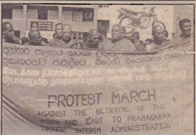
பேரணிக்குத் தயாராகும் பிக்குமார்

உள்ள சோதனைச்சாவடிகளில் பயணிகளை இறக்கிப் பிரிசோதனை செய்யும் முறை புரிந்துணர்வு உடன்படிக்கை ஏற்படுத்தப்பட்ட பின்னர் நிறுத்தப்பட்டிருந்தாலும் சீவகம் செல்லும் பயணிகள் அல்லைப்பிட்டியில் தொடர்ந்தும் பல்வேறு பிரச்சினைகளை எதிர்கொள்ளவேண்டியுள்ளனர். (12ஆம் பக்கம் பார்க்க)