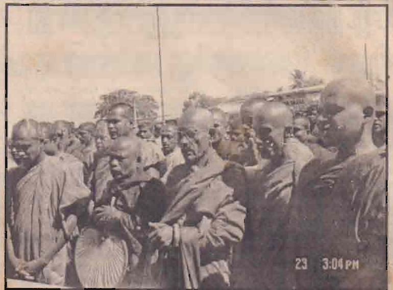
முக்கோட்டையில் நேற்று இடம்பெற்ற பிக்குமாரின் ஆர்ப்பாட்டத்தின்போது எடுக்கப்பட்ட படம்.