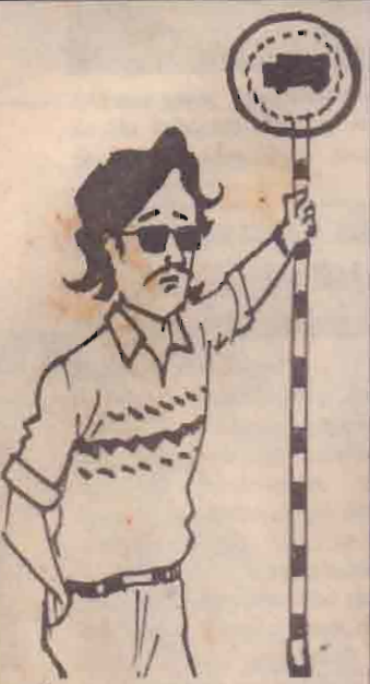
"...சமாதானம் வந்தால் போல ஒருக்கா உறப்பக்கம் எட்டிப் பாப்பம் எண்டு வந்தான..."

தனியார் பஸ் உரிமையாளர் சங்கம் புலிகளுடன் பேச்சு