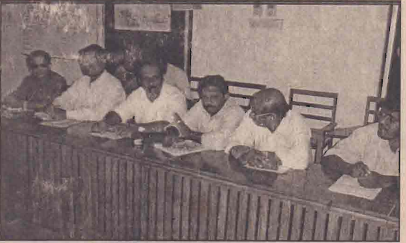
நுகழ்வில் கலந்துகொண்ட அதிகாரிகள்