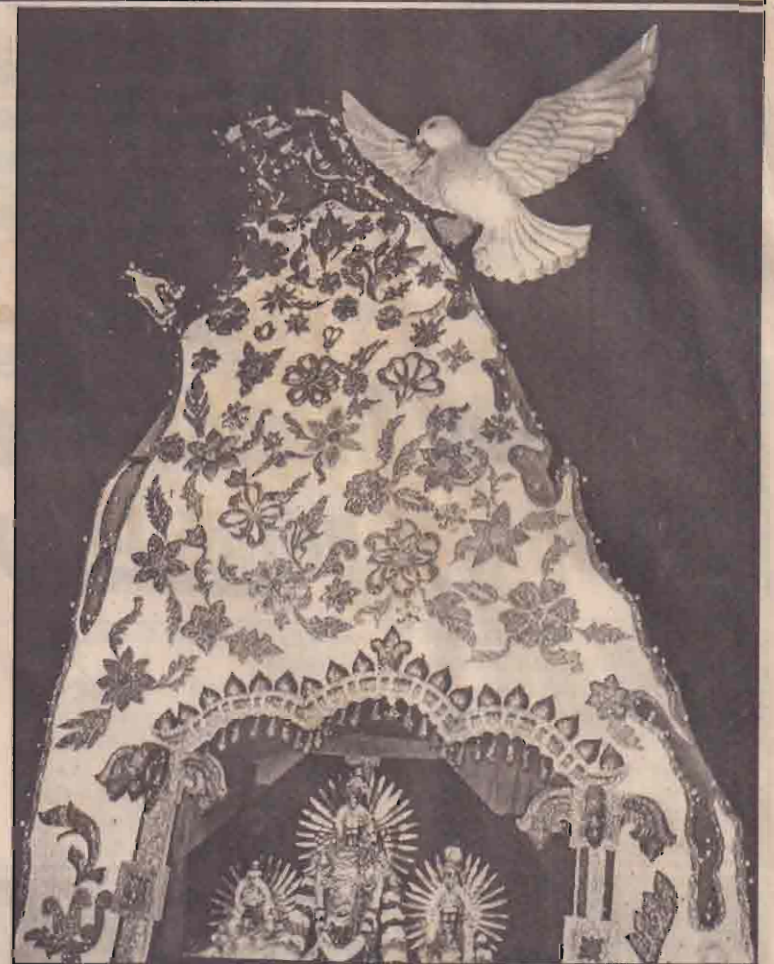
வண்ணை நாச்சியார் ஆலயத்தில் நேற்றிரவு கிடம்பெற்ற பூங்காவானத் திருவிழாவில் சமாதானத்தை வலியுறுத்தும் வகையில் அமைக்கப்பட்ட தண்டிக்கையில் காமாட்சி அம்மன் வலம் வரும் காட்சி.