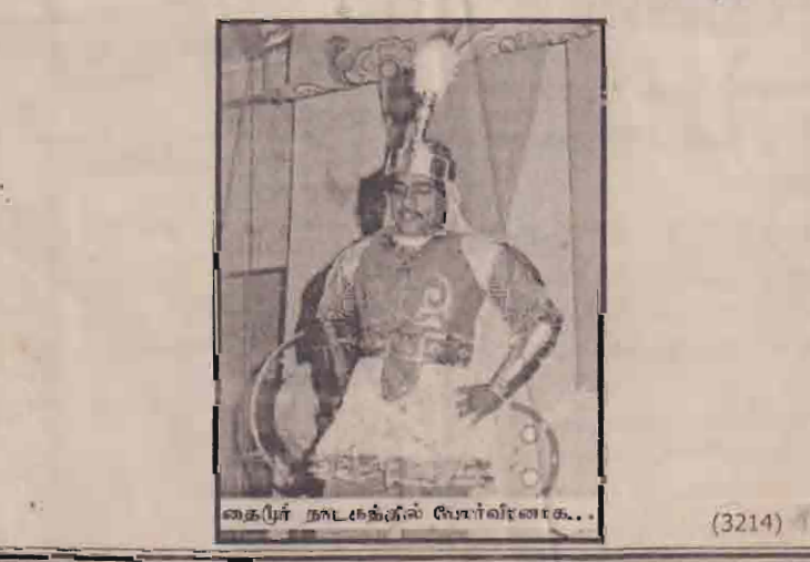
கைபிற் நாடகத்தில் போர்வீரனாக...