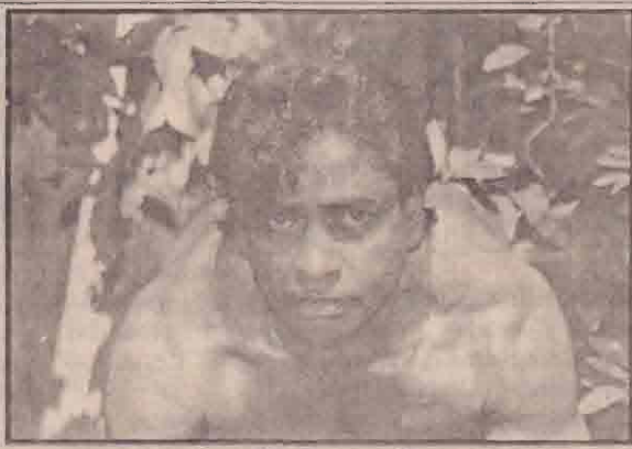
38 வயதில் பொ.மகாதேவா