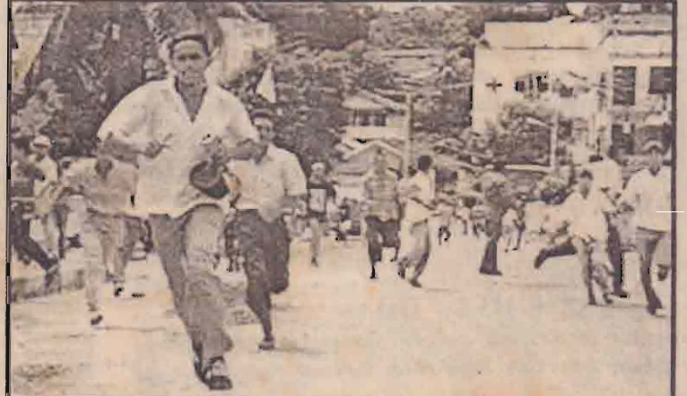
மொலாக்கா தீவில் தலைநகர் அம்பொனில் மத வன்முறை மூண்ட சமயம் தமது உயிர்களைப் பாதுகாப்பதற்காக ஓடிக்கொண்ட பொதுமக்களைப் படத்தில் காணலாம்.

கன் தீவில் கிறிஸ்தவ, முஸ்லிம் தலைவர்கள் இடையே உடன்பாடு ஒன்று எட்டப்பட்ட பின்னர் அங்கு வன்முறைகள் வெடித்திருப்பது இதவே முதல்முறை ஆகும். இந்தோனேஷியாவின் 2கோடி பத்து லட்சம் சனத்தொகையில் 85