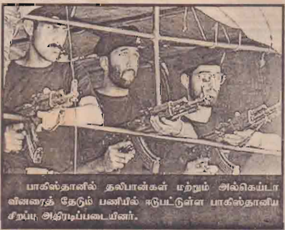
பாகிஸ்தானில் தலிபான்கள் மற்றும் அல்சுயேடாவின்னரத் தேடும் பணியில் ஈடுபட்டுள்ள பாகிஸ்தானிய சிறப்பு அதிபர்ப்படையினர்.

இதேசமயம், பாகிஸ்தானில் அமெரிக்கப் படைகள் இருப்பதை பாகிஸ்தானிய அதிபர் கரீம் அகுனி மறுத்து வருகின்றனர். உள்ளூர் செய்தியாளர்கள் பாகிஸ்தானிய அதிபரின் கிட்டம் இது தொடர்பாகக் கேள்விகளை எழுப்பியபோதும் அவர்கள் எவ்வித தகவல்களையும் வெளியிட மறுத்து விட்டனர்.