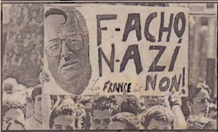
பிரான்ஸின் அதிபர் தேர்தலில் கிரண்டாவது சுற்று வாக்களிப்பில் போட்டியிட தகுதி பெற்ற தீவிர வலதுசாரி வேட்பாளர் ஜீன்மரீ லீ பென்னுக்கு எதிரான ஆர்ப்பாட்டம் ஒன்று.