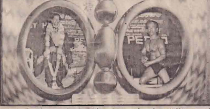
இளமையின் நூல் வெளியீட்டு விழாவில் 2 உடற் காட்சி.