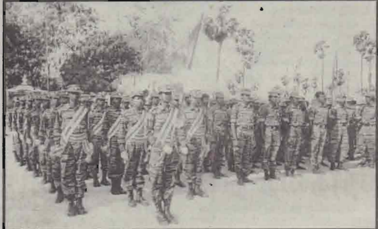
சான்ஸ் அன்ரனி சிறப்புப் படையணியைச் சேர்ந்த போராளிகளின் அணிவகுப்பு.

தமிழீழ விடுதலைப் புலிகள் இயக்கத்தின் முத்த தளபதிகளில் ஒருவரான தளபதி லெப. சீலனின் (சான்ஸ் அன்ரனி) 19ஆவது ஆண்டு நினைவுதினத்தை முன்னிட்டு வன்னியில் நடந்த சிறப்புநிகழ்வுகளின்போது எடுக்கப்பட்ட படங்கள் கிடை.