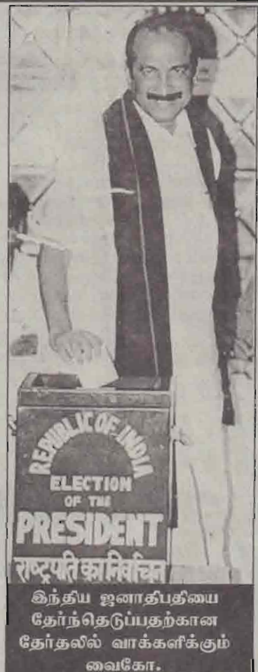
இந்திய ஜனாதிபதியை தேர்ந்தெடுப்பதற்கான தேர்தலில் வாக்களிக்கும் வைகோ.