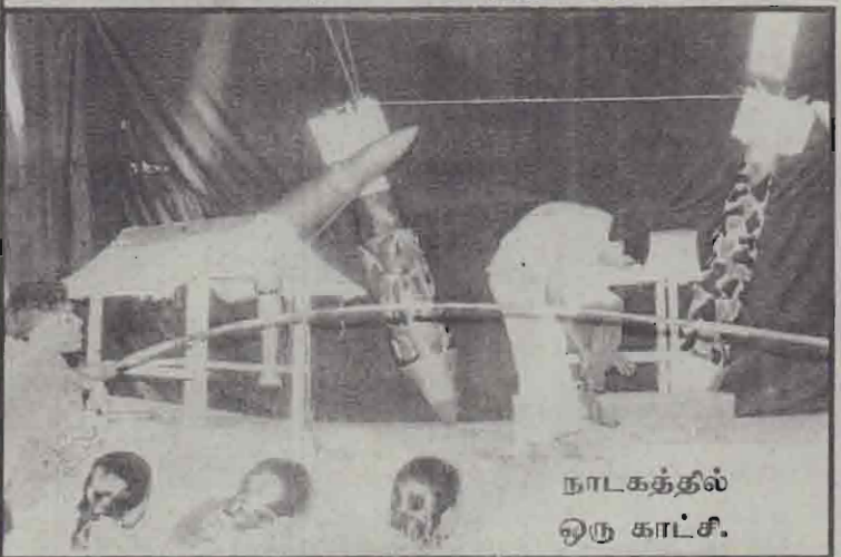
நாடகத்தில் ஒரு காட்சி.

யதார்த்தத்தை அழகுணர்வோடு தெளிவாக மாணவர் மனதில் பதியக் கூடியதாகத் தகுந்த நேரத்தில் தயாரித்து மேடையேற்றுவது இந்நாடகத்தின் வெற்றிக்கு அடிப்படை யென இந்நாடகத்தைப் பார்த்த பல பாடசாலை அதிபர்கள் குறிப்பிட்டுள்ளார்கள். அண்மைக் கால நாடக வரலாற்றில் அதிக தடவை மேடையேற்றப்பட்டதும் அதிக பார்வையாளர்கள் பார்த்ததமான நாடகமாக "நெஞ்சுறுத்தும் கானல்" நாடகத்தைக் குறிப்பிடலாம்.