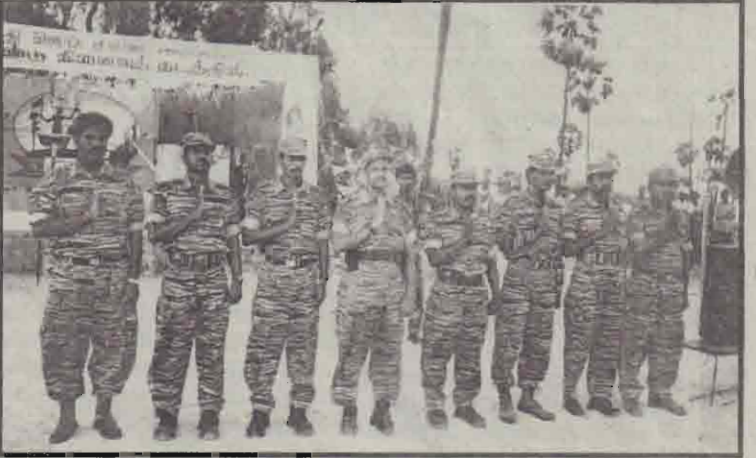
சான்ஸ் அன்ரனி சிறப்புப் படையணியின் சிறப்புத் தளபதி வீரமணிகலைமையில் தளபதிகள் அணிவகுப்பு மரியாதையை ஏற்கிறார்கள்.

தமிழீழ விடுதலைப் புலிகள் இயக்கத்தின் முத்த தளபதிகளில் ஒருவரான தளபதி லெப. சீலனின் (சான்ஸ் அன்ரனி) 19ஆவது ஆண்டு நினைவுதினத்தை முன்னிட்டு வன்னியில் நடந்த சிறப்புநிகழ்வுகளின்போது எடுக்கப்பட்ட படங்கள் கிடை.