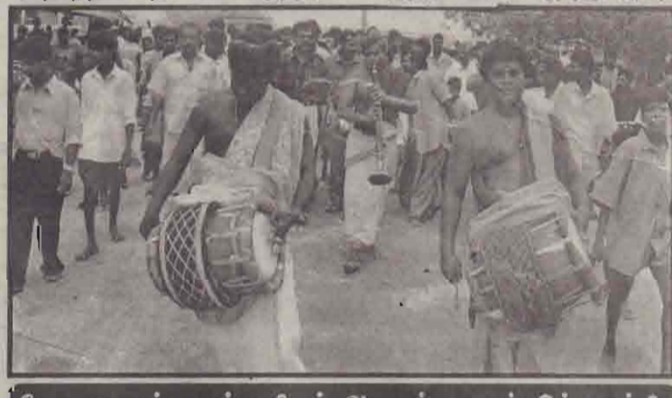
மேள தாளத்துடன் புலிகள் அழைத்து வரப்படும் காட்சி.

கிளிநொச்சி, ஜூலை 18 விடுதலைப் புலிகளின் கடற்புலிகள் படையணி ஆரம்பிக்கப்பட்டு 10ஆவது ஆண்டு நிறைவடைந்ததை யொட்டி ஏற்பாடு செய்யப்பட்ட விசேட நிகழ்வில் விடுதலைப் புலிகளின் தலைவர் வே.பிரபாகரன் கலந்துகொண்டு செங்கம்பள வரவேற்பையும், கடற்புலிகளின் சிறப்புப் படையணியின் அணிவகுப்பையும் ஏற்றுக் கொண்டார். நேற்றுமுன்தினம் மாலை 5.30 மணியளவில் முல்லைத்தீவு திறந்த வெளியரங்கில் அமைக்கப்பட்டிருந்த விசேட மேடையில் நின்று தலைவர் பிரபா இந்தக் கௌரவத்தைப் பெற்றார். விசேடமாக அமைக்கப்பட்டிருந்த பீடத்துக்கு தலைவர் பிரபாகரனை கடற்புலிகளின் தளபதி கேணல் (12 ஆம் பக்கம் பார்க்க)