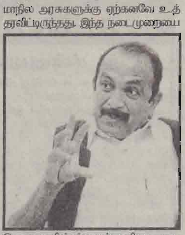
இதுவரை பின்பற்றாமல், தமிழக அரசு வைகோவை கைது செய்துவிட்டது.

சென்னை, ஜூலை 18 'போடா' சட்டத்தின் கீழ் கைது செய்யும் முறை சரியா என்பதை ஆராய வதற்கு உயர்நீதிமன்ற நீதிபதி தலைமையிலான ஆய்வுக்குழு ஒன்றை அமைக்குமாறு தமிழக அரசுக்கு மத்திய உள்துறை அமைச்சு உத்தரவிட்டுள்ளது. இந்த ஆய்வுக்குழு ஏற்கனவே தமிழக அரசால் அமைக்கப்பட்டிருக்க வேண்டும். அதைச் செய்யுமுன் வைகோ கைது செய்யப்பட்டது ஏன் என்றும் மத்திய அரசு வினா எழுப்பியிருக்கிறது. 'போடா'வின் கீழ் கைது செய்ய வர்களை விசாரிக்க தனி நீதிமன்றமும், கைது சரியா, தவறா என்பதை ஆராய தனி ஆய்வுக் குழுவும் அமைக்கப்பட்ட வேண்டும் என்று மத்திய அரசு