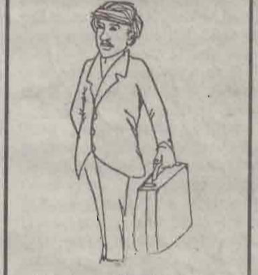
சொல்லுற வேகம் செய்கிறதிலையும் கிருக்கும் என்று சொல்லியனோ...