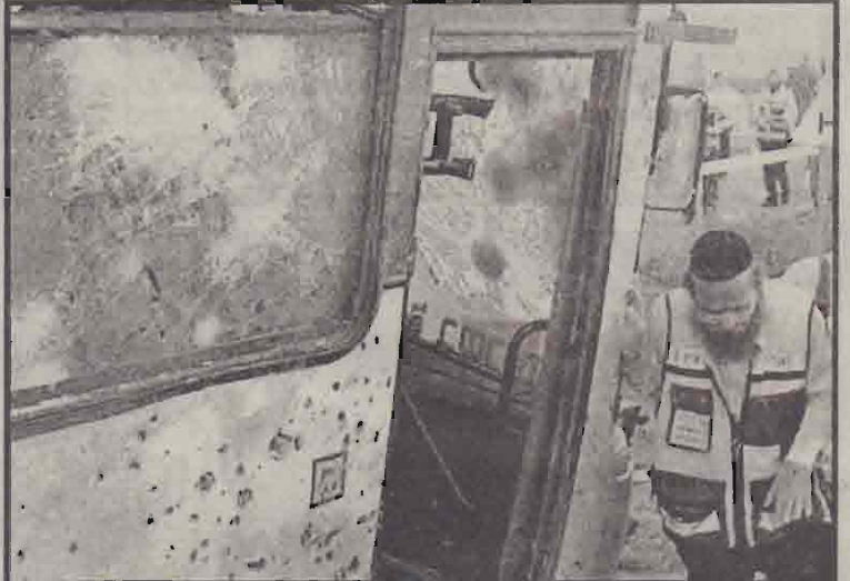
மேற்குக்கரையில் தாக்குதலுக்குள்ளான பலஸை இஸ்ரேலிய அதிகாரி ஒருவர் பார்வையிடுவதை படத்தில் காணலாம்.

யூதக் குடியிருப்பின் அருகே பல திட்டத்தில் குண்டு மறைத்து வைக்கப்பட்டிருந்ததாகவும் - திட்டத்தில் பஸ் ஒன்று வந்து நின்ற சமயத்தில் அப்பகுதியில் மறைந்திருந்த 3 பலஸ்தீனர்கள் குண்டை வெடிக்கச் செய்துவிட்டு ஓடித்தப்பதாகவும் - நேரில் கண்டவர்கள் தெரிவித்தனர். மேற்குக்கரையில் பலஸ்தீன நகரங்களை இஸ்ரேலிய இராணுவத்தினர் ஆக்கிரமித்த பின்னர் இடம்பெற்ற பலஸ்தீனத் தாக்குதல்களில் தற்போதைய குண்டு வெடிப்பு குறிப்பிடத்தக்க சம்பவம் என்று கூறப்படுகிறது. 'இயூனாவல்' யூதக் குடியிருப்புக்கு இஸ்ரேலிய இராணுவத்தினர் பாரிய அளவில் பாதுகாப்பு ஏற்பாடுகளை மேற்கொண்டு இருந்தனர். குண்டு வெடிப்பு இடம்பெற்ற பலஸ்தீனப் படைப்பினர் நிலை கொண்டிருந்தனர். இத்தகைய நிலையில் இந்தக் குண்டு வெடிப்புச் சம்பவம் இடம்பெற்றுள்ளது. இது ஒருபுறமிருக்க, மேற்படி குண்டு வெடிப்புச் சம்பவத்திற்கு காரணமான பலஸ்தீனர்களில் ஒருவரை தாம் சுட்டுக்கொன்று விட்டதாக இஸ்ரேலியப் படையினர் நேற்றுத் தெரிவித்தனர். குண்டு வெடிப்புச் சம்பவம் இடம்பெற்றவுடன் அப்பகுதியை இஸ்ரேலியப் படையினர் சுற்றி வளைத்ததாகவும் - அதனைத் தொடர்ந்து இடம்பெற்ற சோதனை நடவடிக்கைகளின் போது, மறைந்திருந்த பலஸ்தீனத் தீவிரவாதிகளின் துப்பாக்கிச் சண்டை முண்டாகவும் - அந்தச் சமரிலேயே பலஸ்தீனத் தீவிரவாதி ஒருவர் கொல்லப்பட்டதாகவும் - இஸ்ரேலிய வானொலி தெரிவித்தது. (9)