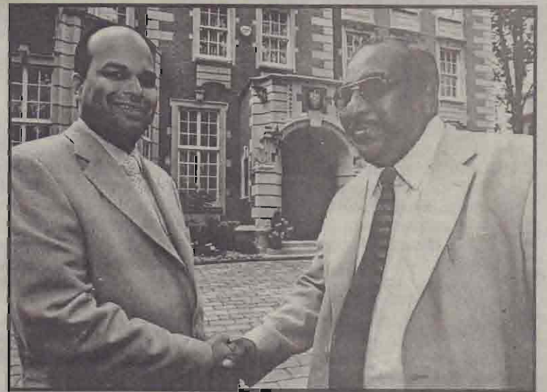
பாலசிங்கத்துக்கு கைலாகு கொடுக்கும் அமைச்சர் மொறகொட.

கடந்த 19ஆம் திகதி அமெரிக்காவுக்கு விஜயம் செய்த பிரதமர் ரணில் விக்கிரமசிங்கவுடன் அங்கு சென்றிருந்த அமைச்சர் மிலிந்த மொறகொட அங்கிருந்து நாடு திரும்பும் வழியில் (14 ஆம் பக்கம் பார்க்க)