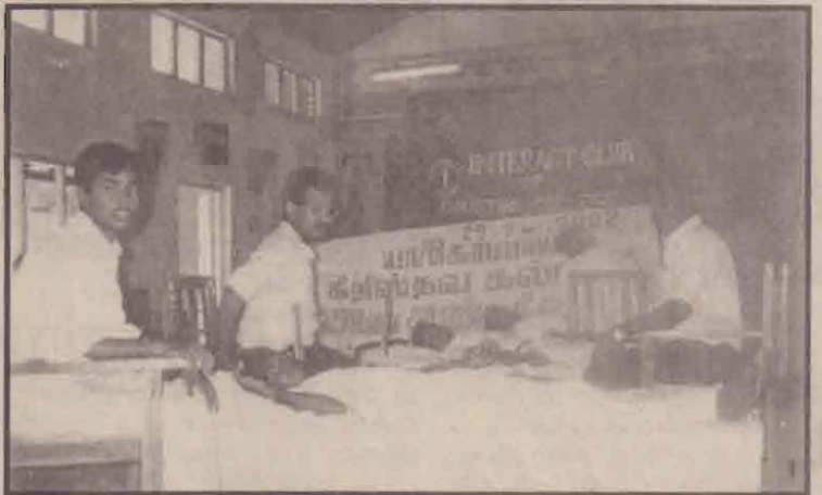
கோப்பாய் கிறிஸ்தவ கல்லூரியின் 150ஆவது ஆண்டு நிறைவை முன்னிட்டு கல்லூரியின் கிளராக்ட் கழகத்தினர் கிரத்ததானம் வழங்கும் நிகழ்வு ஒன்றை அண்மையில் ஏற்பாடு செய்திருந்தனர். அப்போது எடுக்கப்பட்ட படம் கிது.