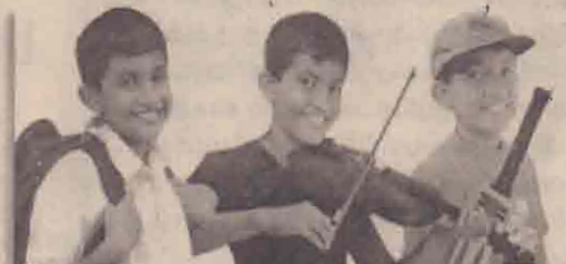
பஜாஜ் - எனது சகவலன்

வீட்டில் ஒவ்வொருவருக்கும் ஒவ்வொரு விதமான பயணங்கள் உண்டு. அந்த போக்கு வரத்திற்காக விளையும் செலவையும், நேரத்தையும், களைப்பையும் குறைப்பதற்கும், அந்த செலவழியும் பணத்தையும் காலத்தையும் சேமித்து அதை எங்களின் குடும்ப முன்னேற்றத்திற்காக பயன்படுத்த எங்களின் பஜாஜ் வண்டியினார்தான் உதவ முடிந்தது.