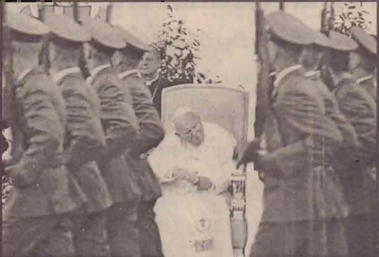
தனது தாய்நாடான போலந்துக்கு பாம்பரசர் கிரெண்டாம் அருளப்பர் சீனப்பர் விஜயம் மேற்கொண்டுள்ளார். அவருக்கு கிராகோவா விமான நிலையத்தில் படை அணிவகுப்பு மரியாதை வழங்கப்பட்டபோது எடுக்கப்பட்ட படம்.

அரசு கௌரவத்தைத் தங்கு அளித்ததற்காக நன்றி தெரிவித்துக் கொண்டார் கோபி அனானு. (ஒ)