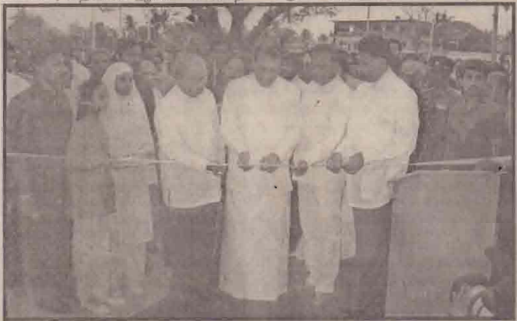
திருகோணமலையில் 'யுகதர்ம' கண்காட்சியின் கிரண்டாம் நாள் நிகழ்வில் பிரதம விருந்தினராகக் கலந்துகொண்ட ஐ.தே.கவின் பிரதிக் தலைவரும், எரிபொருள் மின்சக்தி அமைச்சருமான கரு ஜெயகுரியா அவர்களையும் நிகழ்வை ஆரம்பித்து வைக்கபோது எடுத்த படம். மேற்குப் பிராந்திய அபிவிருத்தி அமைச்சர் முறாமட், கல்வி மனிதவள அபிவிருத்தி அமைச்சர் கருணாசேன கொடிகுதுவக்கு, கைத்தொழில் அமைச்சர் ரோகித போகொல் லாகம ஆகியோரும் படத்தில் உள்ளனர். (ஒ-200)

எனவே, மேற்படி விடயங்கள் தங்களுக்கு கவனத்தில் எடுக்கப்படும் என்று நம்புகின்றேன் - என்றுள்ளது. (ஒ-4)