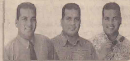
பஜாஜ் - எனது நண்பன்