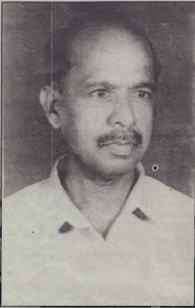
இல.82, செல்லர் வீதி, நல்லூர்.