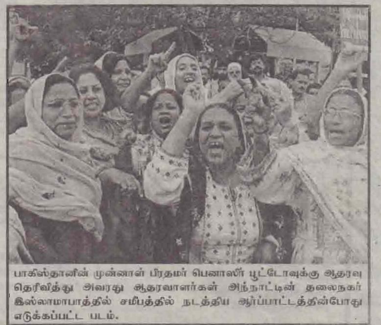
பாகிஸ்தானின் முன்னாள் பிரதமர் பெனாஸிரின் பூட்ரோவுக்கு ஆதரவு தெரிவித்து அவரது ஆதரவாளர்கள் அந்நாட்டின் தலைநகர் இஸ்லாமாபாத்தில் சமீபத்தில் நடத்திய ஆர்ப்பாட்டத்தின்போது எடுக்கப்பட்ட படம்.