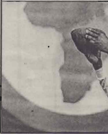
தென்னாபிரிக்காவின் ஜோகன்ஸ்பேர்க் நகரில் நேற்று ஆரம்பமான ஐ.நா. உலக சர்வதேச மாநாட்டின் தொடக்க நிகழ்வில் எடுக்கப்பட்ட படங்கள் இவை.

இதில் கிடம்பெற்ற கலாசார நிகழ்வுகளில் கிரண்டை மேல் படங்களிலும், ஆபிரிக்க பாரம்பரிய மதசம்பிரதாயப்படி மதகுரு ஒருவர் மாநாட்டை ஆசீர்வதிப்பதை கீழுள்ள படத்திலும் காணலாம்.