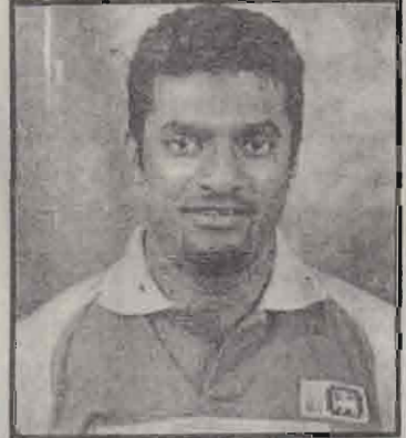
வார் எனத் தெரிவிக்கப்படுகிறது.

ஜனசக்தி அணியில் உலகின் முன்னணி கருவியான வீச்சாளரான முத்தையா முரளிதரனும் இடம்பெறு