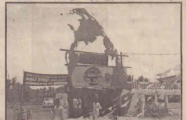
நல்லூர்க் கந்தன் ஆலயத் திருவிழாவை முன்னிட்டு நல்லூர் கிந்துவிடுதலுக்குப் பின்புறமாக விடுதலைப் புலிகளால் அமைக்கப்பட்டுள்ள புகைப்படக் கண்காட்சி அரங்கின் முகப்புத் தோற்றத்தைப் படத்தற்கானலாம்.

அடுத்துவரும் நாள் கு வருடங்களுக்கு இத்திட்டம் தொடர்ச்சியாகச் செயற்படுத்தப்படவிருப்பதாகவும் - இணைப்பாளர் மேலும் தெரிவித்தார். (எ-4)