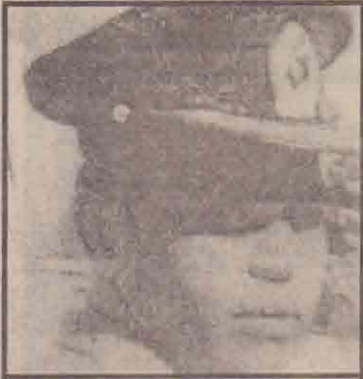
பிரதிப் பொலீஸ்மர் அதிபர் கொட்டகதெனிய

பொலீஸ்மர் அதிபர் லக்கி கொடித்துவக்குவின் மரணத்தை அடுத்து ஏற்பட்டுள்ள பதவிவெற்றிடத்துக்கு