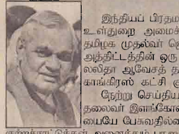
சென்னை, செப். 4