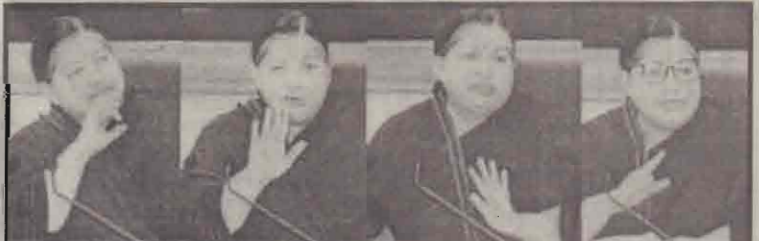
தமிழகத் தலைமைச் செயலகத்தில் செய்தியாளர்களை சந்தித்த முதல்வர் ஜெயலலிதாவின் பல்வேறு முகபாவங்கள்.

அமெரிக்காவில் அதிபர் பதவிக்கு வருபவர் அமெரிக்காவில் பிறந்தவராகவும், 14 ஆண்டுகள் அங்கு வாழ் பவராகவும் இருக்கவேண்டும் என்பது சட்டம். தேசப் பற்றுள்ள நமது நாட்டு மக்கள் வெளிநாட்டவரைப் பிரதமராகவும் வாய்ப்பை அளிக்கமாட்டார்கள் என நம்புகிறேன் என்றார் ஜெயலலிதா. (உ)