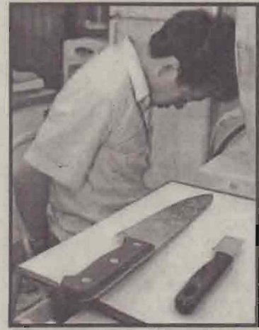
தென்கொரியாவில் சிறுவர்களை வெட்டிய நபர் பொலீஸ் நிலையத்தில் அமர்ந்திருப்பதைப் படத்தில் காணலாம். அவர் பயன்படுத்திய கத்திகளும் அருகில் உள்ளன. சிறுவர்களே அந்த நபரின் வெறித்தாக்குதலுக்கு இலக்கானவர்கள் ஆவர். தாக்குதலுக்குள்ளானவர்களில் முகத்திலும், கழுத்திலும் வெட்டப்பட்ட 3 சிறுவர்கள் ஆபத்தான நிலையில் உள்ளதாக மருத்துவமனை வட்டாரங்கள் தெரிவித்தன.

பாகிஸ்தானிய அரசு 'நடத்தை தெரிமுறைகள்' என்ற பெயரில் பத்திரிகையாளர்களுக்கு சில புதிய கட்டுப்பாடுகளை விதித்துள்ளது. அதன் படி அவதூறாக செய்தி வெளியிடும் பத்திரிகைகளுக்கு ஒரு லட்சம் ரூபா அபராதம் விதிக்கப்படும். இந்தத்தொகையைச் செலுத்தாதவரின்மீது 3 மாதம் சிறைத்தண்டனை அனுப்பிக்கவேண்டும். (உ)