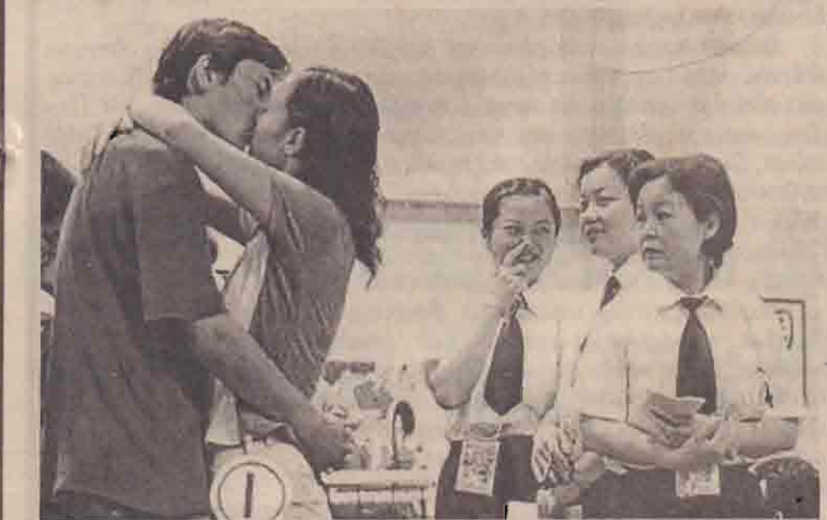
நடுவர்கள் மிக அவதானமாகப் போட்டியை ரசித்துக் கொண்டிருப்பதையும் தான் படத்தில் காண்கிறீர்கள்.

சீச்சீ... என்ன இது விவஸ்தையே இல்லாமல் என்று நீங்கள் இந்தப் படத்தைப் பார்த்து எண்ணக்கூடாது. இது போட்டி அவ்வளவுதான்! கொஞ்சம் சுவாஸியமானது. அதாவது மிக நீண்ட நேரம் தொடர்சியாக முத்தமிடும் போட்டியொன்று அண்மையில் சீனாவில் இடம்பெற்றது.