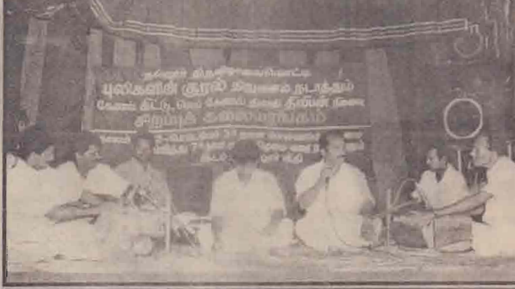
புலிகளின் குரல் நிறுவனம் நடத்தும் இசை கட்டு, வல் கேணல் திலீபன் தளபதி சிறப்புக் கலையரங்கம்