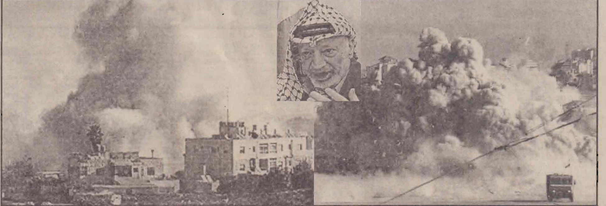
யஸீர் அரபாத் தலைமையக வளாகத்திலுள்ள கட்டடங்களை இஸ்ரேலிய இராணுவம் விடிகுண்டுகளை வைத்துத் தகர்த்ததை அடுத்து அங்கிருந்து புகைமண்டலம் பல அடி உயரத்துக்கு மேலெழுவதையும் அந்தப் புகைமண்டலத்தைத் தாண்டி இஸ்ரேலிய இராணுவ வாகனம் ஒன்று நகர்வதையும் படங்களில் காணலாம்.

தடமான தீவிரவாதத்துக்கு எதிராக இஸ்ரேல் நிண்டகாலம் கடுமையாகப் போராடி வருகின்றது" - என்று தெரிவிக்கப்பட்டுள்ளது. காலா முற்றுகை பலஸ்தீன அதிகார சபைக்குட்பட்ட காலா பிரதேசமும் முற்றுகைக்கு உள்ளாகியுள்ளது. இஸ்ரேலிய இராணுவத்தின் இரு பிரிவுகள் இதில் ஈடுபட்டுள்ளன. ஒரு பிரிவு காலாவின் எல்லைவரை முன்னேறி முற்றுகையிட, மற்றொரு பிரிவு நகரங்களான பிடி லாஹியா மற்றும் பிடி ஹதன் நகரங்களைச் சுற்றிவளைத்துள்ளது. முற்றுகையில் ஈடுபட்டுள்ள இஸ்ரேலியப்படைகள் மற்றும் ஹெலிகாப்டர்கள் தாக்குதலை நடத்துவதாக நேரில் கண்டவர்கள் கூறினர். இதில் சிக்கி இரு பலஸ்தீனர்கள் (ஒர் ஆண், ஒரு பெண்) உயிரிழந்தனர். காலா பகுதியில் உள்ள இரும்புத் தொழிற்சாலைகளை இஸ்ரேலிய இராணுவம் இடித்து வருவதாகவும் அங்குள்ளவர்கள் கூறுகின்றனர். தலைமையக வளாகத்திலிருந்த சிலர் ஏற்கனவே இஸ்ரேலிய இராணுவத்தினரால் கைதுசெய்யப்பட்டுள்ளதாக பிந்திக் கிடைத்த செய்திகள் தெரிவிக்கின்றன. (ம)