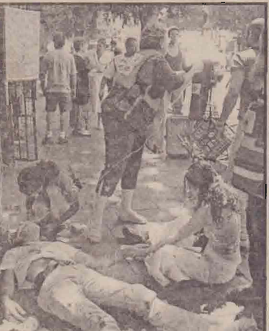
டெல் அலிவில் தற்கொலைத் தாக்குதலில் காயமடைந்த இஸ்ரேலியர்களுக்கு வித்யோரத்தில் வைத்தே அவசர சிகிச்சைகள் வழங்கப்படுகின்றன.

இஸ்ரேலிய பாங்கிகளில் இருந்து நடத்தப்பட்ட துப்பாக்கிச் சூட்டில் இரு பலஸ்தீன பாதுகாப்பாளர்கள் அழம்பத்தில் காயமடைந்தனர். நேற்று முன்தாது, இஸ்ரேலியப் படையினர் குறிப்பாக துச் சுட்டில் பலஸ்தீன தலைமையக வளாகத்துக்குள் இருந்த பொலீஸ் ஓஹர் உயிரிழந்ததாக பலஸ்தீன அதிகாரிகள் தெரிவித்தனர். இஸ்ரேலியப் படைகளின் கடும் முற்றுகைக்கு உள்ளாகி இருக்கும் தலைமையக வளாகத்தின் உள்ளே யஸீர் அரபாத் சிக்கிக்கொண்டுள்ளார். தலைமையக வளாகத்துக்குள் பதுங்கியிருக்கும் முக்கிய சந்தேகநபர்களை ஒப்படைக்கும்வரை வளாகத்தை விட்டு வெளியேறாமல் இருப்பதை இஸ்ரேலிய இராணுவம் தெரிவித்துள்ளது. தற்கொலைத் தாக்குதல் முன்னதாக, இஸ்ரேலிய நகரான டெல்அலிவில் பலஸ்தீன தற்கொலையாளி தாக்குதல் நடத்தினார். நகரப் பகுதிகளில் பஸ் ஒன்றின் மீது இந்தத் தாக்குதல் நடத்தப்பட்டது.