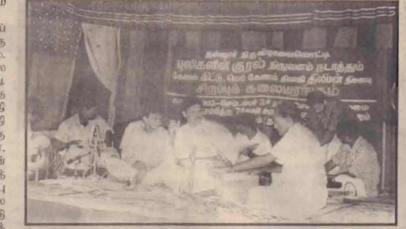
புலிகளின் குரல் நிறுவனம் நடத்தும் இசை கட்டு, வல் கேணல் திலீபன் தளபதி சிறப்புக் கலையரங்கம்

கம் ஒளிர்ந்தது. வேங்குமலர் வேந்தன் வசந்தனின் வேணுகாண இசை எமையெல்லாம் சிலிரிக்க வைத்தது. பின்னணிக் கலைஞர்கள் அற்புதம் செய்தனர். தொடர்ந்து வந்தது முல்லைச் சகோதரிகளின் பாடல் அன்றைய குரல் அப்படியே இருந்தது அதிசயந்தான். நிகழ்வுகள் நிறைவுறு அடுத்த நாள் நிகழ்வுக்காய்க் காத்திருந்தோம். மாலை 6.30 - நிகழ்வு அரங்கம் ஒளிர்வில்லை ஏனோ என் மனம் பட்டபட்டது. அம்! கந்தனின் விதிபுலா அன்று தாமதமானது. 7.00 மணி அரங்கம் ஒளிர்ந்தது. 6.30 ஏராய் ஆனதற்கு மன்னிப்பு என்றார் அரங்கில் நின்றுவர். தொடர்ந்து நிகழ்வு புலிகளின் குரலின் புதுமைக் கவிஞர் பொன் காந்தனின் அருக்கு வரிகள் தலைமையை நிறைத்தது. அறு அம்நாற்றிருந்து ஆயிரம் மனைத்திருந்து நடைவா பேசினார். தலைப்பு இது தான், தரமாய் இருந்தது. தமிழ் சிலருக்கு சாடல் அதிகமென்று சரிதான்! நடந்ததைத்தானே தந்தனர் அவர்கள். தொடர்ந்தது சங்கநாதம், புதுமைகள் செய்திடும் பேயி ஆசிரியை எனக் கேள்விப்பட்டிருந்தோம் அன்று தான் கண்டோம் அவரின் நெறியாள்கை. விடுதலைப் பாடல்களுக்கு வீச்சும் தந்தனர் விடுதலைக் கவிஞர்கள் நன்று. அன்றைய நிகழ்வு அத்தான் நிறைவுறு இறுதி நாள் நிகழ்வுகள் ஒளிர். முன் இசை ஒலிக்கவே பார்ப்பவர் மண்களில் பரவசம் எழுந்தது. இன்றும் எம் காத்தில் அது ஒலிக்கிறது. பொய்யல்ல நிறும் தான். புலிகளின் தாகம் பாடல் ஒலித்திட மகிழ்ச்சி பொங்கி எழுந்ததை மக்கள் மண்களில் கண்டோம். எம் கண்களில் கண்ணீர் கசிந்தது. ஐந்து நாள் நிகழ்வுகள் அருமை யாய் அமைத்திட ஒளி ஒளி அற்புதம். அனைவரின் சார்பிலே அவர்களுக்கெம் நன்றிகள். விடுதலைக் காற்றினை நல்லூரான் வீதியில் வீசிடச் செய்திட்ட