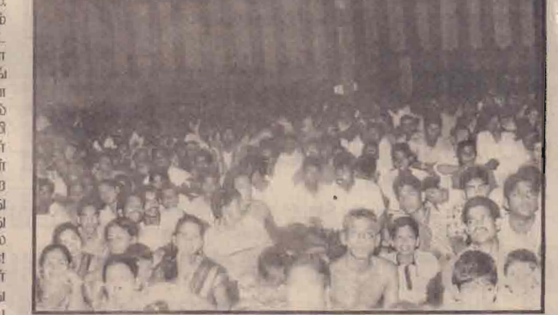
புலிகளின் குரல் நிறுவனம் நடத்தும் இசை கட்டு, வல் கேணல் திலீபன் தளபதி சிறப்புக் கலையரங்கம்

கள் இசைப்பிரியன், செயல்வீரன் இசை நெறியாள்கையில் விடுதலைக் கீதங்கள் வீச்சாய் உரைத்தன. தமிழ்நாடும் பாடகர் அருங்கு வந்தனர். விடுதலைக் குரல்களை எம் முன்னே வீசியே ஏறிந்தனர். வர்ண விளக்கு