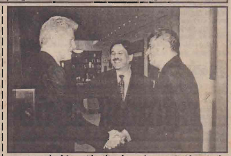
ஐ.நா. கூட்டத்தொடரில் பங்குபற்றுவதற்காக அமெரிக்கா சென்ற ரணில் விக்கிரமசிங்க அங்கு அமெரிக்க முன்னாள் அதிபர் பில் கிளின்டனை சந்தித்தபோது எடுக்கப்பட்ட படம்.