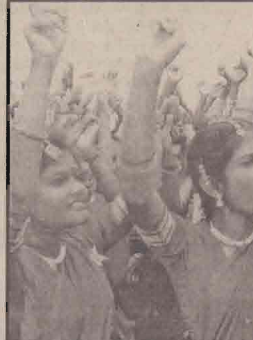
இதே நிலையில் ஒரு ஆண் இருந்தால் வேறு ஒரு பெண்ணை நல்ல சீதனம் வாங்கி திருமணம் செய்வார்கள். இதனை சமுதாயம் கண்டு கொள்ளவேண்டியது.

துன்பங்களுக்கும், அவமானங்களுக்கும் பல தடவைகள் முகம் கொடுக்க வேண்டியுள்ளது. படிக்கும் வயதில் ஒரு ஆண்கள் பின்னால் வந்தாலோ, காதல் வசப்பட்டு அந்தக் காதல் கைகூடாமல்போனாலோ சமுதாயம் அந்தப் பெண்ணை வேறு கண்ணோட்டத்தில் தான் பார்க்கும்; வீண்படி சுமத்தும். திருமண வாழ்க்கைகூட எட்டாத கனியாகப் போய்விடும். ஆனால்,