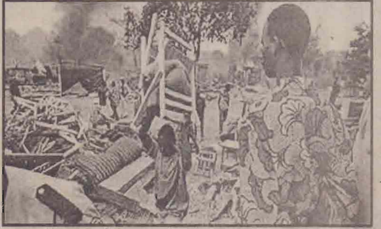
ஐவர்கோஸ்ட்டில் கிராணுவப் புரட்சி முறியடிக்கப்பட்டதை அடுத்து எதிர்க்கட்சி ஆதரவாளர் ஒருவரது வீடு தாக்குதலுக்கு உள்ளாகியிருப்பதைப் படத்தில் காணலாம்.