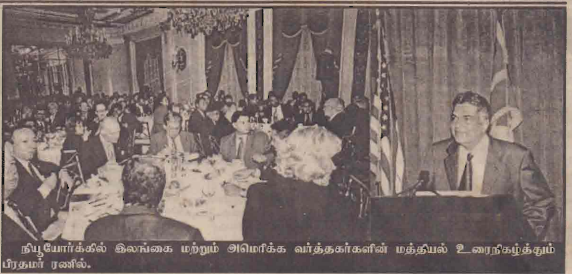
நியூயோர்க்கில் இலங்கை மற்றும் அமெரிக்க வர்த்தகர்களின் மத்தியல் உரைநிகழ்த்தும் பிரதமர் ரணில்.

தாய்லாந்தில் இடம்பெற்ற பேச்சுக்களில் முன்னேற்றம் குறித்து உத்தியோகபூர்வமாக ஜனாதிபதி அறிய முடியவில்லை. ஊடகங்களில் வெளியான செய்திகளின் அடிப்படையிலேயே அவர் அதனை தெரிந்து கொள்ள முடிந்தது. எனவே உடனடியாக பேச்சுக்குறித்த விவரத்தை ஜனாதிபதிக்கு அனுப்ப வேண்டும் என்றும் அவர் கேட்டுள்ளார்.