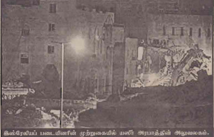
இஸ்ரேலியப் படையினரின் முற்றுகையில் யஸீர் அரபாத்தின் அலுவலகம்.