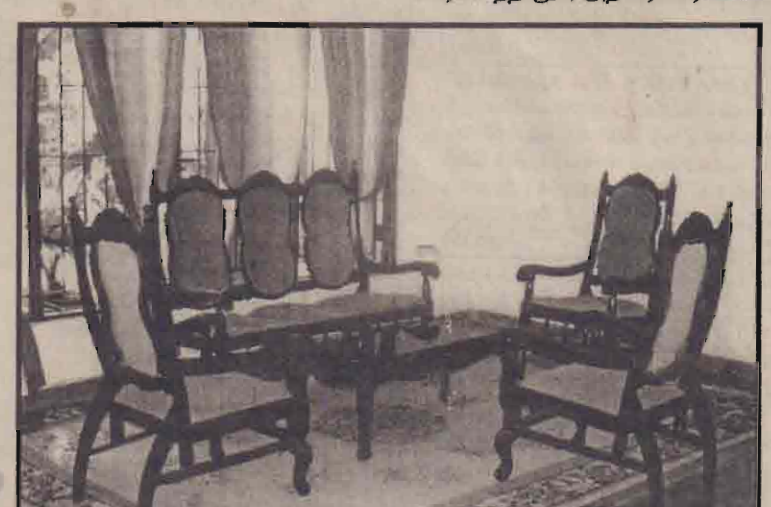
பழையகால வடிவமைப்பில் அமைந்துள்ள கற்காலத் தளபாடங்கள்

பட்டிக்காட்டுத் தளமானவை, நவீன மற்றவை, சுமையாக இருப்பவை, இன்றைய தேவைக்கும் நாகரிகத்திற்கும் ஏற்பற்றவை என்று கோடியில்போட்ட பொருள்களை நாற்றுக்கு நூறுவீதம் ஒத்தபொருள்கள் தென்பகுதி மத்தியதர வர்க்க வீடுகளை நிறைத்து வருகின்றன. இது தான் இன்று அங்குள்ள பாஷன் (Fashion). இதைக் காலனித்துவ பாணி (Colonial Style) என்கிறார்கள். இது ஒரு பக்கமிருக்க பெருநகரங்