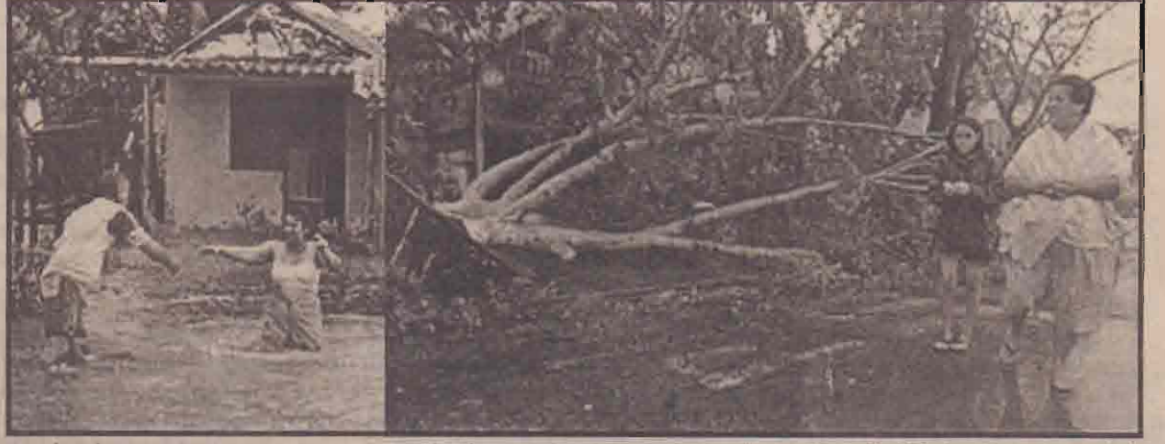
மெக்ஸிக்கோவின் தென்கிழக்குப் பகுதியில் வீசிய புயல் மழையால் குறைந்தது 3பேர் உயிரிழந்துள்ளனர். ஆயிரக்கணக்கானவர்கள் கிரும்பிடங்களை கிழந்துள்ளனர். புயல் மழையால் பாதிக்கப்பட்ட கிடங்குகள் எடுக்கப்பட்ட சிறுபடங்கள் இவை.