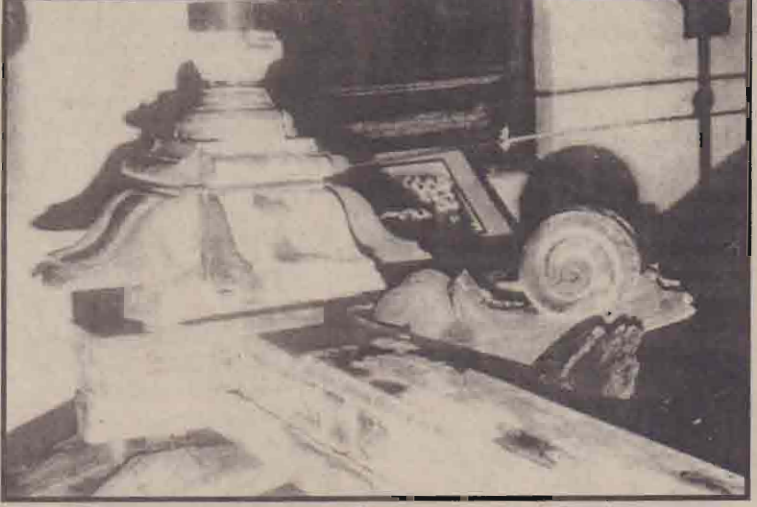
பழைய வீடொன்றின் தூண்போதிகை

இவ்வாறு போரில் எஞ்சிய எமது மூதாதையரின் கடைசிச் சுவடுகளை இன்று தென்பகுதி தரகர்களுக்கும் சுரண்டல் பேர்வழிகளுக்கும் விற்பனையாக நான்கள் ஆட்டுமந்தைகளாக நடத்தப்படுவோம். ஆயுதப் போராட்டத்தாலும், அதிகாரப் பரவலாக