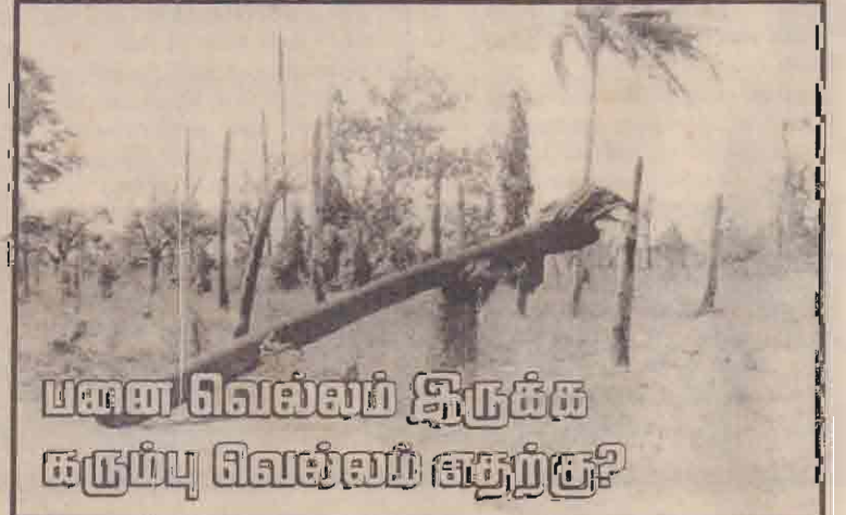
பெண வெல்லம் இருக்க கரும்பு வெல்லம் இருக்க?