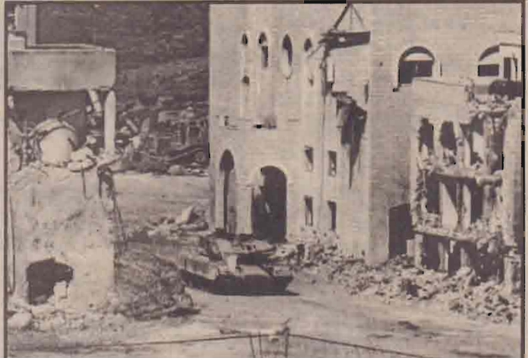
இஸ்ரேலிய இராணுவ முற்றுகைக்குள்ளாகியுள்ள அரபாத்தின் அலுவலகம்.

இது ஒருபுறமிருக்க, அரபாத்துக்கு ஆதரவாக பலஸ்தீனர்கள் தொடர்ந்தும் ஆர்ப்பாட்டங்கள் மற்றும் பேரணிகளை நடத்தி வருகின்றனர். (9)