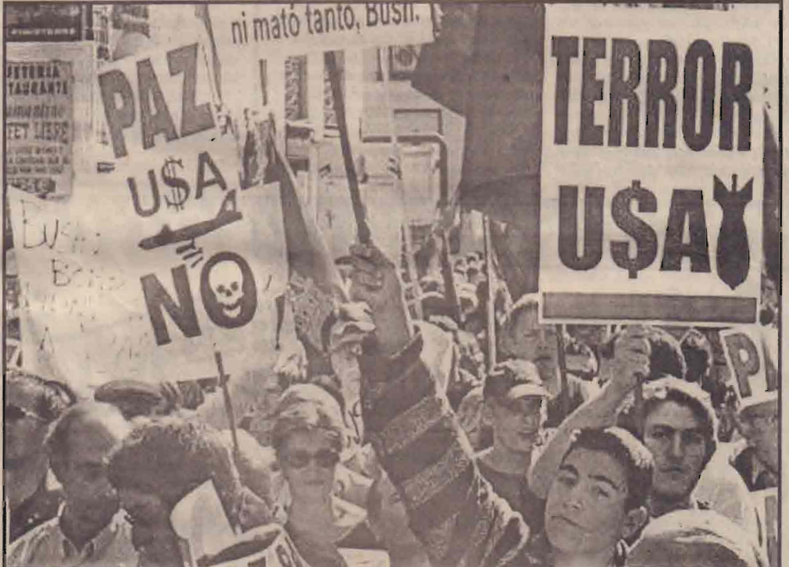
ஈராக் மீது அமெரிக்கா மேற்கொள்ளக்கூறும் என்று கருதப்படும் இராணுவ நடவடிக்கைக்கு உலகினரும் கிடுகிடு கரும் கண்டனம் எழுப்பப்பட்டு வருகிறது. ஸ்பெயின் தலைநகர் மட்ரிட்டில் நேற்றுமுன்தினம் குடியிருக்கிறவர்கள் இத்தகைய பெரும் ஆர்ப்பாட்டப் பேரணி ஒன்று கிடம்பெற்றது. போர் வேண்டாம் என வலியுறுத்தி ஆயிரக்கணக்கானோர் இந்த ஆர்ப்பாட்டப் பேரணியில் கலந்துகொண்டனர். கிவ்வாறான பெரும் பேரணி சனிக்கிழமையன்று லண்டனில் கிடம்பெற்றமை குறிப்பிடத்தக்கது.

இதற்கிடையில் - ஈராக் மீது போர்தொடுப்பதற்கான நடவடிக்கைகளை அமெரிக்காவும் பிரிட்டனும் மேற்கொண்டு வருவதற்கு உட்கொங்கும் கடும கண்டனம் தெரிவிக்கப்படுகின்றது. பல நாடுகளின் முக்கிய நகரங்களில் ஆயிரக்கணக்கான, லட்சக்கணக்கான மக்கள் திரண்டு தமது எதிர்ப்பைத் தெரிவித்து வருகின்றனர். (ம)