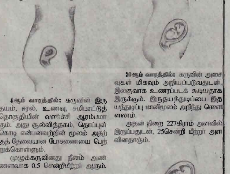
4ஆம் வாரத்தில்: கருவீன் இருதயம், சரல், உணவு, சரியாட்டுத் தொகுதியின் வளர்ச்சி ஆரம்பமாகும். அது குல்வித்தகம், தொப்புள் கொடி என்பவற்றின் மூலம் அதற்குத் தேவையான போசணையை பெற்றுக்கொள்ளும்.

-பாரதிதாசனி- ஒவ்வொரு குழந்தையும் மிகவும் முக்கியமானது. தாய்மை புனிதமானது. கருவீனில் கிருக்கும் போதே குழந்தையின் வளர்ச்சியைக் கண்காணித்துக் கொள்ளவேண்டும். பிறப்பு நிறை கூடுதலாக உள்ள பிள்ளை நோய்களைத் தாங்கும் தன்மையினைக் கூடுதலாகக் கொண்டிருக்கும். ஒழுங்கான கர்ப்பகாலப் பராமர்ப்பு பிள்ளையின் பிறப்பு நிறையைக் கூட்டுவதில் உதவி செய்யும் ஐக்கிய நாடுகள் சிறுவர் நிதியத்தினால் கர்ப்ப காலத்தில் தாயின் நிறை அதிகரிக்கும் விதமும், கருவீன் வளர்ச்சியும் தரப்படுகின்றது. ஆரம்பகாலக் கர்ப்பகாலப் பராமர்ப்பினை மேற்கொள்வதன் மூலம் சுகமான ஆரோக்கியமான குழந்தைகளை ஈன்றெடுக்கத் தாய்மாரை ஊக்குவிக்க வேண்டியது சமூகத்தில் உள்ள ஒவ்வொரு வரீனதும் கடமையாகும்..