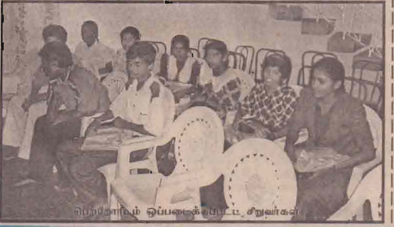
பெற்றோரிடம் ஒப்படைக்கப்பட்ட 12 சிறுவர்கள்

களால் ஒப்படைக்கப்பட்டனர். நேற்று மாலை 4.30 மணியளவில் விடுதலைப் புலிகளின் யாழ். மாவட்ட அரசியல் துறை பணிமனை (14ஆம் பக்கம் பார்க்க)