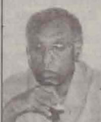
யாழ்.செயலகத்தில் நேற்று இடம்பெற்ற மாவட்ட ஒருங்கிணைப்புக் குழுவின் கூட்டத்தில் பேசிப்போதே