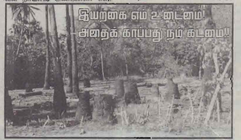
பூயற்கை எம் உடைமை! சிதைக் காப்பது நம் கடமை!