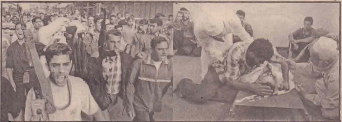
காலியூஸில் நேற்று இஸ்ரேலியப் படையினர் நடத்திய தாக்குதலில் உயிரிழந்த பலஸ்தீனர்களின் ஒருவரது கிறித்த ஊர்வலத்தையும் மருதியில் மற்றொருவரின் சடலம் கிறித்த சடங்குகளுக்காக வைக்கப்பட்டிருப்பதையும் படங்களில் காணலாம்.

இப்பகுதியில் பலஸ்தீனத் தீவிரவாதிகளின் ஆயுதத் தொழிற்சாலையும், வெடிபொருள் களஞ்சியமும் கண்டுபிடிக்கப்பட்டதையடுத்தே தீவிரவாதிகளின் நிலைகள் மீது இராணுவ நடவடிக்கை மேற்கொள்ளப்பட்டதாக இஸ்ரேல் தெரிவித்தது. இத்தாக்குதல்களுக்குப் பழிவாங்குவதாக ஹமஸ் இயக்கம் குறைத்தது. அப்பாவி பலஸ்தீனப் பொதுமக்கள் கொல்லப்பட்டதற்கு, இஸ்ரேலியப் பொதுமக்களைக் கொல்லாதே தண்டனை என்று அந்த இயக்கம் தெரிவித்தது.