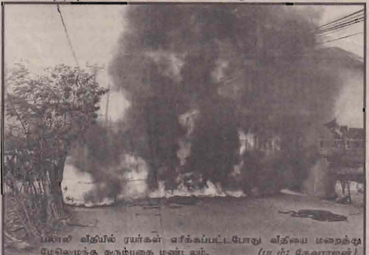
பாலாள் வீதியில் ரயர்கள் எரிக்கப்பட்டபோது வீதியை மறைத்து மேலிருந்து கரும்புகை மண்டலம்.

இதனால் படையினரின் வாகனப் போக்குவரத்துக்கள் குறைந்திருந்தன. யாழ்ப்பாணம் பகுதி மற்றும் வடமராட்சி, தென்மராட்சி பிரதேசங்களில் (02ஆம் பக்கம் பார்க்க)