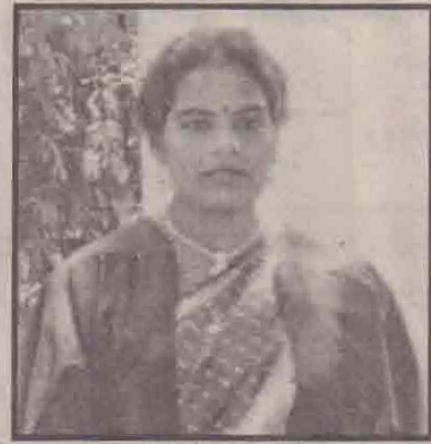
யா/சாவகச்சேரி கிந்துக் கல்லூரி ஆசிரியை