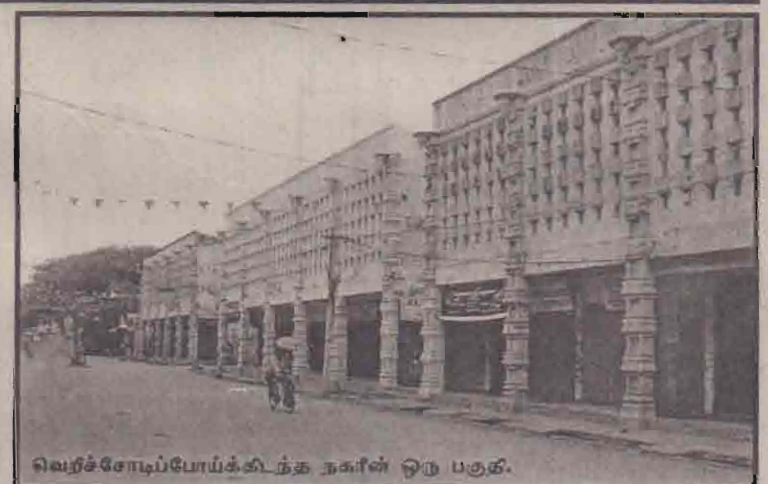
வெறச்சோழியேயக்கிடந்த நகரின் ஒரு பகுதி.

வடக்கு - கிழக்கின் சகல மாவட்டங்களிலும் ஹர்த்தால் பூணமாக அனுஷ்டிக்கப்பட்டதாக மகாண செய்தியாளர்கள் தகவல் தந்துள்ளனர். வன்னியில் பெருநிலப்பரப்பில் கிளிநொச்சி, முல்லைத்தீவு மாவட்டங்களில் பூண ஹர்த்தால் அனுஷ்டிக்க (02ஆம் பக்கம் பார்க்க)