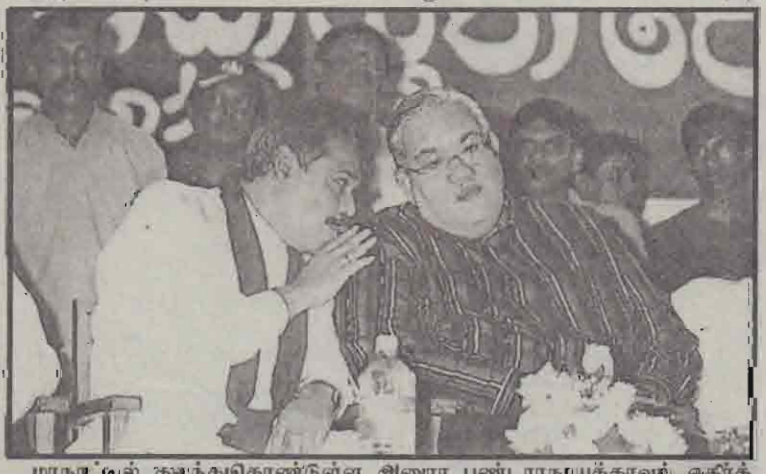
மாநாட்டில் கலந்துகொண்டுள்ள அனூரா பண்டாரநாயக்க அவர்கள் (மேலது) தலைவர் மஹந்த ராஜபக்ஷவும் ஒன்றாக அமர்ந்திருக்கும் காட்சி. அங்குமக்களமையாக அவர்கள் கருவரீடையையும் முரண்பாடு நன்வந்தமை குறிப்பிடக்கூடும்.

பாதுகாப்புப் படைவீரன் இந்த நெறிக்கொண்டு அலைகின்றனர். ஏற்கனவே உரிமையுடைய பல்லாயிரக் கணக்கானோர் கொல்லப்பட்டுள்ளனர். படைகளின் கடுமையான தன்னிட முன்னதாக சந்திரிகா அம்மையார் கூறுகிறார். ஆனால், மக்களால் தெரிவான மரபெறும் தலைவர் நீங்கள். உங்கள் பகீத முயற்சியால் பரிந்துரைவு உடன்பட்டு வந்தது. சமாதானம் துள்ளிவிட அனுப்பித்தவ்வளவு மகிழ்ச்சி. எனினும், சில படைவீரன் சமாதானத்தைக் குடும்பம் சீர்தியில் 70 படுவது போன்ற தெரிக்கிறது அவர்களை ஆக்கிரமணம் அரசு முன்னரவேண்டும் - இவ்வாறு கோரப்பட்டிருக்கிறது. (ம)