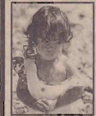
நாளைய சந்ததிக்காய் இன்றே சிந்திப்போம் வெளியீட்டு அஞ்சலான SC (UK)

'பெரியோரே! என் பேச்சிற்கும் கொஞ்சம் காது கொடுங்களேன்!!' "புக்களின் மென்மைபோல் மிகமிக மிருதுவானது என்மனது. அன்பையும் அணைப்பையும் மட்டுமே வேண்டி நிற்கும் எனக்கு உங்கள் அடட்டல்கள் அழகையை மட்டுமே பரிசாகத் தருகின்றன.