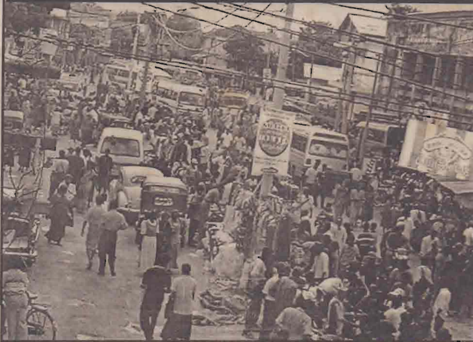
தீபாவளி பண்டிகைக்காகப் பொருள்களை வாங்குவதற்காக பெரும் எண்ணிக்கையானோர் யாழ்நகரப் பகுதிக்கு வருவதால் நகரில் சனநெருக்கடி. நேற்று முற்பகல் நகரின் ஒரு பகுதியில் காணப்பட்ட மக்கள் கூட்டத்தையே படத்தில் காண்கிறீர்கள்.