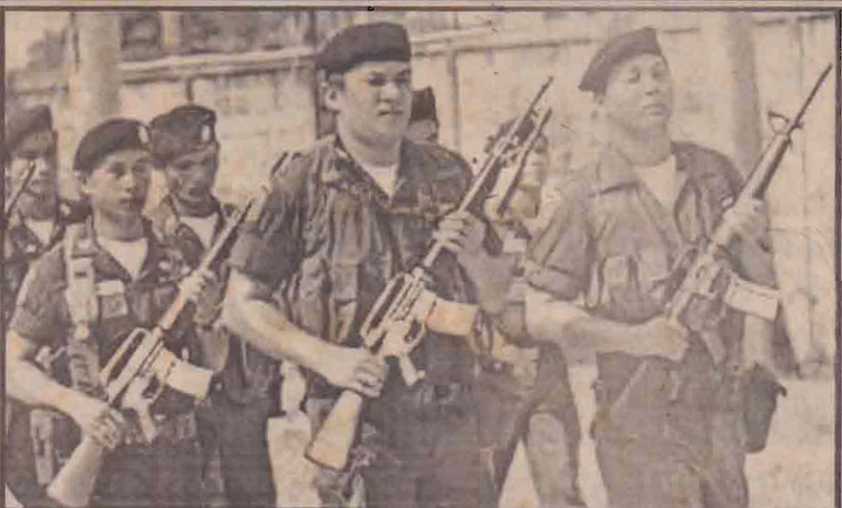
தாய்லாந்தின் நாக்கென் பாத்தெம் நகரில் அரசுக்கும் விடுதலைப் புலிகளுக்கும் இடையில் சமாதானப் பேச்சுக்கள் நடைபெற்று வரும் ஹோட்டலைச் சுற்றி தாய்லாந்து விசேட பொலீஸார் தீவிர பாதுகாப்பு நடவடிக்கைகளை மேற்கொண்டுள்ளனர். அவர்களின் ரோந்து நடவடிக்கையை படத்தில் காண்கிறீர்கள்.

அபிவிருத்திக்கான உபகுழு, மனிதாபிணப் பணிக்கான உபகுழு ஆகியவற்றுக்கு மேலதிகமாக அரசியல் விடயங்களை கையாள்வதற்கான முன்றாவது உபகுழுவை அமைப்பதற்கு தற்போது இணக்கம் (16ஆம் பக்கம் பார்க்க)