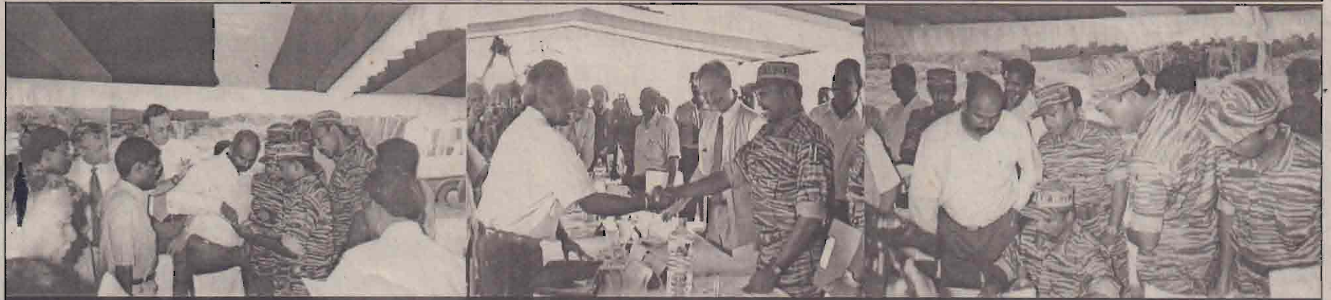
ஓய்வகையில் நேற்றுமுன்தினம் அரசு மற்றும் புலிகளின் பிரதிநிதிகள் நேரில் சந்தித்து... கலந்துபேசி... முடிவுகளை மேற்கொண்டனர். அப்போது எடுக்கப்பட்ட படங்கள் இவை.