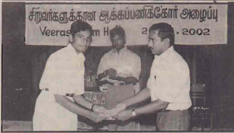
சிறுவர்களுக்கான 'ஆக்கப்பணிக்கோர் அழைப்பு' என்னும் நிகழ்வு அண்மையில் யாழ். விரசீங்கம் மண்டபத்தில் நடைபெற்றது. மேற்படி நிகழ்வை முன்னிட்டு நடத்தப்பட்ட போட்டியில் வெற்றி பெற்ற மாணவன் ஒருவனுக்கு யாழ். பிரதேச செயலர் பா.செந்தில்நந்தனன் சான் நிகழ் வழங்குவதைப் படத்தில் காணலாம். (எ-76)