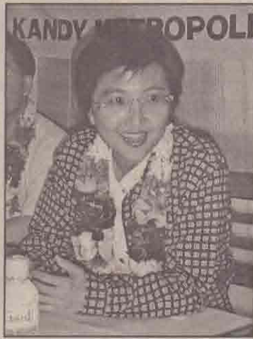
போதைய விஜயம் அரசியல் ரீதியானது அந்நல் சேவையை அடிப்படையாகக் கொண்டது. எனினும், சமாதானத்துக்கான தற்போதைய முன்னெடுப்புகள் வெற்றிபெறும் - வெற்றி பெறவேண்டும் என்ற எதிர்மார்ப்பு எனக்கு உண்டு - என்றார்.

இதற்கு பதிலளித்த அவர், தற்போதைய விஜயம் அரசியல் ரீதியானது அந்நல் சேவையை அடிப்படையாகக் கொண்டது. எனினும், சமாதானத்துக்கான தற்போதைய முன்னெடுப்புகள் வெற்றிபெறும் - வெற்றி பெறவேண்டும் என்ற எதிர்மார்ப்பு எனக்கு உண்டு - என்றார்.