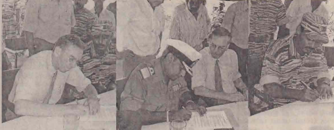
நேற்றைய கூட்டத்தீர்மானங்கள் அடங்கிய அறிக்கையில் கண்காணிப்புக்குழு, கடற்படை, கடற்புலிகள் ஆகிய முத்தரப்புகளின் பிரதிநிதிகளும் ஒப்பமிடுகின்றனர்.