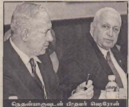
நெதன்யாகுவுடன் பிரதமர் ஷெரோன்

ஜெருசலேம், நவ. 14 இஸ்ரேலியப் பிரதமராகத் தான் தெரிவு செய்யப்பட்டால் பலஸ்தீனப் பிரதேசத்திலிருந்து பலஸ்தீனப் தலைவர் யஸ்ர் அரபாத்தை வெளியேற்றுவதாக இஸ்ரேலிய வெளி விவகார அமைச்சர் பென்ஜமின் நெதன்யாகு வாக்குறுதி அளித்துள்ளார். தனது தொலைக்காட்சி உரையில் அவர் இதனைத் தெரிவித்தார்.