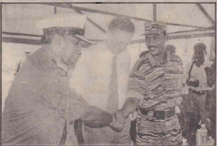
முகமாலைபில் நேற்று பாதுகாப்பு உப குழுவின் கூட்டத்தில் கடற்படையினர் சார்பில் வடபிராந்தியக் கடற்படைத் தளபதி ரியர் அட்மிரல் சரத் வீரசேகரவும் கடற்புலிகளின் சார்பில் கடற்புலிகளின் பிரதித் தளபதி லெப்.கேணல் செழியனும் கைலாகு கொடுக்கும் காட்சி. நடுவில் யுத்தநிறுத்தக் கண்காணிப்புக் குழுத் தலைவர் ரொண்ட் புகுரோவ்டே காணப்படுகிறார். மேலும் படங்கள் 2ஆம் பக்கத்தில்