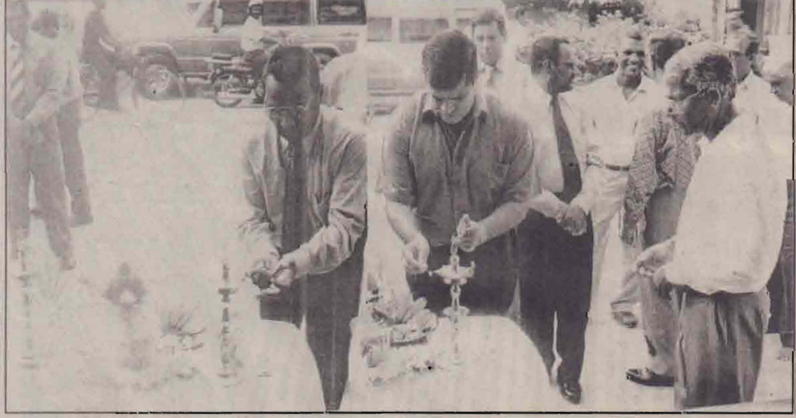
கடந்த 9ஆம் திகதி நவலோக நிறுவனத்தினரின் உற்பத்திகளுக்கான முகவர் நிலையம் யாழ்ப்பாணத்தில் திறந்துவைக்கப்பட்டது.

மேலை நாடுகளில் தற்போது "குளுக்கோசமின்" என்னும் புதிய மருந்து பாவிக்கப்பட்டு வருகின்றது. இம்மருந்து மூட்டு வலியிலிருந்து முற்றாக நிவாரணம் அளிக்கின்றது. மற்றும் பாதிக்கப்பட்ட வலியை மூட்டுக்களை மீளமைக்கின்றது. "குளுக்கோசமின்" உணவில் காணப்படும் ஒரு புரதம் சேர் சீனியாகும். இது மென் எலும்பு உற்பத்தியில் பெரும் பங்கு வகிக்கின்றது. இவ்வகையில் தற்போது குளுக்கோசமின் "ரிகோவா" (Ricova) என்னும் பெயரில் விற்கப்படுகின்றது. "ரிகோவா" ஐ ஆர்கேம் (ARKEM) நிறுவனத்தினர் இந்தியாவில் புகழ்பெற்ற "மெக்ஸ்" நிறுவனத்தினரிடம் இருந்து இறக்குமதி செய்கின்றனர். ரிகோவா மருந்தை ஆலோசனையுடனே அல்லது தற்போது நேரடியாக யாழ்ப்பாண பிரதான மருந்தகங்களிலோ பெற்றுக்கொள்ளலாம். எனவே, இன்று முதல் மூட்டுவலிக்கு முற்றிய புள்ளி வைக்கலாம்.