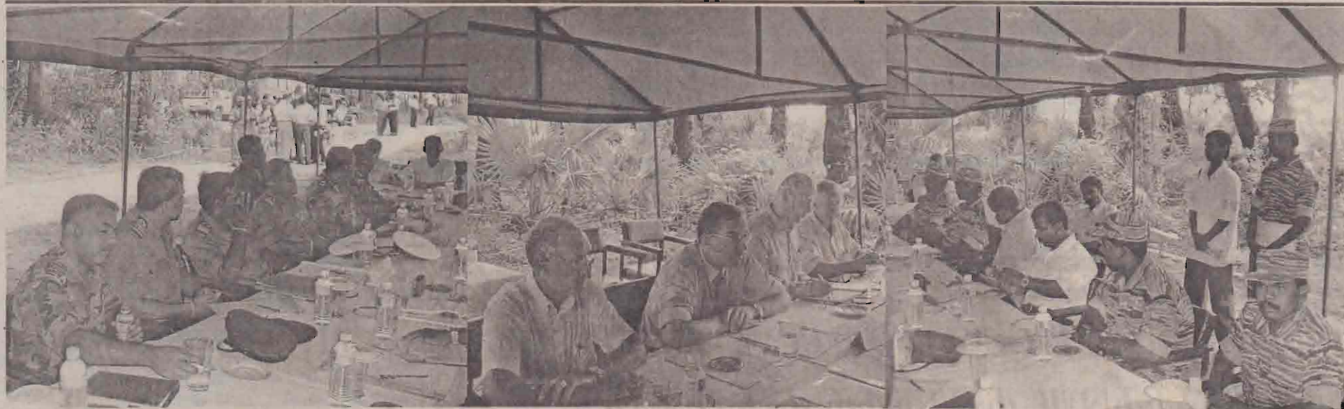
முகமாலையில் நேற்று நடைபெற்ற பாதுகாப்பு உப குழுவின கூட்டத்தில் கலந்துகொண்ட படைத்தரப்பு பிரதிநிதிகள், கண்காணிப்புக் குழுவினர், புலிகள் தரப்பு பிரதிநிதிகள்.