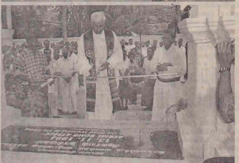
குருநகர் புனித யாசுபர் ஆலயம் மீதான குண்டு வீச்சின் ஒன்பதாவது ஆண்டு நினைவுத் தின நிகழ்ச்சி நேற்று நடைபெற்றபோது எடுக்கப்பட்ட படங்கள் இவை. மறைமாவட்டக் குழுமுதல்வர், பங்குத்தந்தையர்கள் நினைவுச்சலி நிகழ்வுக்கு அழைத்துச் செல்லப்படுகின்ற முகலாவது படத்திலும் நீதிக்கும் சமாதானத்துக்குமான ஆலயத்தை கனடா, ஆர். எம். ஜி. நே. சூ. சூ. அடிகளார் நாடா வெட்டிக் கொண்டு வைப்பதை கிரேண்டாவது படத்திலும் காணலாம். குருநகர் பங்குத் தந்தையர் அருட்கிழி, ஜெயசேகரம் அடிகளாரும் படத்தில் காணப்பட்டுள்ளனர்.