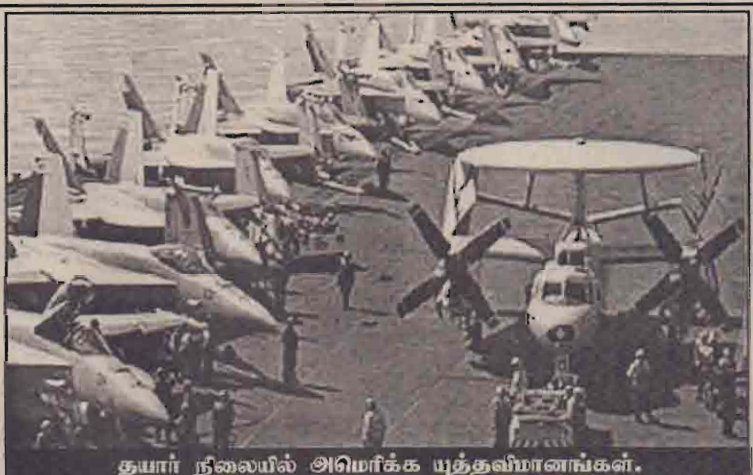
தயார் நிலையில் அமெரிக்க யுத்தவீரர்கள்.

நாடாளுமன்ற நடவடிக்கைகள் ஈராக் ரீதியில் ஒளிபரப்பப்படவில்லை. நாடாளுமன்ற முடிவை அறிய மக்கள் ஆவலுடன் ஆங்காங்கே காத்திருந்தனர். கத்தாரின் அல்ஜசீரா ரீ.வி. மட்டும் நாடாளுமன்ற நடவடிக்கையை ஒளிபரப்பியது. சாடிஸ்ட் டிப்கைகள் நிறுவ ஈராக்சில் அனுமதி இல்லை.