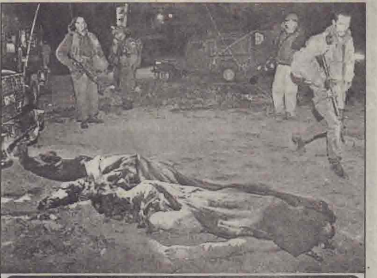
ஹெப்ரோவில் இஸ்ரேலியப் படையினர் மீதான தாக்குதலில் பலியானதாகக் கூறப்படும் பலஸ்தீன தீவிரவாத ஒருவரின் சடலம்.

வில்லை. அமெரிக்கத் தயாரிப்பான அபாசி ரக தாக்குதல் ஹெஸ்கொட்டர்கள் இத்தாக்குதலை நடத்தியதாக அங்குள்ள சி.என்.என் செய்தியாளர் ஒருவர் கூறியிருக்கிறார். இஸ்ரேலியர்கள் மீதான தாக்குதல் நடப்பதற்கு முன்பாக வெள்ளிக் கிழமை காலையில் 16 வயதான பலஸ்தீன சிறுவன் ஒருவனை இஸ்ரேலியப் படையினர் சுட்டுக் கொன்றிருக்கின்றனர். (ஐ)