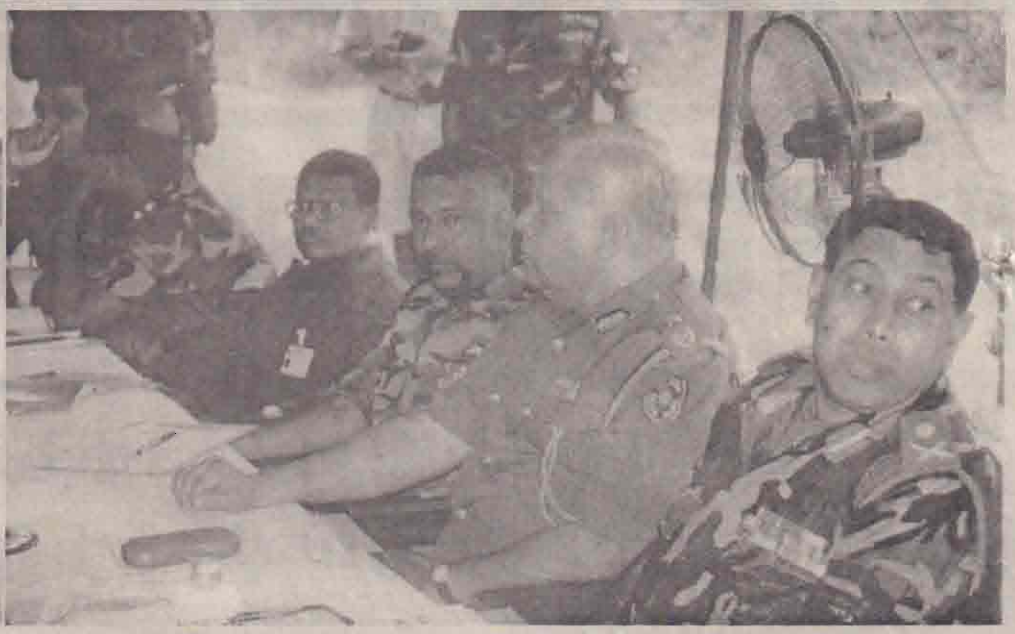
நேற்று முகமலால் சூனியப்பிரதேசத்தில் நடந்த பாதுகாப்பு உப குழு கூட்டத்துக்கு வருகை தந்த அரசு, புலிகள் குழுக்களின் தலைவர்களை கண்காணிப்புக்குழு அதிகாரி வரவேற்புமையும் பேச்சுக்களில் கலந்து கொண்ட இரு தரப்பும் பிரதிநிதிகளையும் படங்கவில் காணலாம்.