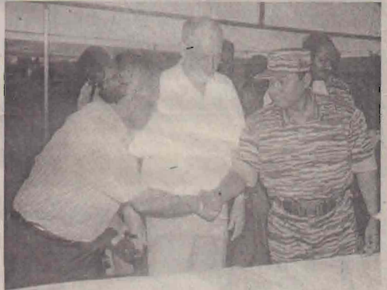
முகமாலைில் நேற்று நடந்த சந்திப்பில் கண்காணிப்புக் குழு பிரதேச முன்னிலையில் அரசு - புலிகள் குழுக்களின் தலைவர்கள் கைலாகு நிகாடுக்க காட்சி. (மேலும் படங்கள் 2,3ஆம் பக்கங்களில்)

இந்தக் குழுக்களில் அரசு பிரதிநிதிகளும் விடுதலைப் புலிகளின் (02ஆம் பக்கம் பார்க்க)