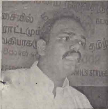
கிளிநொச்சி நவம்பர் 21 மது மக்கள் அமைதியான சூழலில் - இயல்பு வாழ்க்கை மேற்கொள்வதை உறுதிப்படுத்தும் விடயங்க