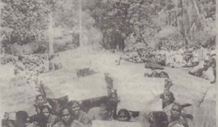
நெடுந்தீவில் தரையிறங்கியுள்ள ச.பி.டி.பி.யினரை அங்கிருந்து வெளியேற்றும் போது கோரி ஆர்ப்பாட்டம் நடத்திவரும் பொதுமக்களையே படத்தில் காண்கிறீர்கள்.