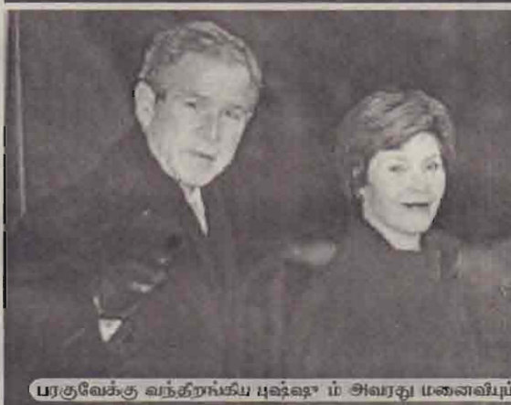
பரகுவேக்கு வந்திரங்கிய புஷ்ஷும் அவரது மனைவியும்

வாஷிங்டன், நவ.21 நேட்டோ பனிடீயோருக்குப் பின்னா தனது படைத்திறத்தை 'உண்மையான அச்சுறுத்தல்'களுக்கு எதிராகவும் 'உலகப் பயங்கரவாதத்துக்கு எதிராகவும் போராடுவதற்காகக் குவிக்க வேண்டிய தருணம் வந்துள்ளது. நேட்டோவின் எதிரி ரஷ்யா இல்லை; அதன் எதிரி உலகப் பயங்கரவாதிகளே. அவர்கள் சுதந்திரத்தை வெறுப்பவர்கள். சுதந்திரத்தின் பெயரால் அந்த எதிரியை தோற்கடிக்கும் பணிகளை நாம் மேற்கொள்ளமுடியும்". - இவ்வாறு அமெரிக்க அதிபர் ஜோர்ஜ் டபிள்யூ புஷ் தெரிவித்துள்ளார். பெரகுவேயில் இன்று ஆரம்பமாகவுள்ள நேட்டோ மாநாட்டில் கலந்து கொள்வதற்காக வந்துள்ள அதிபர் புஷ் அங்கு நேற்று செக் குடியரசின் அதிபர் வக்சாவ் ஹவெல்ஸ்ச் சந்தித்துப் பேசிய பின்னர் செய்தியாளர்களிடம் உரையாற்றியபோது மேற்கண்டவாறு தெரிவித்தார்.