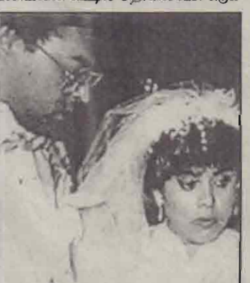
பற்றீசியா - லோயல்

தொடர்புகொள்ள முயற்சித்தபோதும், தொலைபேசியை ஒலித்ததே தவிர லோயலின் வீட்டில் தொலைபேசி எஞ்சியிருந்தது.