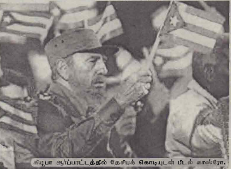
கியூபா ஆர்ப்பாட்டத்தில் தேசியக் கொடியுடன் பிட் காஸ்ரோ.

கட்சியின் வேட்பாளரான புருகு கென்யட்டா தற்போதைய அதிபர் டானியல் ஆப் மொய் சகிதம் பல்லாயிரக்கணக்கான ஆதரவாளர்கள் புடைசூழ வந்து முதலில் தமது வேட்புமனுவைத் தாக்கல் செய்தார். சில மணி நேரங்களின் பின்னர் தனது ஆதரவாளர்கள் புடை சூழ வந்த அதிர்க்கட்சித் தலைவரும் வேட்பாளருமான மாய் கிபாக்கியும் வேட்புமனுவைத் தாக்கல் செய்தார்.