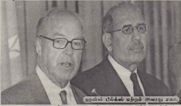
ஹன்ஸ் பில்க்ஸ் மற்றும் அவரது சகா.

சைப்பிரஸ், நவ.21 ஈராக் தன்னிடம் பேரழிவைத் தரும் ஆயுதங்கள் எவையெல் இல்லை என்று நிரூபிக்கவேண்டும். - இவ்வாறு ஐ.நா. ஆயுதக் கண்காணிப்புக் குழுவின் தலைவர் ஹன்ஸ் பில்க்ஸ் தெரிவித்துள்ளார். கடந்த திங்கட்கிழமை ஈராக் சென்ற அவரும் அவரது சகாவான மொஹமட் எல் புராடிபும் நேற்று புதன கிழமை சைப்பிரஸ் திரும்பினார். ஈராக் குக்கான தமது இரு நாள் விஜயம் குறித்து செய்தியாளர்களிடம் கருத்துத் தெரிவித்த போதே பில்க்ஸ் மேற்கண்டவாறு தெரிவித்தார். அவர்களுடன் ஈராக் சென்ற 20 இற்கும் மேற்பட்ட கண்காணிப்புக்குழு அதிகாரிகள்