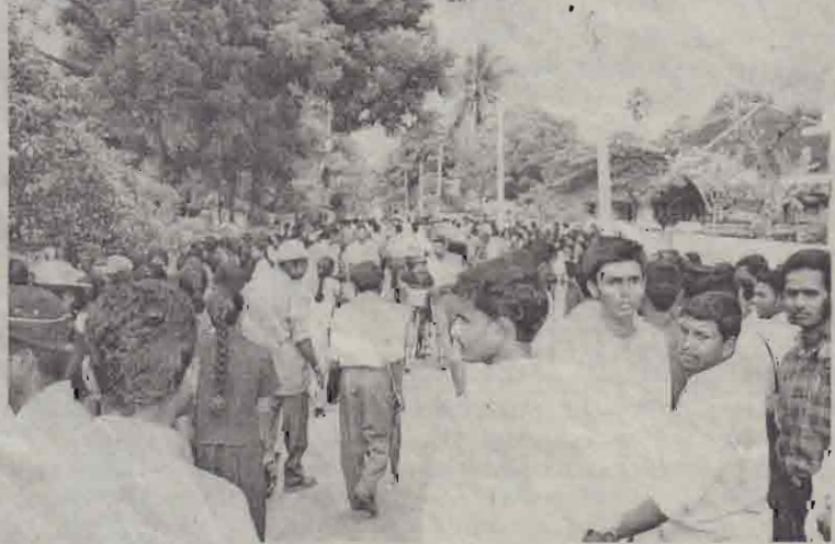
நெடுந்தீவில் கைதான பல்சேவைக்குக் காரணமான விடுவிக்கக்கூடாது யாழ். பல்சேவைக்குக் காரணமாக நேற்றுக் கண்காணிப்புக் குழுவிடம் மொகூ அமைப்புகள் கோரிக்கை செய்து சென்று மகஜர் கையளித்தபோது எடுக்கப்பட்ட படங்கள்.

(முதலாம் பக்கத் தொடர்ச்சி) பாடசாலைகள் இயக்கிய போதிலும் மாணவர்கள், ஆசிரியர்களின் வரவு குறைந்து காணப்பட்டது. வந்ததக் நிலையங்கள் யாவும் நேற்று முற்பகல் 10 மணிவரை மூடப்பட்டிருந்தன. காலைப் பாடசாலை மாணவர்களுக்காக மட்டும் நடத்தப்பட்ட பஸ் சேவை முற்பகல் 10 மணிக்குப் பின்னரே வரலுக்குத் திறம்பியது. எனினும், தீவிரப்பகுதியில் தொடர்ச்சியாக நடத்தப்பட்டுவரும் எதிர்ப்பு, ஹிமலிப்பு, போராட்டம் காரணமாக தீவிரப்பகுதிகளான பல்சேவைகள் நடைபெறவில்லை. இதேவேளை - பல்சேவைகள், காலை 10 மணிவரை நடைபெறாது என்பதை அறிந்துகொள்ளாத பொது மக்கள் பஸ் நண்டநேரமாக பஸ் தரிப்பு நிலையங்களில் காத்திருந்ததைக் காணமுடிந்தது. மேற்படி எதிர்ப்புப் போராட்டம் காரணமாக நேற்றுக் காலைவில் நெரிசேபோடிக் காணப்பட்ட யாழ் நகரப் பகுதி (முற்பகல் 10:30) மணிக்குப் பின்னர் வழமை நிலைக்குத் திரும்பியது. இதேவேளை - எதிர்ப்பு நடவடிக்கைகளை இன்று குடாநாடு முழுவதும் விஸ்தரிப்பதற்கு மாணவர் அமைப்புகளும் வெகுஜன அமைப்புகளும் நடவடிக்கை மேற்கொண்டுள்ளன. இன்று நடைபெறவுள்ள எதிர்ப்பு நடவடிக்கைகள் குறித்து இன்று, காலை மாணவர்கள் கூடி முடிவு செய்வர் என்று மாணவர் ஒன்றிய வட்டாரங்கள், தெரிவித்தன. (ஐ-8-10-13-17-36)