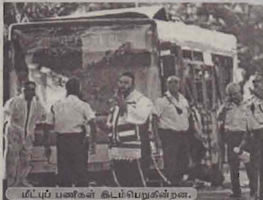
மீட்புப் பணிகள் கிடம்பெறுகின்றன.

ஜெருசலேம், நவ.22 இஸ்ரேலின் கட்டுப்பாட்டிலுள்ள ஜெருசலேம் நகரில் நேற்று அதிகாலை பயணிகள் பஸ்மீது நடத்தப்பட்ட தற்கொலைத் தாக்குதலில் 11 பேர் கொல்லப்பட்டனர்; 40 பேர் காயமடைந்தனர்.