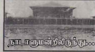
நாடாளுமன்றிலிருந்து ஒருவரை ஒருவர் பண்படுத்தும் வகையில் அமைந்துவிட்டதைக் குறிப்பிட்டே ஆகவேண்டும்.

கிழக்கு அபிவிருத்தி அமைச்சர் சம்பந்தமான விவாதம் காரசாரமாகவும் சூடாகவும் இருந்தாலும், அது