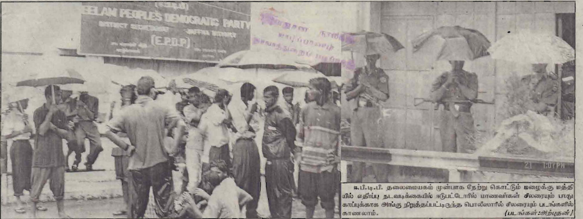
ஈ.பி.டி.பி. தலைமையகம் முன்பாக நேற்று கொட்டும் மழைக்கு மத்தியில் எதிர்ப்பு நடவடிக்கையில் ஈடுபட்டோரில் மாணவர்கள் சிலரையும் பாதுகாப்புக்காக அங்கு நிறுத்தப்பட்டிருந்த பொலீஸரில் சிலரையும் படங்களில் காணலாம்.

சுடர் 17 வள்ளுவர் ஆண்டு 2033 கார்த்திகை 6 வெள்ளிக்கிழமை (22-11-2002) UTHAYAN - A Lively National Tamil Daily கதிர்: 360