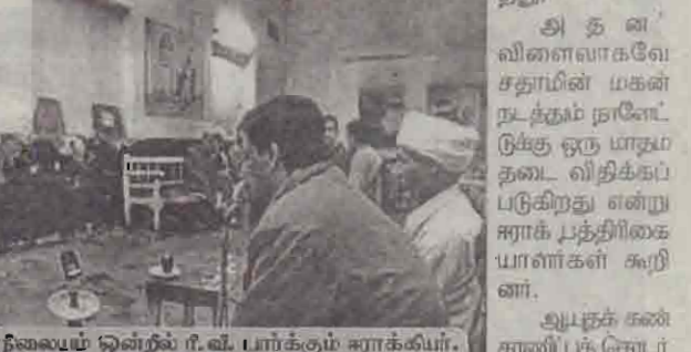
மதுவீர்ப்பனை நிலையை ஒன்றில் ரீ.வ. பார்க்கும் ஈராக்கியர்.

அரபு நாடுகளுக்கும் அரபுத் தலைவர்களுக்கும் எதிரான செய்திகளை ஈராக் பத்திரிகைகள் வெளியிடக்கூடாது என்று செய்தித் துறை உத்தரவு பிறப்பித்துள்ளது.