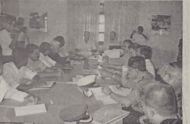
நேற்றுமுன்தினம் திருமலையில் நடந்த பாதுகாப்பு உப குழுவின் கூட்டத்தில் அரசு - புலிகளின் பிரதிநிதிகள்.

திருமலைக் கடற்பகுதியில் மீனவர்கள் எதிர்போக்கும் பிரச்சினைகளை இணக்கம் ஏற்று, அவற்றுக்கான தீர்மானம் கண்டிப்பதற்காக கடற்படை அதிகாரி ஒருவரை நியமிப்பதற்கும் கூட்டத்தில் முடிவு செய்யப்பட்டதாகவும், அவர் மேலும் சொன்னார். (ஐ-3)