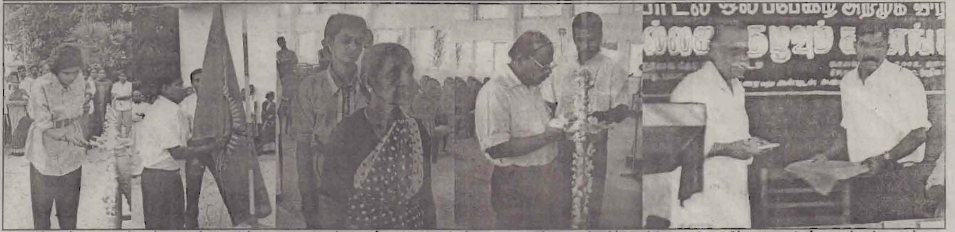
நிதர்சனம் நிறுவனத்தால் கிசைப்பிரியனின் கிசைநெறியாள்கையில் உருவான 'கல்லறை தழுவும் கானங்கள்' ஒலிப்பேழை வெளியீட்டு விழா நேற்று யாழ். பல்கலைக்கழக நூலக கேட்போர் கூடத்தில் கிடம்பெற்றது.

கிந்தகழுவில் போராளி யூமா பொது ஈகச்சுடர் ஏற்றுவதையும், புல்களின் யாழ். மாவட்ட கொள்கை முன்னெடுப்புப் பொறுப்பாளர் நசாந்தன் தமிழீழத் தேசியக்கொடி ஏற்றுவதையும், சிறப்பு எல்லைப்படை மாவிர் அன்புவின் தாயார், கடற்கரும்புலி கட்டன் சுதாசுரீன் தந்தை ஆகியோர் ஈகச்சுடர் ஏற்றுவதையும் ஒலிநாடாவின் முதல் பிரதமைய நஷாந்தனிமீருந்து கிசையமைப்பாளர் கண்ணன் பெறுவதையும் படங்களில் காணலாம்.