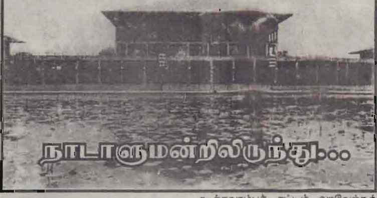
நாடாளுமன்றிலிருந்து... உச்சவரம்புச் சட்டம் வரவேற்கத் தக்கது. 50 ஏக்கர் காணிக்கு மேல் வைத்திருக்க முடியாது - என்றார்.

முன்னாள் காணி அமைச்சர் காலஞ்சென்ற ஹெரெட்டி கோப்பே கடுமையான சொல்லுரைப்பட்டு காணி