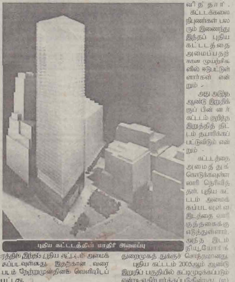
புதிய கட்டடத்தில் மாதிர் அமைப்பு

அகலமான மாடிப் படிகளைக் கொண்ட இந்த மாளிகை கண்ணாடி, இரும்பால் உருவாக்கப்பட உள்ளது. இது 52 மாடிகளைக் கொண்டது. தீவிபத்துக்கள் ஏற்படாத வகையில் இந்தக் கட்டடத்தை அமைப்பதற்குத் தீர்மானித்துள்ளார்கள் என்று நியூயோர்க் நகர மேயர் மைக்கல் தெரிவித்தார்.