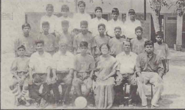
யாழ், கல்வி வலயப் பாடசாலை அணிகளுக்கிடையே நடத்தப் பட்ட உதேபந்தாட்டச் சுற்றுப்போட்டியில் கோட்ட மட்டத்தில் முதலாம் கிடத்தையும், வலய மட்டத்தில் கிரண்டாம் கிடத்தையும் பெற்றுக் கொண்ட கொழும்புக்குறை எசன். ஜோசப் வித்தியாலய அணி வீரர்கள், பொறுப்பாளிகள் ஆகியோரைப் படத்தில் காணலாம். (ம-51)

தென்னாபிரிக்க அணியின் முன்னாள் தலைவர் ஹன்சி குரெஞ்சே இறுதியாகப் பங்குபற்றிய சுற்றுப் போட்டி இதுவாகும். இதுவரை 191 ஒருநாள் போட்டிகள் சார்ஜாவில் நடைபெற்றன. (ம-5)