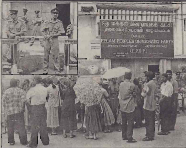
ஈ.பி.டி.பி.யினரின் யாழ்.தலைமையகமான ஸ்ரீதர் தியேட்டர் முன்பாக கிரண்டாவது நாளாக நேற்றும் மறியற் போரில் ஈடுபட்டோரில் ஒரு பகுதியினரைப் படத்தில் காணலாம். (உட்படம்: ஈ.பி.டி.பி.யினரின் யாழ்.தலைமையகத்தை பாதுகாக்கும் பொல்லார்)