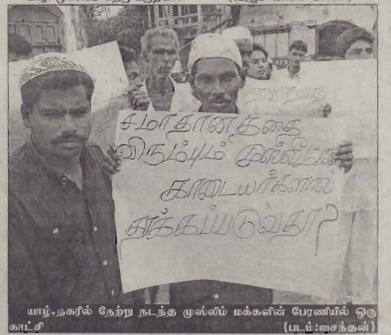
யாழ். நகரில் நேற்று நடந்த முஸ்லிம் மக்களின் பேரணியில் ஒரு காட்சி (படம்: வசந்தன்)

யாழ்ப்பாணம், நவ.23 நிலத்தில் கிடந்த 'வயர்' ஒன்றை விளையாட்டாகப் பிடித்திருந்த சிறுவன் அதனுடன் இணைக்கப்பட்டிருந்த பொறிவெடி வெடித்ததில் படுகாயமடைந்தான். கோடிமடம் இயற்றாலைப் பகுதியில் நேற்றுப் பிற்பகல் 4 மணியளவில் இந்தச் சம்பவம் இடம்பெற்றது. இதில் அதே இடத்தைச் சேர்ந்த ஆர். தேவகரன் (வயது 9) என்ற சிறுவனை படுகாய மடைந்தான். இச்சிறுவன் யாழ் (12ஆம் பக்கம் பார்க்க)