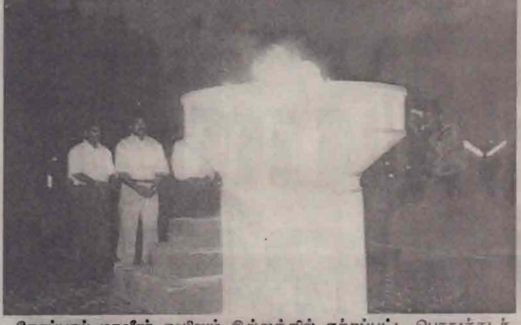
கோப்பாய் மாவீரர் துயிலும் இல்லத்தில் ஏற்றப்பட்ட பொதுச்சுடர்

துயிலும் இல்லம் இரவு பார்ப்போரின் கண்களைப் பறிக்கும் வகையில் மிகவும் அழகாகக் காட்சியளித்தது. நிகழ்வுகள் நிறைவடைந்த பின்னரும் கூட மாவீரர்களின் பெற்றோர் தமது பின்னங்களைக் கல்லறைகளை விட்டுப் பிரிய மனமின்றி இரவராக அங்கு இருந்து கண்ணீர் வழங்கியும் அவதானிக்கமுடிந்தது. மாவீரர்களின் உறவினர்களுக்கான வாகன ஒழுங்குகள் மற்றும் தூர இடங்களில் இருந்து வந்தவர்களுக்கான தங்குமிட வசதிகள் என்பனவும் ஏற்பாடு செய்யப்பட்டிருந்தன.