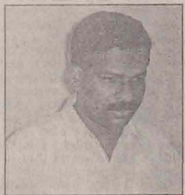
விப்பதற்காகப் பேராடிக்கொண்டிருக்கும் விடுதலை இயக்கம். இவ்வாறு தெரிவித்தார் தமிழ்

யாழ்ப்பாணம், நவ.28 விடுதலைப் புலிகள் போட்டி அரசியலமைப்பு அல்ல தமிழ் இனத்தை அடிமைத் தளங்களில் இருந்து விடு