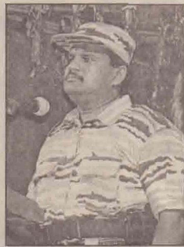
மூலம் பிரச்சினைக்குத் தீர்வுகாண் பதற்கு தலைவர் முயற்சி எடுத்தார். இன்று சர்வதேசப் பேச்சுக்கள் மூலம் இனப்பிரச்சினைக்கு முடிவுகாண வேண்டும் என்பதில் உறுதியாக இருக் கின்றார். பல தொந்தரவுகள், நெருக் கடிக்கு மத்தியிலும் சமாதானக் கரத்தை நாம் நீட்டி நிற்கின்றோம். புரிந்துணர்வு ஒப்பந்தத்தில் குறிப்பிட்ட பல விடயங்கள் அரசி னால் இன்னமும் நிறைவேற்றப் படவில்லை. வடமராட்சி கிழக்கு மக்