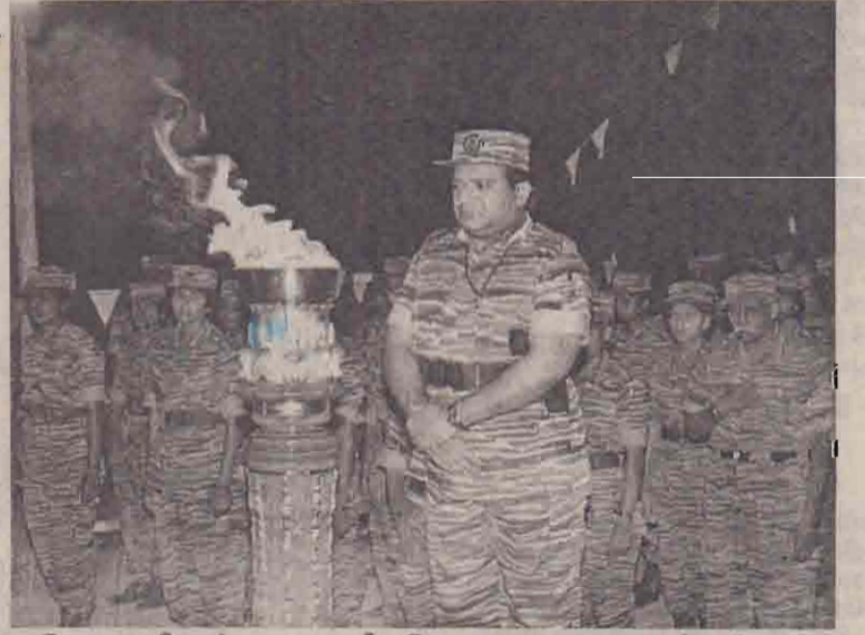
போராளிகள், தளபதிகளோடு அகவணக்கம்....