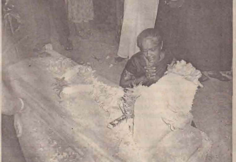
கோப்பாய் மாவீரர் துயிலும் இல்லத்தில் நேற்று மாலை நெஞ்சை நெகிழ வைத்த காட்சிகளில் சில.....