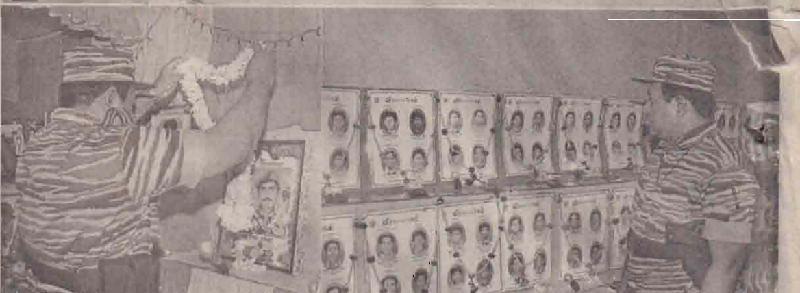
வன்னியில் விடுதலைப் புலிகளின் தலைவர் வே. பிரபாகரன் கலந்துகொண்ட மாவீரர் தின நிகழ்வில் எடுக்கப்பட்ட மேலும் சில படங்களை கீழ்க்காண்கிறீர்கள்.