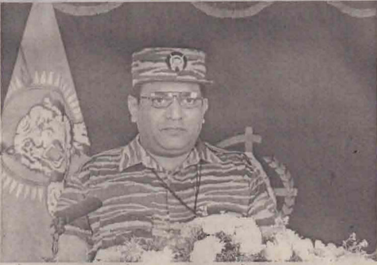
மாவீரர் தின உரையாற்றியபோது...