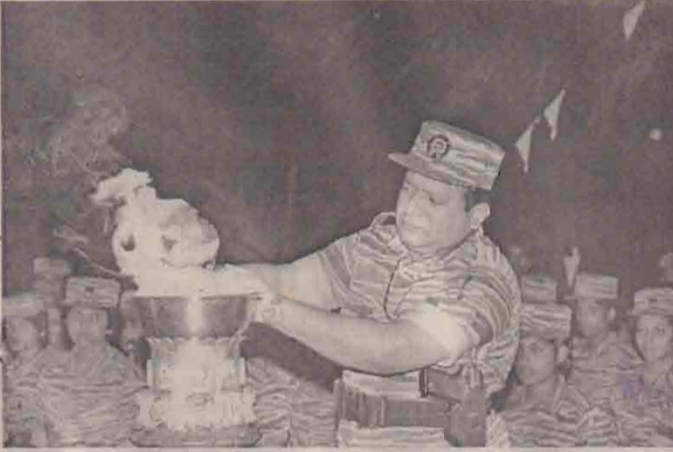
சக்சு கடர் ஏற்றிய காட்சி....