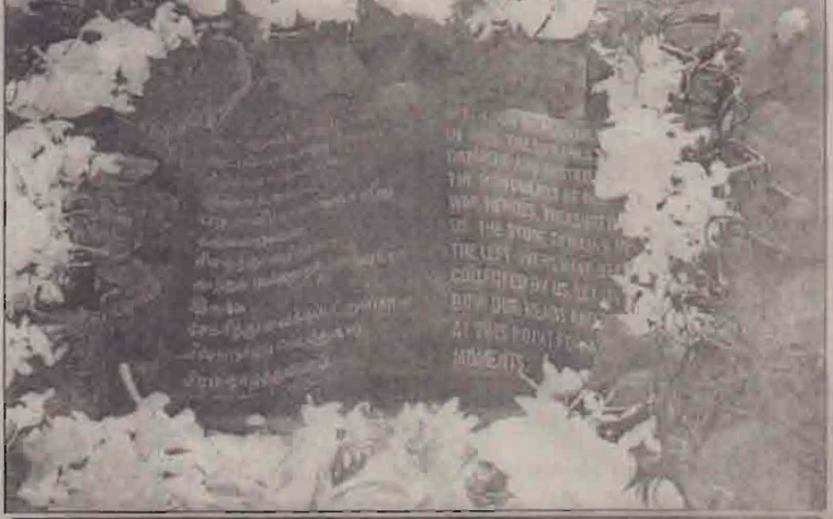
கண்ணாடிப் பேழையினுள் மாவீரர் கல்லறை எச்சங்கள்

துயிலும் இல்லத்தின் இரண்டு வாயில்களுடாகவும் பாண்டி வாத்தியங்கள் சகிதம் மாவீரர்களின் பெற்றோர் உள்ளே அழைத்துவரப்பட்டனர். தெல்லிப்பறை மகாஜனக் கல்லூரி, சண்டிலிப்பாய் இந்துக் கல்லூரி, ஸ்கந்தவரோதயாக் கல்லூரி, யுனியன் கல்லூரி ஆகிய பாடசாலைகளின் பாண்டி வாத்திய அணிகள் வாத்திய இசை வழங்கின. துயிலும் இல்லத்துக்குள் சென்றும் பெற்றோர்கள் மற்றும் உறவினர்கள் தத்தமது பிள்ளைகளின் கல்லறைகளைக் கட்டியணைத்துக் கதறி அழுத காட்சி மனதை உருக்குவதாக அமைந்தது.