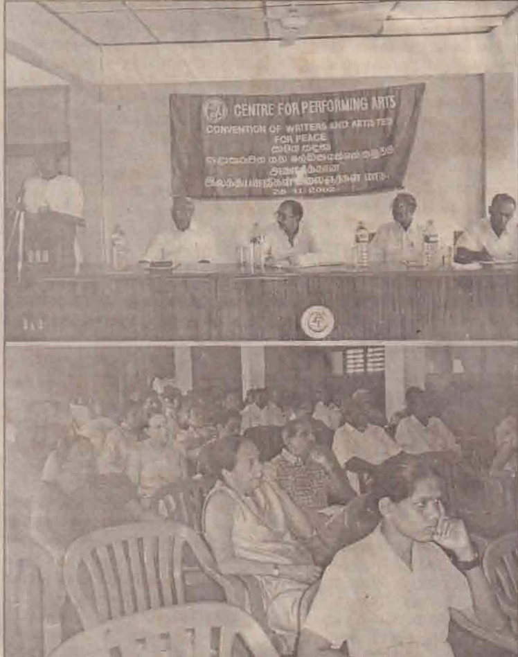
யாழ். திருமறைக்கடவமன்றத்தில் ஏற்பாட்டில் அமைதிக்கான இலக்கிய வாதிகள் மற்றும் கலைஞர்கள் மாநாடு நேற்று வெள்ளிக்கிழமை யாழ். பல நோக்குக் கூட்டுறவுச் சங்கக் கேட்போர் கூட்டத்தில் நடைபெற்றது.

பொது அமைப்புக் குழு நடவடிக்கை யாழ்ப்பாணம், நவ.30 உருப்பிராய் மேற்கு அன்னுங்கை பகுதியில் கசிப்பு உற்பத்தியும் விற்பனையும் இன்று முதல் முற்றாகத் தடைசெய்யப்பட்டுள்ளது என்று பொது அமைப்புக் குழு அறிவித்துள்ளது. இத்தடையை மீறுபவர்களுக்கு எதிராக உரிய நடவடிக்கை எடுக்கப்படும் என்று அந்த அமைப்பு எச்சரிக்கை விடுத்துள்ளது.