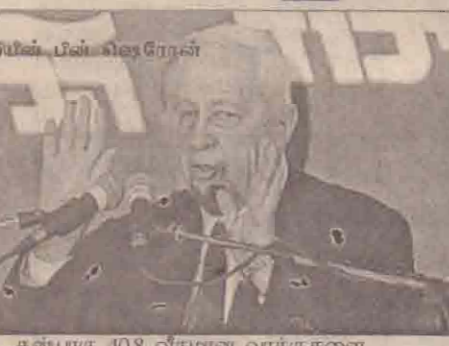
பெற்றியின் மீள் ஷெரோன்

ஜெருசலேம், நவ.30 இஸ்ரேலியப் பிரதமர் ஏரியல் ஷெரோனின் லிகுட் கட்சியின் தலைவர் பதவிக்கு நடைபெற்ற தேர்தலில் ஷெரோன் அவரை எதிர்த்து போட்டியிட்ட பென்லூயின் நெத்தன்யாகுவை கடுதலான வாக்கு வித்தியாசத்தில் தோற்கடித்து மீண்டும் கட்சித் தலைவராகியுள்ளார். நெத்தன்யாகுவை விட 15 சதவீத வாக்குகள் அதிகமாக பெற்றார் ஷெரோன். அவர் 55.8 சதவீதமான வாக்குகளையும் நெத்தன்யாகு 40.8 வீதமான வாக்குகளையும் பெற்றார். மூன்றாவதாகப் போட்டியிட்ட மோஷ் பிக்லின் 3.4 வீத வாக்குகளைப் பெற்றார். வலதுசாரிக் கட்சியான லிகுட் கட்சியின் தலைமைப் பதவியைக் கைப்பற்ற நெத்தன்யாகு கடுமையாக முயன்றபோதும் அது கைகூடவில்லை. அண்மையில் ஷெரோன் தலைமையிலான கூட்டணி அரசு கவிழ்ந்ததை அடுத்து நெத்தன்யாகு தலைமைப்