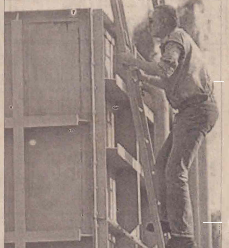
சராக் சென்றுள்ள ஐ.நா. ஆயுதக் கண்காணிப்பு அதிகாரி ஒருவர் அங்கு ஆயுத உற்பத்தி நிலை ஒன்றில் சேராதவை நடவடிக்கையில் ஈடுபட்டிருந்தபோது எடுக்கப்பட்ட படம் கிது

பதவியைக் கைப்பற்றுவது இலகுவாக இருக்கும் என்ற கருதப்பட்டது. எதிர்வரும் ஐனவரியில் நடைபெற உள்ள பொதுத் தேர்தலில் தனது கட்சியை வெற்றி நடைபோட வைக்கவேண்டிய பெரும் பொறுப்பு ஷெரோனின் தலையில் இருக்கின்றது. கட்சியின் தேர்தல் முடிவுகள் வெளியாகி ஷெரோன் வெற்றிபெற்றதாக நேற்று அறிவிக்கப்பட்டபோதும், கென்யாவில் இஸ்ரேலியர்கள்மீது தாக்குதல் நடத்தப்பட்டதில் 9 இஸ்ரேலியர்கள் உயிரிழந்ததற்கு அனுதாபம் தெரிவித்து தனது 'வெற்றிக் கொண்டாட்ட' நிகழ்வுகளை ஷெரோன் ரத்துச் செய்துவிட்டார். "இது வெற்றியைக் கொண்டாடும் தருணம் அல்ல. இது ஒரு வித்தியாசமான தான்" - என்றார் ஷெரோன். (ம)