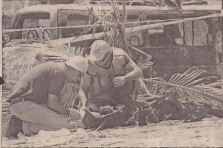
கென்யாவில் குண்டுவிடிப்பு கிடம்பெற்ற ஹோட்டலில் புலனாய்வுப் பணியில் ஈடுபட்டுள்ள இஸ்ரேலிய அதிகாரிகள்

நெரோபி, நவ.30 கென்யாவில் இஸ்ரேலிய இலக்குகள் இரண்டின்மீது அடுத்தடுத்து நடத்தப்பட்ட தாக்குதல்களையடுத்து அந்த நாட்டில் இருந்து தனது பிரஜைகளை இஸ்ரேல் வெளியேற்ற ஆரம்பித்துள்ளது. கென்யா நகரான மும்பாஸா நகரிலுள்ள ஹோட்டல் ஒன்றில் இஸ்ரேலியர்கள்மீது நடத்தப்பட்ட தற்கொலைத் தாக்குதல் மற்றும் இஸ்ரேலிய விமானமீது நடத்தப்பட்ட ஏவுகணைத் தாக்குதல் ஆகியவற்றை அடுத்தே இஸ்ரேல் இந்த நடவடிக்கையை மேற்கொண்டது. ஹோட்டலில் நடத்தப்பட்ட தாக்குதலில் காயமடைந்தவர்களை கென்யாவில் இருந்து இஸ்ரேலுக்கு அழைத்துச் செல்ல ஆரம்பித்தது முதல் அங்கிருக்கும் தனது பிரஜைகளையும் வெளியேற்றும் நடவடிக்கையை இஸ்ரேல் ஆரம்பித்தது. இந்த நடவடிக்கை நேற்றுமுன்தினம் இரவு ஆரம்பிக்கப்பட்டது. இதற்கென இரானுவத்தின் துருப்புக்காவலி விமானங்கள் பணியில் ஈடுபடுத்தப்பட்டுள்ளன. தாக்குதல்கள் தொடர்பான விசாரணைகளை மேற்கொள்ளுவதற்கென அமெரிக்க மற்றும் இஸ்ரேலிய அதிபர்கள் மும்பாஸாவுக்கு வந்துள்ளனர். இஸ்ரேலின் உளவு அமைப்பான மொஸாட்மும் இந்த விசாரணைகளில் இணைந்துள்ளது. அதேசமயம் - இந்தத் தாக்குதலை நடத்தியவர்களை நீதி என்றும் மன்னிக்காது என்றும் கென்ய அரசு தெரிவித்துள்ளது. தாக்குதல் தொடர்பாகத் தாம் இரு நபர்களை விசாரணை செய்து வருவதாகவும் ஆனால், தகவல்கள் எவையும் கிடைக்கவில்லை என்றும் கென்ய பொலீஸார் கூறினர். இந்தத் தாக்குதலுக்கு அடையாளம் தெரியாத ஆயுதக் குழு ஒன்று உரிமைகோரியுள்ளது. பலஸ்தீன அதிபர்கள் தெரிவித்தனர். பலஸ்தீனர்கள் அகதிகளாக்கப்பட்ட 55ஆவது ஆண்டு நினைவாக உலக நாடுகளின் காதல்களில் 'அகதிகளின் குரல்' ஒலிக்கவேண்டும் என்பதற்காகவே இந்தத் தாக்குதல் நடத்தப்பட்டதாக அந்தக் குழு தெரிவித்துள்ளது. (ம)