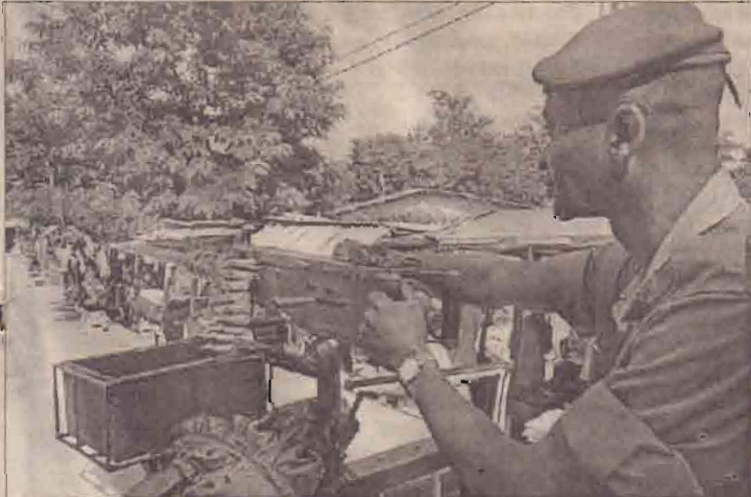
ஐவரிகோஸ்ட் நகர் ஒன்றில் படைகாப்புப் பணியில் ஈடுபட்டிருக்கும் சீப்பாய்

வாரங்களுக்கு முன்னர் இரு தரப்புகளும் புத்தறிந்துத் உடன்படிக்கை ஒன்றில் கையொப்பமிட்டன. ஆனால், சில தினங்களுக்கு முன்னர் கிளர்ச்சியாளர்களின் கட்டுப்பாட்டிலுள்ள வனவா நகரத்தை தாக்கினர். டாங்கிகள் ஆயுதம் தரித்த ஹெலிகாப்டர்கள் இந்தத் தாக்குதல் நடத்தப்பட்டது. இதையடுத்து கடந்த விடாமூன்று புதிய கிளர்ச்சிக் குழு ஒன்று அரசு கட்டுப்பாட்டிலுள்ள மண் என்ற நகரத்தைத் தாக்கியது. போர் நிறுத்த உடன்படிக்கை கையக் கண்காணித்து வரும் பிரான்ஸ் இராணுவம், இந்த மோதல்கள், உடன்படிக்கையைப் பாதிக்காது என்று தெரிவித்துள்ளது. (ம)