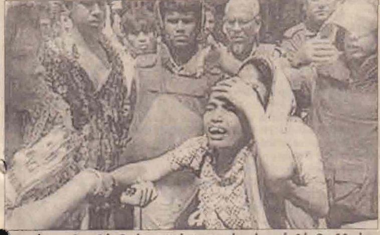
பங்களாதேஷில் நேற்று நடந்த துயரச் சம்பவத்தில் உயிரிழந்த சிறுவன் ஒருவரின் தாயார் கதறியபடி காட்சி.