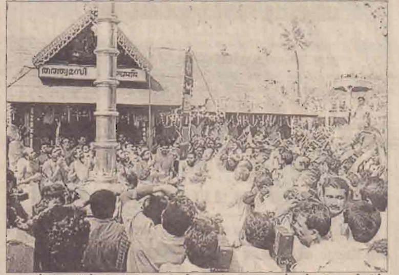
இந்தியாவின் கேரள மாநிலம் சபரிமலை ஜயப்பன் ஆலயத்தில் கடந்த சனிக்கிழமை கொடியேற்றத் திருவிழா கிடம்பெற்றபோது எடுக்கப்பட்ட படம்.

ரமழான் நேரண்பெறக்காலத்தில் வழங்கப்படும் தானத்தை பெறுவதற்காக மக்கள் முண்டியடிக்கும் போது உயிரிழப்புகள் ஏற்படுவது பங்களாதேஷில் அடிக்கடி இடம்பெறும் அனர்த்தம் என்று கூறப்படுகிறது. (ஒ)