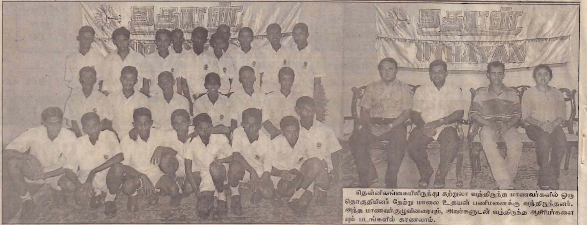
தென்னிங்கையிலிருந்து சுற்றுலா வந்திருந்த மாணவர்களில் ஒரு தொகுதியினர் நேற்று மாலை உதயன் பணியனைக்கு வந்திருந்தனர். அந்த மாணவர்களுவினரையும், அவர்களுடன் வந்திருந்த ஆசிரியர்களையும் படங்களில் காணலாம்.