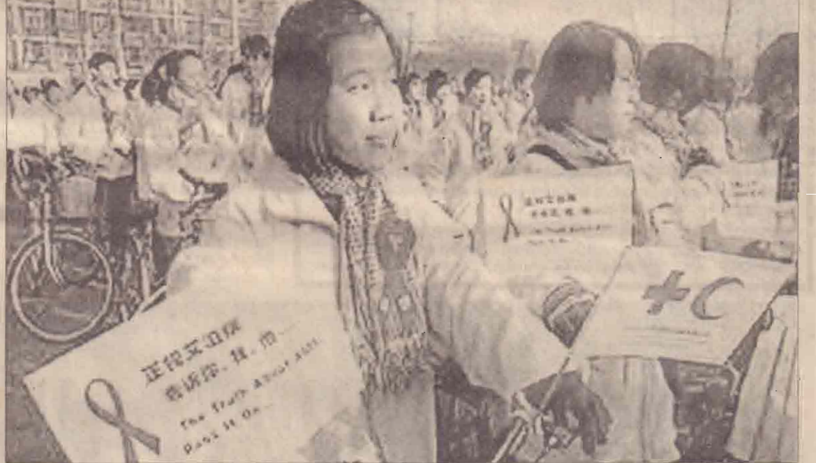
15 ஆவது உலக எய்ட்ஸ் தினம் நேற்று உலகம் முழுவதும் அனுஷ்டிக்கப்பட்டது. இத்தினத்தைவியாட்டி ஐ.நா. வெளியிட்ட அறிக்கையில் 'எய்ட்ஸ்' நோய் தொற்றுக்குள்ளானவர்களை ஒதுக்கும் பழக்கத்தை மனிக் சமுதாயம் கைவிடாத வரை எய்ட்ஸ் நோயை முற்றாக ஒழிக்க மேற்கொள்ளப்படும் முயற்சிகள் வெற்றியளிக்கப்போவதில்லை என்று குறிப்பிடப்பட்டுள்ளது.

கண்டுபிடிக்கப்பட்டது. எனினும், ஆள்புற்றுக்குறை காரணமாக போலீஸார் இதுவரை இந்த ஊழல் தொடர்பாக 39 பேரை மட்டுமே கைது செய்துள்ளனர். இத்திட்டமேல் வழிட்டுக்கணைப்பயன்படுத்தி பிரிட்டனுக்குள் நுழையவர்கள் எந்தவித சிரமமும் இன்றி பிரிட்டிஷ் குடிமக்களாகவே வாழும் வசதி இருப்பதாகக் கூறப்படுகின்றது. இது தீவிரவாதிகளுக்கு மிகவும் வாய்ப்பாக அமைந்துள்ளதாகக் கூறப்படுகின்றது. (ஒ)