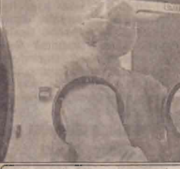
கடுப்பு மருந்து தொடர்பான ஆய்வுகூடப் பணியில் ஈடுபட்டிருக்கும் பெண் ஒருவர்

அனைத்து இந்தத் தடைமருந்து உற்பத்தி அடுத்த வருட ஆரம்பத்திலேயே தொடங்கப்படும் என்று எதிர் பார்க்கப்படுகின்றது. 2004 ஆம் ஆண்டளவில் கையிருப்பு இருக்கும் அளவுக்கு தடுப்புமருந்து உருவாக்கப்பட்டுவிடும். (ம)