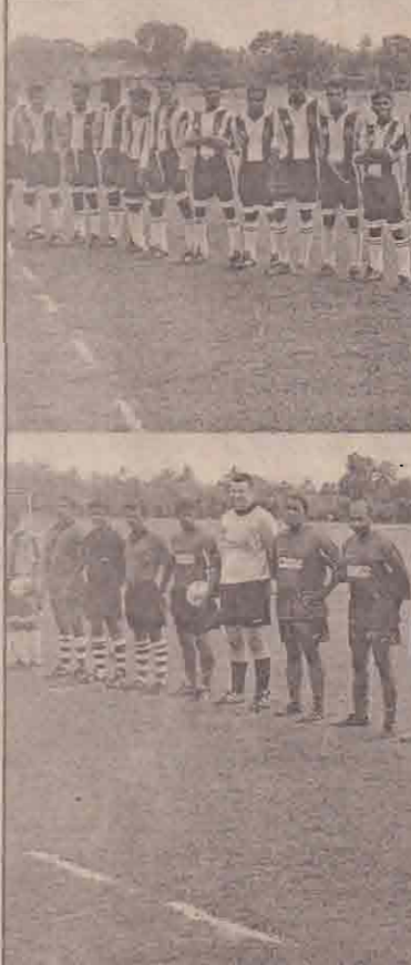
லண்டனிலிருந்து வருகை தந்திருந்த சென்னை உட்கழைத்தாட்ட அணி மினுக்கும் யாழ்ப்பெண்க்கை அணிமீறக்கும். கிளப்புவை சீர்திருத்த உட்கழைத்தாட்டமீறும் நடைபெறப்போகும் எடுக்கப்பட்ட படங்கள். பல்கலைக்கழக அணியினரை முதல் படத்திலும் லண்டன் சென்னை அணியினரை இரண்டாவது படத்திலும் காணலாம்.

தது குறித்து விளக்கமளித்தபோது அமைச்சர் இதனைத் தெரிவித்தார். நடமாடும் சேவையின் முதல் பதிவுகளைப் பதிவுகள் மட்டுமே இடம்பெறும். இறுதி இரண்டு தினங்கள் மட்டுமே கொடுப்பனவுகள் வழங்கப்படும். குடாநாட்டில் ஆல்யங்கங்கள், மத நிறுவனங்கள் நிர்வாக இயக்குநர்கள், நிதிமன்ற விசாரணைகளில் இருப்பதனாலும் எடுத்தல்வேண்டிய ஆல்யங்கங்களின், நிறுவனங்களின் சரியான நிர்வாக அமைப்புகளை அடையாளம் காண முடியாத நிலை இருந்ததாலும் பரிசீலனையின் பின்னரே கொடுப்பனவுகளை அனுதிக்கலாம். - இவ்வாறு அமைச்சர் மேலும் தெரிவித்தார். (டி)