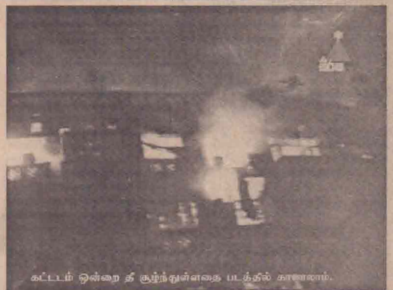
கட்டடம் ஒன்றை தீ சூழ்ந்துள்ளதை படத்தில் காணலாம்.

கொழும்பு, டிசெ. 18 இந்தியாவில் தங்கியுள்ள இலங்கைத் தமிழ் அகதிகளை திருப்பி அனுப்பத்து அவர்களை மீளக் குடியமர்த்துவது குறித்து ஆராய்வதற்காக எதிர்வரும் 20 ஆம் திகதி கிளிநொச்சியில் 'சிரான்' அலுவலகத்தில் மாநாடு ஒன்று நடைபெறவுள்ளது. இந்த மாநாட்டில் இந்தியத் தூதர் (12 ஆம் பக்கம் பார்க்க)