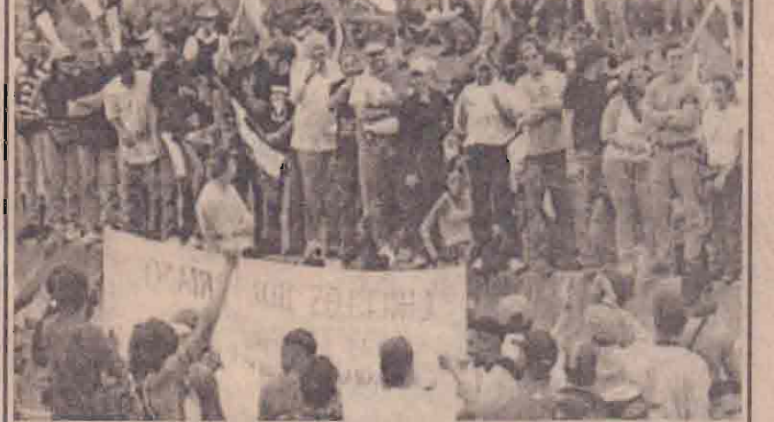
கலைநகர் கார்கலில் அதிபரின் ஆதரவாளர்களும் (கீழ்ப்பகுதி) எதிர்க்கட்சி ஆதரவாளர்களும் எதிரெதிரே சிறுநில ஆர்ப்பாட்டத்தில் ஈடுபட்டுள்ள காட்சி.

இதற்கிடையில் எதிர்ப்பு ஆரம்பித்ததில் ஈடுபட்டுள்ள எதிர்க்கட்சி ஆர்ப்பாட்டக்காரர்களுக்கும் பொலீஸாருக்கும் இடையே கலவரங்கள் இடம்பெற்றுள்ளன. பொலீஸார் மீது ஆர்ப்பாட்டக்காரர்கள் கற்களையும் எரிபும் ரயங்களையும் வீசித் தாக்கியதைத் தடுப்பதற்காக பொலீஸார் ஆர்ப்பாட்டக்காரர்கள் மீது கண்ணீர் புகைக் குண்டுகள் மற்றும் ரப்பர் குண்டுகளைக் கொண்டு தாக்குதல் நடத்தினர். தலைநகர் கார்கலில் இந்தச் சம்பவங்கள் இடம்பெற்றுள்ளன.