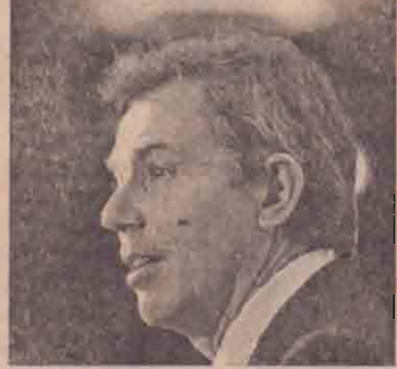
கனம் சமாதானமாகவும் பாதுகாப்பாகவும் வாழ்வதற்காக அதிபர் புஷ்

"மத்திய கிழக்கு பிரச்சினையைத் தீர்க்க சர்வதேச சமூகம் எவ்வாறு உதவமுடியும் என்று ஆய்வுகூற தற்போது முக்கியம். பலஸ்தீனர்களுக்கும் இஸ்ரேலியர்களுக்கும் இடையில் சமாதான முயற்சிகள் வெற்றிபெற வேண்டும். எனவே இரு நாட்டு மக்