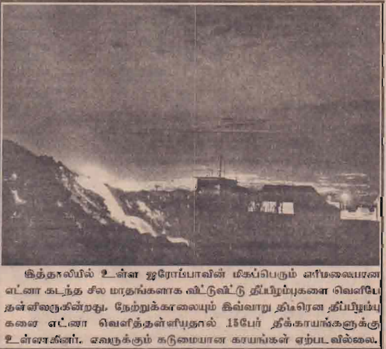
இத்தாலியில் உள்ள ஐரோப்பாவின் மிகப்பெரும் எரிமலைபான எட்னா கடந்த சில மாதங்களாக விட்டுவிட்டு தீப்பிழம்புகளை வெளியே தள்ளவேறுகின்றது. நேற்றுக்காலையும் கிவ்வாறு திடீரென தீப்பிழம்புகளை எட்னா வெளித்தள்ளியதாக 15 பேர் தீக்காயங்களுக்கு உள்ளாகினர். உலகாக்கும் கடுமையான காயங்கள் ஏற்படவில்லை.

ஏந்தக் காரணத்தை முன்னிட்டும் இரு தரப்புகளும் மீண்டும் போருக்குத் திரும்பமாட்டா.