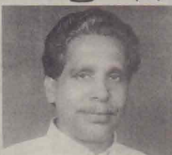
ஒரு கட்சியைச் சேர்ந்த ஒருவருக்கு மத்தியப் பதவியும், மற்றக் கட்சியைச் சேர்ந்தவருக்கு உப சபாநாயகர் பதவியும் அந்த அரசினால் வழங்கப்பட்டிருந்தன.

தமிழ்த் தேசிய இனத்தின் ஏகப் பரிநீதிக்காக தமிழ் விடுதலைப் புலிகள் மாத்திரமே என்றும் - பிரகடனப்படுத்தி, தமிழ் மக்கள் முன் சென்று மகத்தான ஆணையைப் பெற்ற தமிழ்த் தேசிய கூட்டமைப்பு நாடாளுமன்ற உறுப்பினர் என்றும் எந்தச் சந்தர்ப்பத்திலும் இத்தகைய ஏதாவது பதவியையும் ஏற்றுக்கொள்வதை இந்தக் கூட்டமையில் அங்கம் வகிக்கும் எமது ரெலோ இயக்கம் எதிர்த்துள்ளது. 1965-69 காலகட்டத்தில் காலஞ்சென்ற டட்லி சேனநாயக்கவின் தலைமையில் ஏழு கட்சிகள் சேர்ந்து அமைத்திருந்த தேசிய அரசில் அன்றைய இரண்டு பிரதான தமிழ்க்கட்சிகளும் அங்கம் வகித்திருந்தபோது,