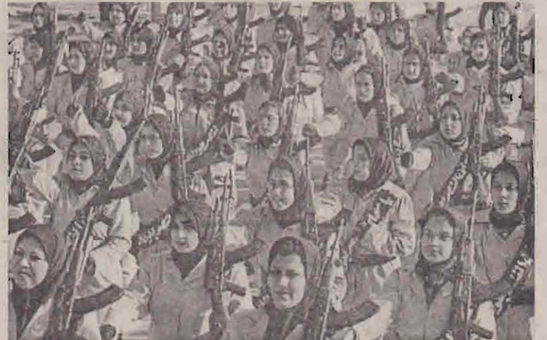
போர் அச்சுறுத்தல் ஈராக்கை சூழ்ந்துகொள்ளும் கிள்வேனையில், நேற்று பக்தாத்நிலை கிடம்பெற்ற இராணுவ அணிவகுப்பின்போது ஈராக்கிய மகளிர் சூணைப் படையணி அணிவகுத்துவரும் காட்சி. சிவர்களில் குடும்பப் பெண்களும் பாடசாலை மாணவியரும் அடங்கியிருந்தமை குறிப்பிடத்தக்கது.

தின் இராணுவ விமானத் தளத்திலிருந்து புறப்பட்டுச் சென்றன. இதேவேளை, ஈராக்கில் பேரழிவு ஆயுதங்கள் இருப்பதற்கான சான்றுகள் எவற்றையும் பரிசோதகர்கள் இதுவரை கண்டுபிடிக்கவில்லை என்று சர்வதேச அணுசக்தி நிறுவனத்தின் தலைவரான மொஹமட் எப்பரூட் தெரிவித்துள்ளார். ஐ.நாவுக்கு ஈராக்கில் சமர்ப்பித்த அறிக்கையில் பொய்யான தகவல்கள் இருப்பதாகத் தெரியவில்லை என்றும் அவர் கூறினார். (ஏ)