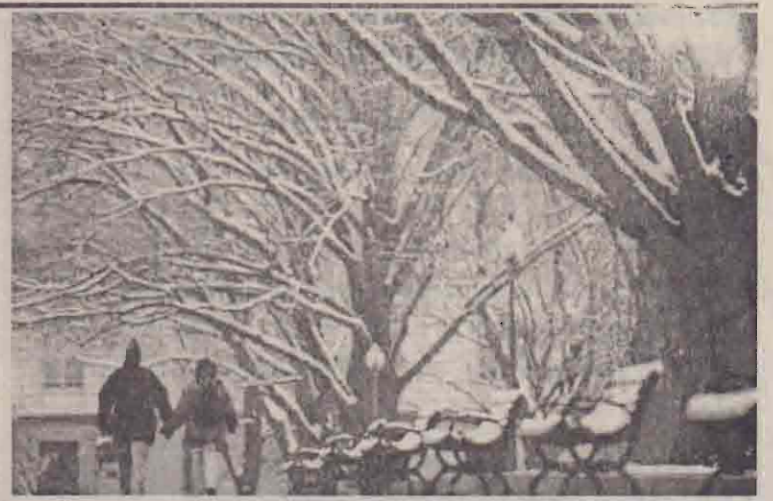
அமெரிக்க, ஐரோப்பிய நாடுகளில் தற்போது கடும் குளிர் நிலவுகிறது. பனிப்பொழிவும் அதிகம் உள்ளது. அமெரிக்காவின் வாஷிங்டன் நகரில் சீல அங்குல உயரத்துக்கு பனியால் மூடப்பட்ட வீதவழியே ஜோடி ஒன்று செல்வதைப் படத்தில் காணலாம்.

பிலிப்பைன்ஸ் தீவில் நிலநடுக்கம் ஹொங்கொங்.ஜன.8 பிலிப்பைன்ஸ் நாட்டைச் சேர்ந்த படான் தீவில் கடந்த திங்கட்கிழமை இரவு கடுமையான நிலநடுக்கம் ஏற்பட்டது. ரிசுட்ரர் அளவில் இது 5.6 ஆக இருந்ததாக ஹொங்கொங் வானிலை ஆராய்ச்சி மையம் தெரிவித்துள்ளது. இதனால் ஏற்பட்ட சேதம் குறித்த தகவல்கள் எதுவும் உடனடியாக வெளியாகவில்லை.