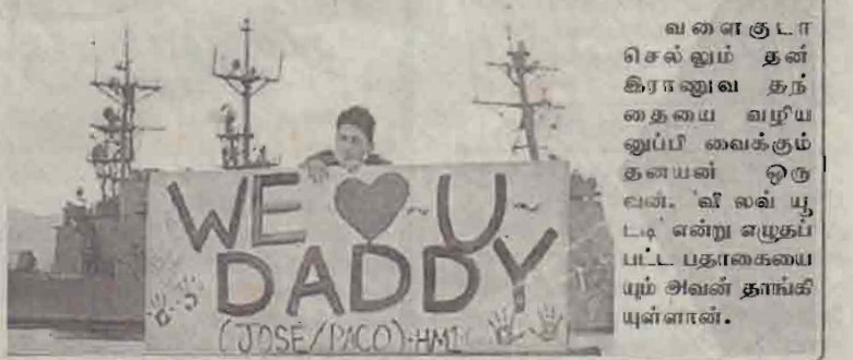
வளைகுடா செல்லும் தன் கிரானாவ தந்தையை வறிய வுப்பி வைக்கும் தாயன் ஒருவர். 'வி லவ் யூ டட்' என்று எழுதப்பட்ட பதாகையையும் அவள் தாங்கியுள்ளாள்.

இதற்கிடையில் - ஈராக் மீதான போருக்கான ஏற்பாடுகளை அமெரிக்கா தொடர்ந்தும் தீவிரமாக மேற்கொண்டுவருகிறது. ஆயிரக்கணக்கில் அமெரிக்கத் துருப்பினரும் கடற்படைக் கலங்களும் தொடர்ந்தும் வளைகுடாப் பகுதிக்கு அனுப்பப்பட்டு வருகின்றன. (10)