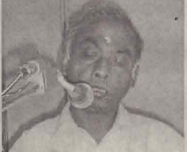
யாழ்ப்பாணம், ஜன. 18

வெள்ளத்தினால் பாதிக்கப்பட்ட குடும்பங்களுக்கு மூன்று நாட்களுக்கு உலர் உணவும் பொருள்களும், இடம் பெயர்ந்த குடும்பங்களுக்கு மூன்று நாட்களுக்கு சமைத்த உணவும் வழங்குவதென இக்கூட்டத்தில் முடிவு செய்யப்பட்டது. (9)