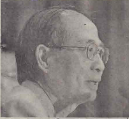
சமாதானத்தைக் கட்டியமூலப் முயலும் இலங்கை அரசின் நடவடிக்கைகளுக்கு புரண ஆதரவை ஜப்பான் அரசு வரங்கும், ஜனநாயக

இந்து கலாசார அமைச்சர் ஏற்பாடு யாழ்ப்பாணம், ஜன.19 யாழ்ப்பாணத்தில் - ஆணைப்பத்திர்ப் பகுதியில் - இந்து கலாசார அமைச்சர் கிளைல் நிறுவப்பட்டிருக்கும் வேதாசல குருகுல கலாசாலையை நாளை திறந்து வைக்கப்பட உள்ளது. நாளை யாழ்ப்பாணத்துக்கு வருகை தரவிருக்கும் எதிர்க்கட்சித் தலைவர் மஹிந்த ராஜபக்ஷ குருகுல கலாசாலையை சமீபநாட்டில் உயர்நிலைமகத் திறந்து வைக்கவுள்ளார். அன்று காலை 10 மணிக்கு திறப்பு விழா வைவல் கோவாகையாக நடைபெறுவதாகும். சுமார் 500-க்கும் குடியான இந்துக் குருகுலக் கலாசாலையை நிறுவப்பட்டிருக்கிறது. இது தொடர்பாக இந்த விவகார அமைச்சர் நேற்று அறிக்கை ஒன்றை விடுக்கிறார். யாழ்ப்பாணத்தில் பயிற்றுவிப்பதற்கான இக்குருகுலம் இத்தூதரின் சமய விவகார அலுவலகங்கள் அமைச்சரின் நிதி உதவியினால் உருவாக்கப்பட்டு வருகிறது. இக்குருகுலம் (16ஆம் பக்கம் பார்க்க)