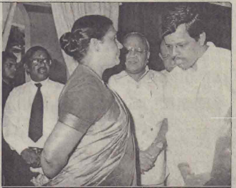
ஜனாதிபதி மாளிகையில் நடந்த பொங்கல் விழாவின்போது ஜனாதிபதி சந்திரிகா குமாரதாங்கவும் அமைச்சர் மகேஸ்வரனும் முக்கியமாகக் கலந்துகொண்டுவதைக் காணலாம்.

அடுத்த வாரமும் சந்திப்பதற்கு ஏற்பாடு கொழும்பு, ஜன.19 இன்று சமய விவகார அமைச்சர் தியாகராஜா மகேஸ்வரன் நேற்று ஜனாதிபதி சந்திரிகா குமாரதாங்கவுடன் முக்கிய பேச்சு நடத்தியிருக்கிறார். ஜனாதிபதியின் ஏற்பாட்டில் - ஜனாதிபதி மாளிகையில் - நேற்று நடந்த பொங்கல் விழாவில் கலந்து கொண்ட அமைச்சர் மகேஸ்வரன், பின்னர் ஜனாதிபதியுடன் தனிமுக சமர் அவர் மணிநேரம் பேச்சு நடத்தினார். இந்தப் பேச்சின்போது அமைச்சர் மகேஸ்வரன் வடக்கு - கிழக்கு மக்களின் பிரச்சினைகள் தொடர்பாக ஜனாதிபதியிடம் பல கோரிக்கைகளை முன்வைத்தார் என்று அமைச்சர் வட்டாரங்கள் தெரிவித்தன. வடக்கு - கிழக்கின் தமிழ் மக்களின் மீள் குடியமர்வு, குடாநாட்டில் உயர் பாதுகாப்பு வலயங்களில் மக்களின் குடியமர்வு, சிறைகளில் தடுத்து வைக்கப்பட்டிருக்கின்ற தமிழ் மக்களின் விடுதலை, வடக்குதீபில் இராணுவத்தினரால் கைதுசெய்யப்பட்ட பின்னர் காணாமற்போனவர்களின் கதி, தமிழ் இளைஞர், யுவதிகளின் வேலை வாய்ப்பு, தமிழ் மக்களின் பாரம்பரியம், கலை கலாசாரம் என்பவற்றைப் பேசும் எடுக்கப்பட வேண்டிய நடவடிக்கைகள் என்பன தொடர்பாக மகேஸ்வரன் ஜனாதிபதியுடன் பேசினார். சமாதானச் சூழ்நிலை ஏற்பட்ட பின்னரும் தமிழ் மக்கள் அனுபவிக்கின்ற இராணுவ அழுத்தங்கள் தொடர்பாகவும் அமைச்சர் ஜனாதிபதிக்கு விளக்கினார். அமைச்சர் முன்வைத்த கோரிக்கைகள் தொடர்பாக சாத்தியமான பல நடவடிக்கைகளை எடுப்பதாக ஜனாதிபதி உறுதி அளித்தார் என்று இன்று கலாசார அமைச்சரின் பேச்சாளர் ஒருவர் பின்னர் தெரிவித்தார். இந்த விடயங்கள் பற்றி தொடர்ந்து (16ஆம் பக்கம் பார்க்க)